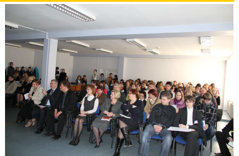
Akimirka iš konferencijos „Mokslo šaknys 2011“