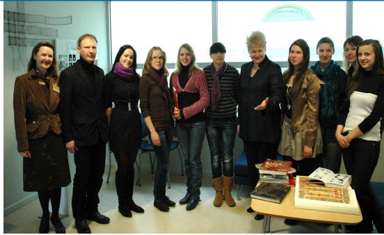
Bendra parodos autorių nuotrauka atminimui