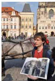
Foto: politisch-historischer Stadtrundgang durch Prag

In der deutsch-tschechischen Geschichte gibt es viel Verbindendes aber auch Trennendes. Die Reise möchte Einblicke in Geschichte, Kultur und Politik des Nachbarlandes ermöglichen, wobei im Mittelpunkt die deutsch-tschechi- schen Beziehungen in der Vergangenheit und der Gegenwart stehen. Mitveranstalter ist die Brücke/Most-Stiftung.