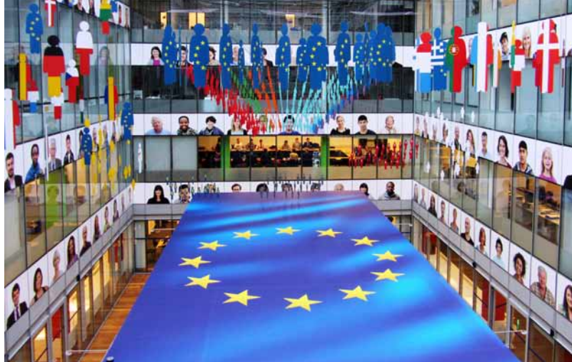
Foto: Besucherzentrum der Europäischen Kommission in Brüssel.