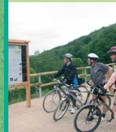
Naturerlebnis Oberes Ahrtal