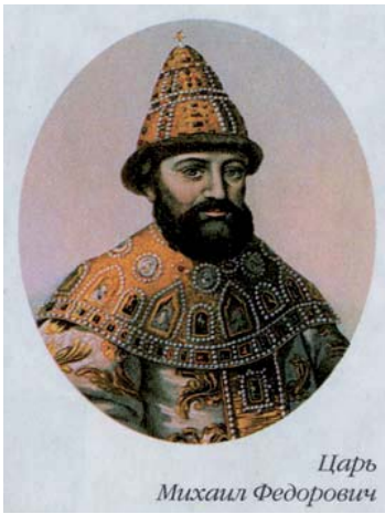
Царь Михаил Федорович

Б едствия Смутного времени потрясли русских людей. Многие современники винили во всем самозванцев, в которых видели польских ставленников. Однако это была лишь полуправда, так как почву для самозванства подготовили не соседи России, а глубокий внутренний недуг, поразивший русское общество. Самозванство явилось одним из специфических и устойчивых форм антифеодального движения в России XVII века.