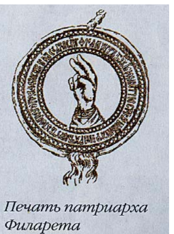
Печать патриарха Филарета