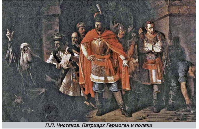
П.П. Чистяков. Патриарх Гермоген и поляки

В начале своей деятельности Петр I сосредоточил усилия на борьбе за выход России в Азовское и Черное моря. Осенью 1686 года начался поход на Крым. Во главе сотысячного войска выступил князь Б.В. Голицын. Для связи с войсками 30 марта 1687 года велено было «учинить от Москвы до Ахтырска и до Коломки почту в 17 мстах... А поставить на стенах коношного чину да стрельцов по четыре человека, для гоньбы дать им по две лошади человеку...» Первый стан был в Москве на Житном дворе, второй – на Пахре. Эта почта была так же плохо организована,