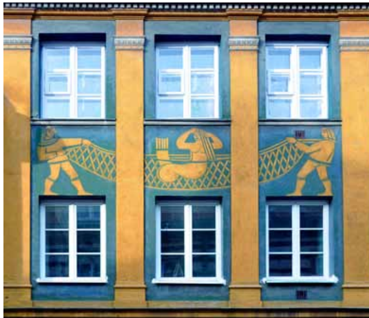
Дом на ул. Кошцельна, 8/8А

Когда о ней узнал один купец, он быстро смекнул, сколько можно заработать, показывая русалку на ярмарках. Он хитростью поймал ее и запер в сарае без доступа к воде. Плач русалки услышал сын рыбака, который при помощи своих друзей освободил ее. Благодарная Русалка пообещала своим избавителям, что в случае надобности они также могут рассчитывать на ее помощь. И с тех пор варшавская Русалочка, вооруженная щитом и мечом охраняет город и его жителей.