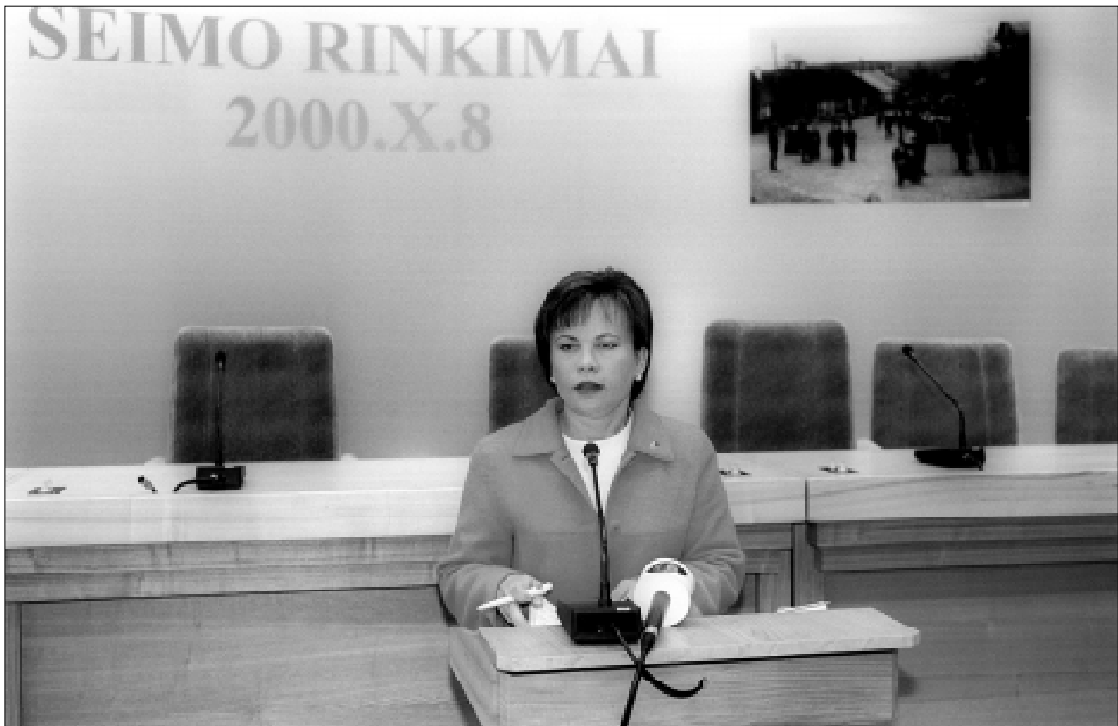
Seimo Pirmininko pavaduotoja Rasa Juknevičienė