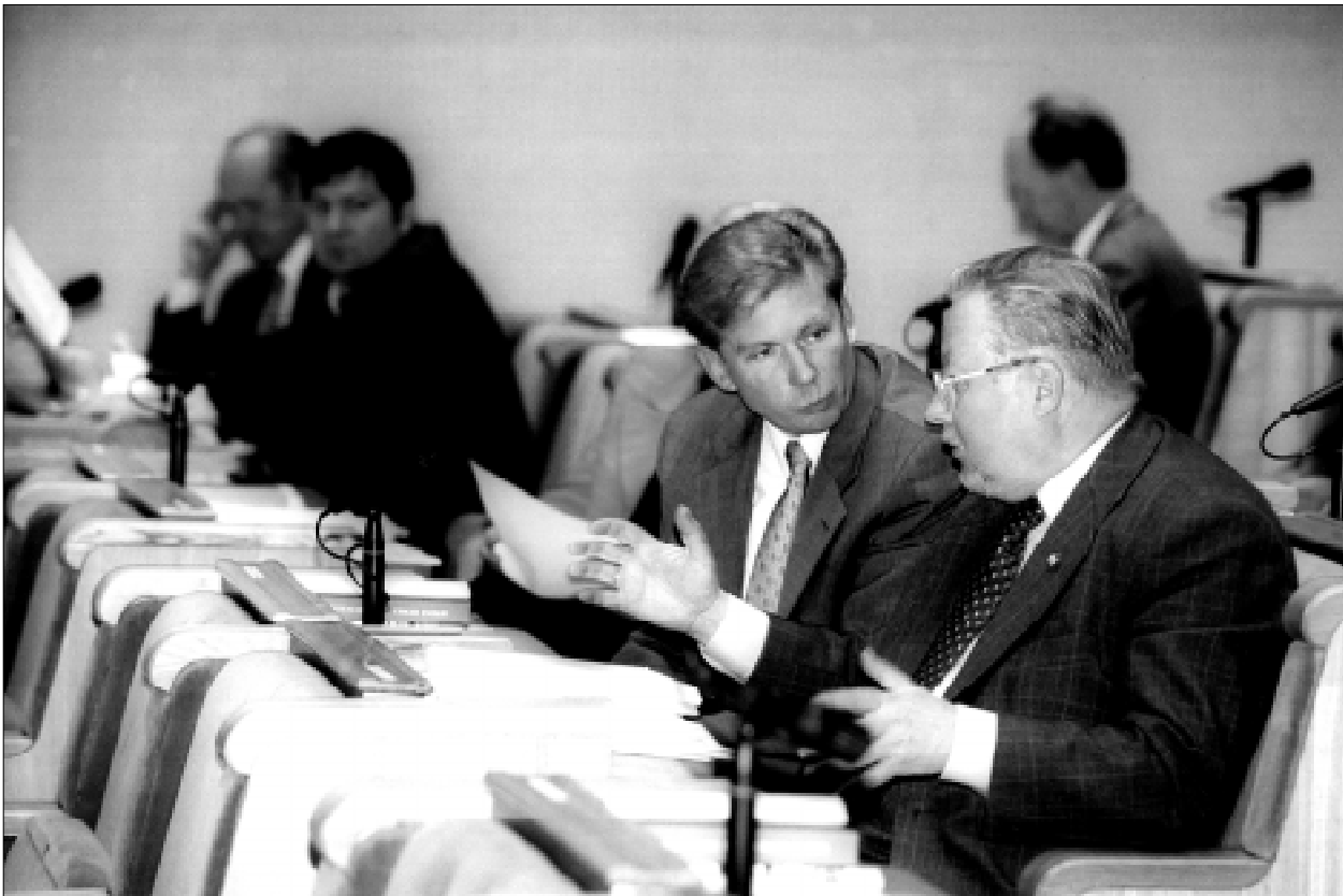
Užsienio reikalų komiteto pirmininkas Audronius Ažubalis, Seimo Pirmininkas Vytautas Landsbergis