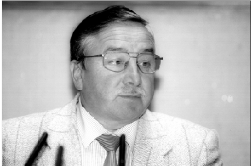
Valdymo reformų ir savivaldybių reikalų ministras Jonas Rudalevičius

Projektui po pateikimo pritar- ta, nutarta pradėti jo svarstymo procedūrą. Pagrindiniu komitetu šiam įstatymo projektui svarstyti