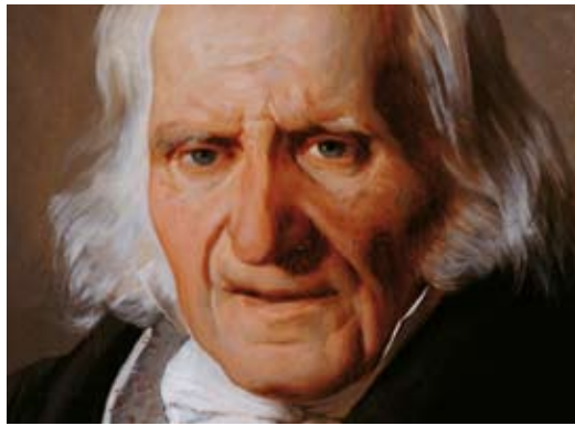
Samuel Hahnemann begründete im 18. Jahrhundert die Homöopathie, deren Geschichte einer der Forschungsschwerpunkte des Instituts für Geschichte der Medizin ist.

Malaria bei Kindern. Am IKP waren 2008 insgesamt 88 Mitarbeiter beschäftigt. Wissenschaftliche Mitarbeiter sowie Doktoranden und Diplomanden bilden das wissenschaftliche Stammpersonal von 51 Personen. Es wurden vier Dissertationen und vier Diplomarbeiten erfolgreich abgeschlossen. Eine Mitarbeiterin legte die Facharztprüfung »Ärztin für Klinische Pharmakologie« ab. Im Jahr 2008 erhielt das IKP 1,2 Millionen Euro an Drittmitteln von der Deutschen Forschungsgemeinschaft (DFG), dem Bundesministerium für Bildung und Forschung (BMBF), der Europäischen Forschungsunion, der Deutschen Krebshilfe, der Dr. Mildred Scheel Stiftung, von weiteren Institutionen und aus der Industrie.