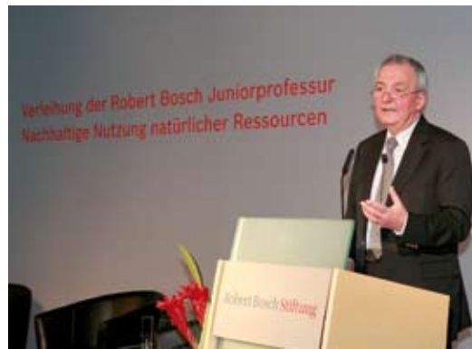
Professor Klaus Töpfer, Bundesumweltminister a.D. und ehemaliger Exekutivdirektor des UN-Umweltprogramms, ist Vorsitzender des Expertenbeirats der Juniorprofessur »Nachhaltige Nutzung natürlicher Ressourcen«.