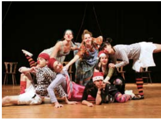
Das Schülerfestival »Approche!« erhielt den ersten Preis im deutsch-französischen Ideenwettbewerb »On y va – auf geht's!«.