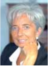
Christine Lagarde, Ministre de l'Economie, des Finances et de l'Emploi