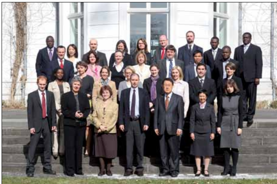
Сотрудники Трибунала (2011 год)

ведет Список дел и обеспечивает хранение сообщений и соглашений, как того требует Регламент.