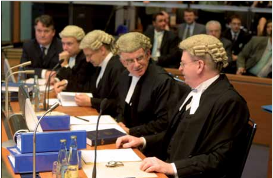
Дело о заводе по производству МОКС-топлива (Ирландия против Соединенного Королевства)