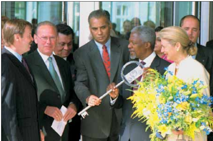
Вручение ключа на официальном открытии здания штаб-квартиры, 3 июля 2000 года

3 июля 2000 года Его Превосходительство Генеральный секретарь Организации Объединенных Наций г-н Кофи Аннан официально открыл помещения штаб-квартиры Трибунала. Они располагаются в гамбургском квартале Нинштедтен по адресу: Am Internationalen Seegerichtshof 1.