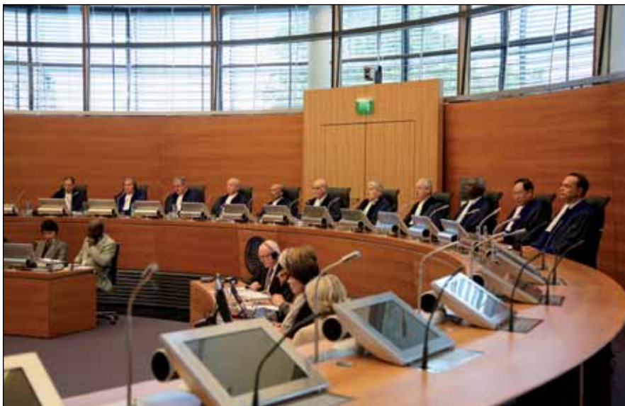
Камера по спорам, касающимся морского дна, «Обязанности и обязательства государств, поручившихся за физических и юридических лиц применительно к деятельности в Районе»

По просьбе сторон Трибунал может учреждать камеры ad hoc для рассмотрения конкретного спора. Состав таких камер определяется Трибуналом с одобрения сторон.