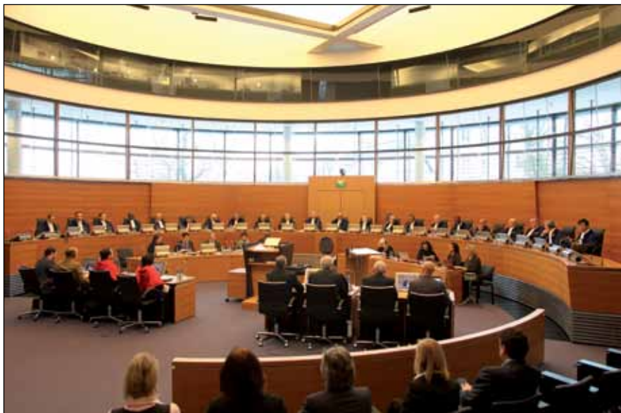
Дело о теплоходе «Луиза» (Сент-Винсент и Гренадины против Королевства Испания)

Среди судей не может двух граждан одного и того же государства. Если в составе Трибунала или его камеры нет судьи, состоящего в гражданстве одной из сторон в споре, эта сторона может избрать какое-либо лицо, которое будет заседать в качестве судьи (судья ad hoc ). Если у нескольких сторон имеется общий интерес, то они для этой цели рассматриваются как одна сторона.