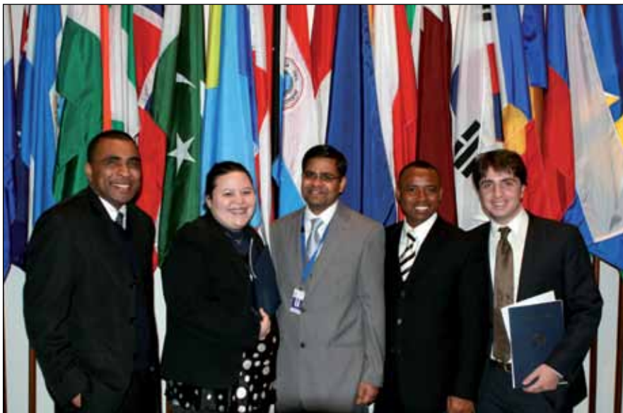
Участники программы Фонда «Ниппон» в 2009 году

Программа МТМП/Фонда «Ниппон» по наращиванию потенциала и обучению в вопросах урегулирования споров согласно Конвенции призвана дать государственным чиновникам и исследователям возможность пройти продвинутое юридическую подготовку, посвященную урегулированию международных споров согласно Конвенции.