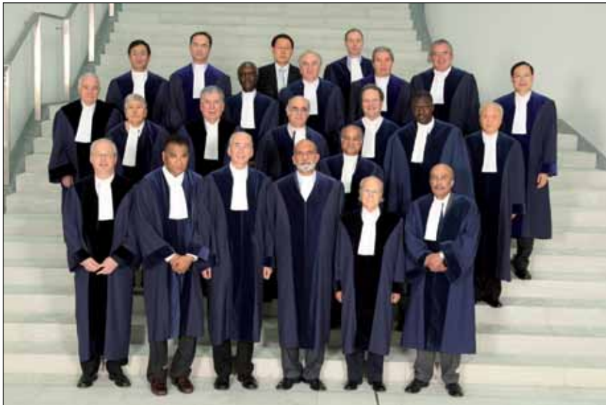
Судьи МТМП (2009 год)

Трибунал состоит из 21 судьи, избираемых государствами — участниками Конвенции; в работе ему помогает Секретариат (международная канцелярия). Местопребыванием Трибунала является Гамбург (Германия). Его официальные рабочие языки — английский и французский.