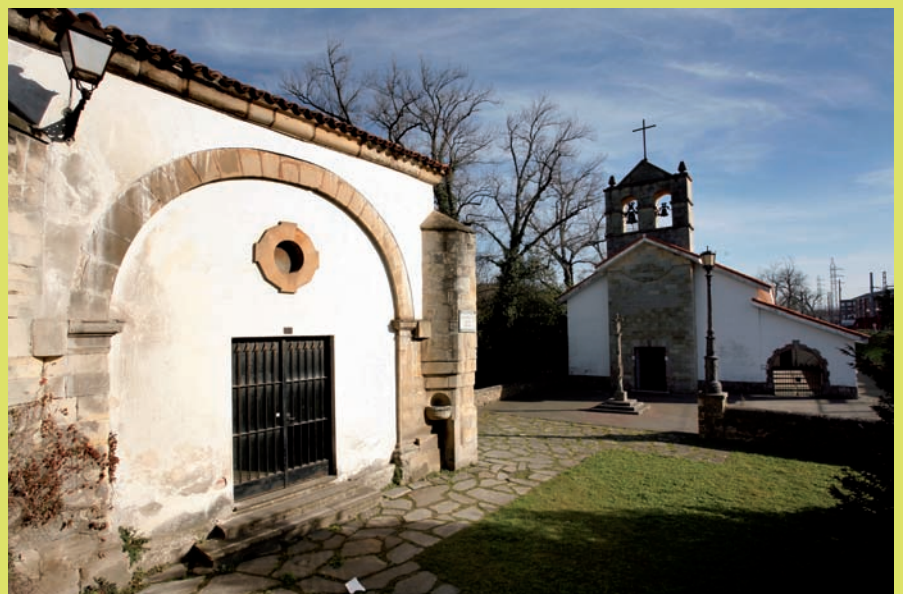
La ermita de los Valles, en Puente San Miguel.

El Saja, uno de los principales ríos de Cantabria, que tiene su nacimiento en los puertos de Sejos, atraviesa el municipio de Oeste a Este, camino de Torrelavega, donde une sus aguas al Besaya para después acabar en la ría de Suances. A lo largo de su curso por Reocín dispone de un coto truchero muy apreciado por los pescadores de toda la región: el de Caranceja, situado en las inmediaciones del puente de Golbaro (el primero de hormigón construido en España). Cerca de Villapresente, junto a la presa del antiguo molino de Bustamante, hay