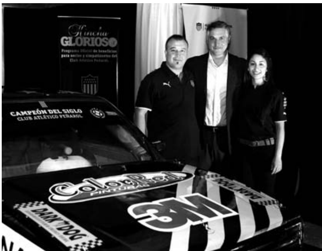
Imagen Digital: Alcides Zapico