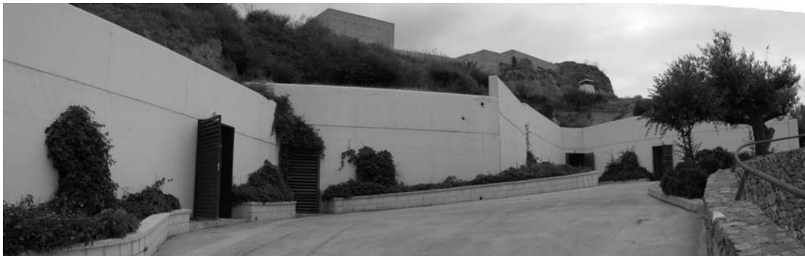
Figura 1: Frente principal de fachada de seis de las Casas cueva a musealizar. Sobre ellas se perfilan las murallas restauradas del Castillo de Nogalte (J. Pajarón).