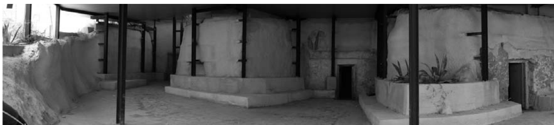
Figura 2: Conjunto de Casas cueva (3) que se destinarán a acoger la Casa Taller del Artesano (J. Pajarón).