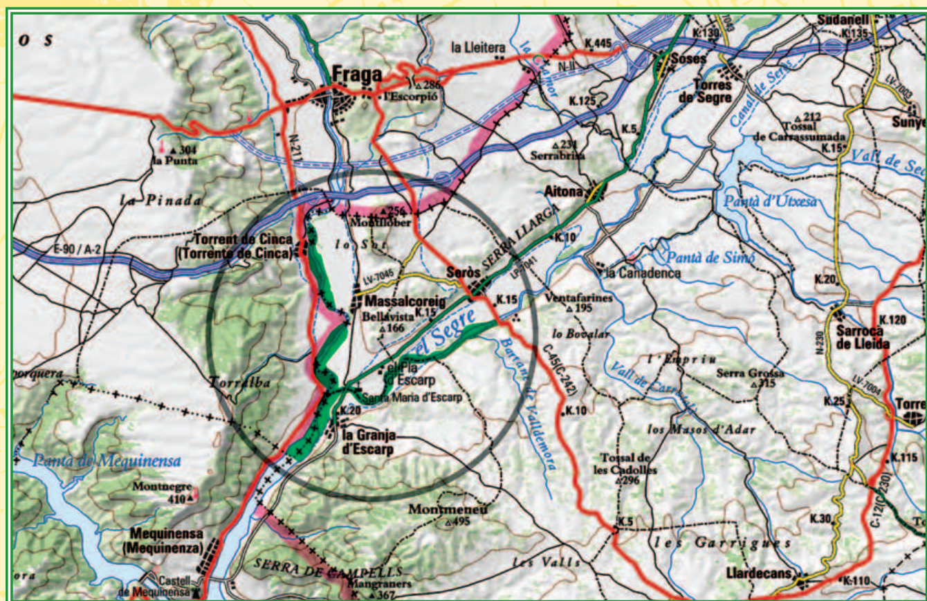
Dipòsit legal: L-1182-02. Edita: Dian Segre SL. Disseny: Pepo Curià

L'àmplia làmina d'aigua de l'aiguabarreig, amb freqüents illetes i canyissars que la poblen, és l'hàbitat idoni per a multitud d'ocells, tant sedentaris com migratoris, que troben aquest espai que limita amb l'Aragó per sojornar-hi i reproduir-s'hi.