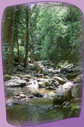
La source minérale