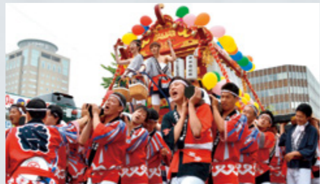
とまこまい港まつり