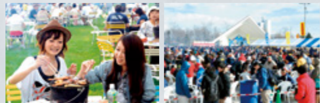
たるまえサンフェスティバル