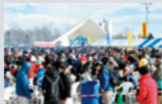
とまこまいスケートまつり