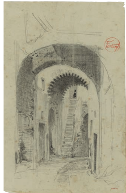
Marià Fortuny. Zauia (cenobi religiós) Nasiria de Sidi Bennacer al carrer Ahfir de Tetuan , 1860. Museu Nacional d'Art de Catalunya, Barcelona

L'artista va plantejar una visió panoràmica del combat i va disposar els personatges principals a la part central de la tela, formant el vèrtex superior d'un triangle, a partir del qual es despleguen, com un ventall, diversos grups de figures distribuïts pel primer terme, que presenten diverses anècdotes. Les més properes a l'espectador detallen la desfeta absoluta de l'enemic.