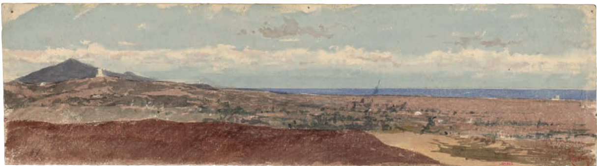
Marià Fortuny. Paisatge marroquí (estudi per a La batalla de Tetuan ), cap a 1860-1862. Museu Nacional d'Art de Catalunya, Barcelona

Entre les obres que s'exposen, destaca una selecció important dels dibuixos preparatoris i els apunts del natural, en molts dels quals es percep l'interès del pintor pel paisatge i l'arquitectura africans i, sobretot, per la vida quotidiana i els costums dels seus habitants. Fortuny dibuixa