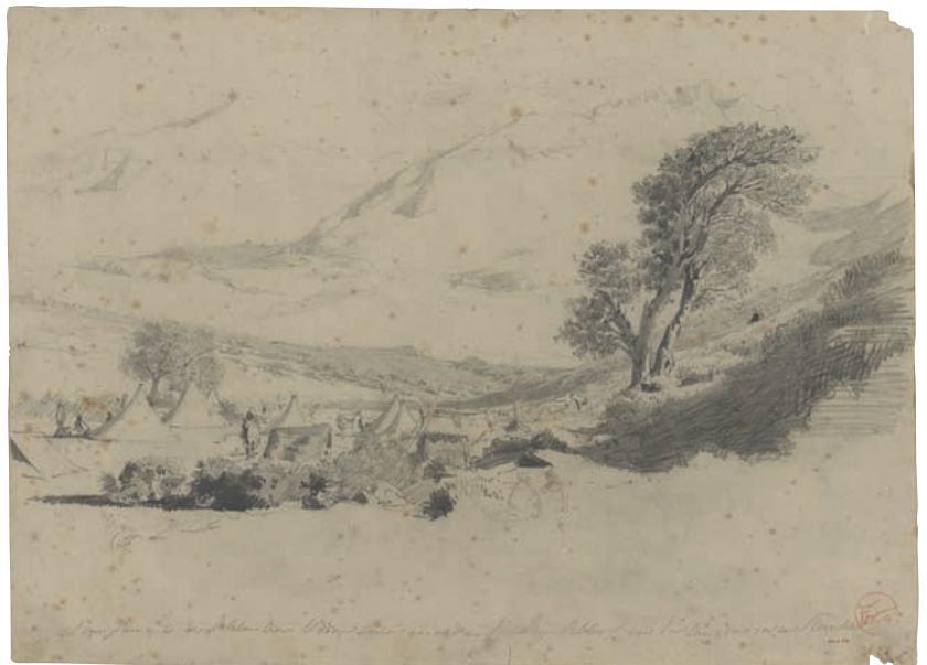
Marià Fortuny. Campamento de Aleber Alvi Udda en la cañada cerca de Samsa , 1860. Museu Nacional d'Art de Catalunya, Barcelona