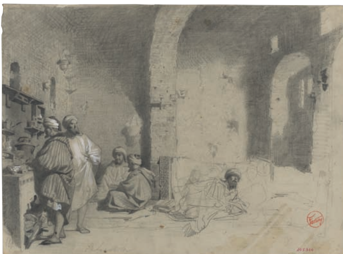
Marià Fortuny. Cafè marroquí , 1860. Museu Nacional d'Art de Catalunya

Després de ser adquirida per la Diputació de Barcelona als hereus de l'artista l'any 1875, La batalla de Tetuan abandonava la seva ubicació, al taller de Fortuny, a Roma, per iniciar un llarg viatge que va culminar, el 2004, amb la instal·lació de la pintura a les sales de la Col·lecció d'Art Modern del Museu Nacional d'Art de Catalunya. El relat d'aquesta aventura conforma un dels episodis més singulars de la història del patrimoni català. El recorregut inclou un gran nombre de vicissituds, adversitats, decisions arriscades, trasllats en condicions precàries, amb limitats recursos humans i econòmics, i restauracions fetes amb una alta dosi de voluntarisme. Tot aquest cúmul de peripècies, ocorregudes en el decurs de gairebé un segle i mig, dibuixa un itinerari molt ric en esdeveniments, però, tanmateix, indicatiu de l'absència, durant un llarg període, d'una política patrimonial capaç de valorar el mèrit atresorat per una de les realitzacions més emblemàtiques del pintor de Reus.