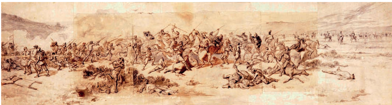
Marià Fortuny. Estudi per a La batalla de Wad-Ras, cap a 1860-1861. Institut Municipal de Museus de Reus

La batalla de Wad-Ras , succeïda el 23 de març de 1860, va ser el darrer i definitiu enfrontament de la contesa. Per aquesta raó, Fortuny li dedica diversos dibuixos i en feu un parell de versions a l'oli, que ben segur havien de ser preparatòries d'una pintura de dimensions més grans que no arribà a pintar. L'artista, que presencià la batalla, va escollir per representar-la el moment decisiu de la intervenció dels