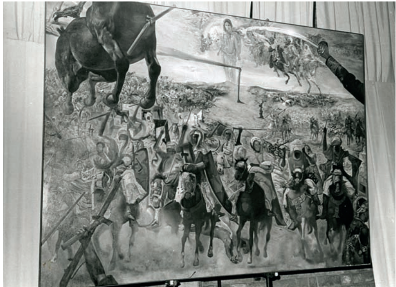
La batalla de Tetuan de Salvador Dalí a l'exposició Fortuny, Dalí y sus batallas de Tetuán, Saló del Tinell, Barcelona, 15 d'octubre de 1962.

L'any 1962, la vida barcelonina es va veure sacsejada per una proposta expositiva agosarada de Salvador Dalí (1904-1989). El geni empordanès va agitar l'esmoreït ambient cultural de la ciutat fent una versió lliure de La batalla de Tetuan de Fortuny. A més de les dues batalles, mostrades amb la intenció de suggerir un diàleg metafòric, l'exposició, celebrada al Saló del Tinell, va reunir altres realitzacions dels dos creadors i va assolir un gran èxit d'assistència de públic. Al llarg del mes que va romandre oberta, per l'espai expositiu van desfilars unes 40.000 persones. Amb aquesta iniciativa, Dalí va contribuir a la difusió internacional de l'obra de Fortuny, en considerar-lo un pintor de característiques canòniques. Actualment, després de ser venuda a Nova York l'any 1987, la pintura de Dalí es pot veure al Morohashi Museum of Modern Art de Fukushima (Japó).