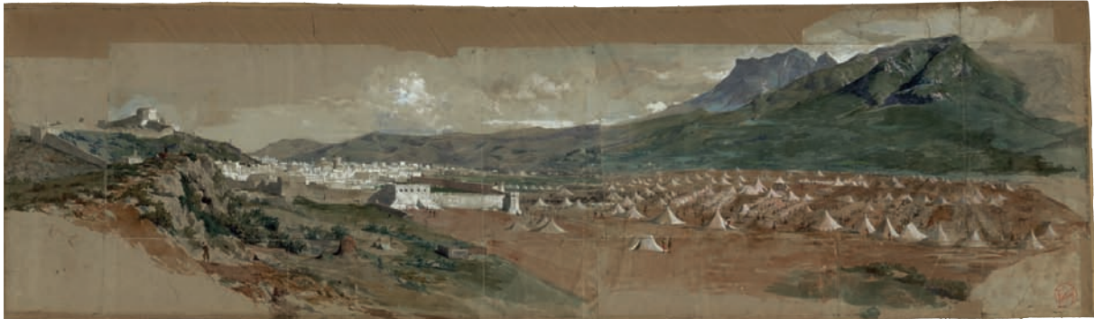
Marià Fortuny. Vista de Tetuan , 1860. Museu Nacional d'Art de Catalunya, Barcelona

En el moment de la seva creació (1863-1865), La batalla de Tetuan fou una pintura d'història gens fidel a les estructures i normes del gènere. Una obra singular i controvertida que, pel seu autor, es va convertir en un repte no assolit, en un desencís. Avui, el quadre està considerat com una de les produccions més emblemàtiques de Marià Fortuny (Reus, 1838 – Roma, 1874), i també és una de les obres més admirades de la col·lecció del Museu Nacional d'Art de Catalunya.