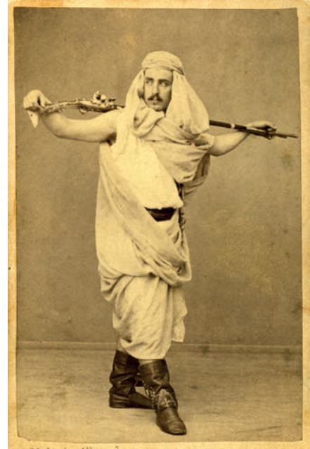
Moliné y Albareda. Marià Fortuny vestit de sarraí , cap a 1870. Institut Municipal de Museus de Reus

La batalla de Tetuan ocupa un lloc important en la memòria i en l'imaginari col·lectiu de moltes generacions de catalans. Envoltada d'un aura de veneració romàntica ha esdevingut una icona popular de la nostra cultura. La fascinació que ha exercit, i segueix exercint, des de la seva arribada a Barcelona l'any 1875, l'han convertit en una de les creacions artístiques més apreciades del nostre passat recent. En el seu moment fou una pintura d'història poc ortodoxa i controvertida, gens fidel a les estructures del gènere, cosa que la feia singular i extraordinària. Tot i això, és una obra sense finir, que provocà el desencís del seu autor en esdevenir un repte no assolit. Transcorreguts més de 150 anys d'ençà de la seva execució, el gran quadre ha sabut resistir el pas del temps i ningú no dubta a considerar-lo una de les grans creacions de la pintura del segle XIX. L'exposició vol retre homenatge a les persones que amb la seva iniciativa van fer possible que una obra nascuda en el fragor d'una trinxera, acabés enriquint el nostre patrimoni públic.