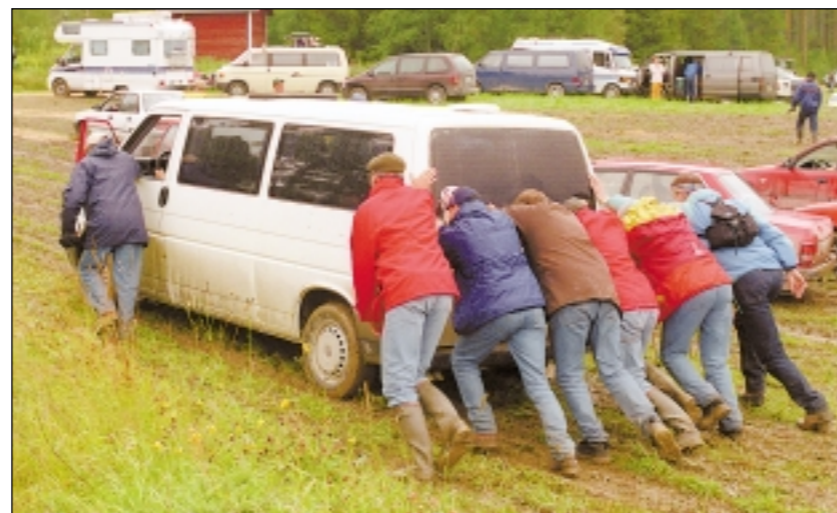
On ihmispaljoudesta aika usein hyötyäkin.

— Ralli vaikuttaa ihmisten kaasujalkaan kovasti. Ylinopeudet ovat yleensä todella reiluja, jopa 50 kilometriä tun-