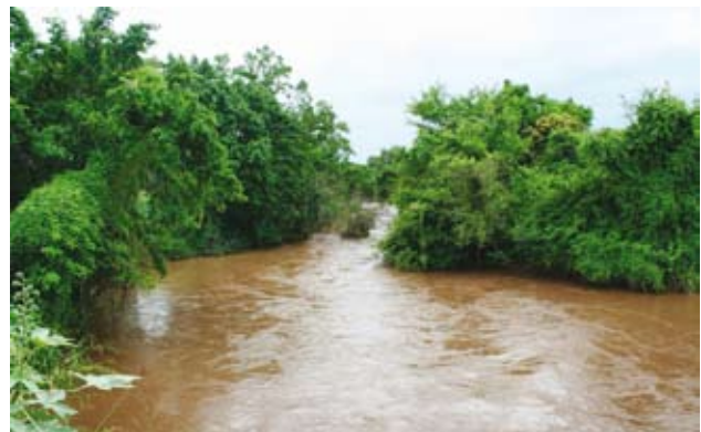
Ryc. 3. Rzeki są brązowe nie tylko po deszczach.

on 789 km na południe od Addis Abeby, 115 km na północ od Omorate przy granicy kenijskiej i 26 km na południowachód od Džinki (Jinki), gdzie mieści się bardzo skromna siedziba dyrekcji Parku. Po zmianach w 1979 r. jego granice obejmują 2162 km 2 i stykają się z jeszcze większym PN Omo (4068 km 2 ), zaś w sąsiedztwie, od wschodu rozciąga się Stephanie Wildlife Reserve, chroniący dziką zwierzynę. Za rzeką Tama, od zachodu po rzekę Omo (Gibe), funkcjonuje Tama Wildlife Reserve, zaś od południa – Murle Controlled Hunting Area oddzielona przez jezioro Dipa nad dolnym Omo, gdzie wprawdzie można polować, ale w ściśle nadzorowany sposób. W ten sposób na znacznej powierzchni przy południowej granicy Etiopii stworzono ochronną przestrzeń o dość jednolitym charakterze ekologicznym. PN Mago ma wyrównany w zasadzie kształt, wchłaniający niejako