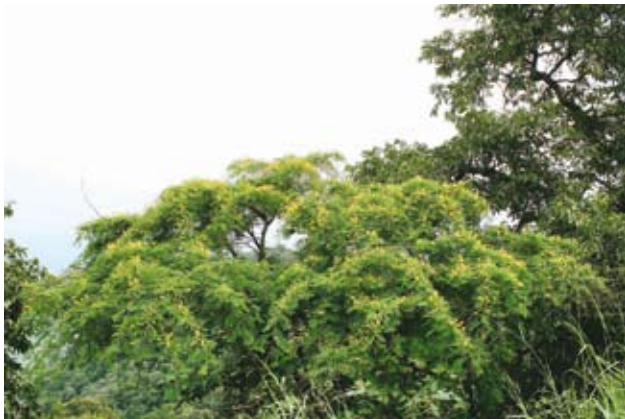
Ryc. 4. Akacja Farnesa.

pierwsza, obfitująca w opady, przypada na marzec i kwiecień, druga – nieco uboższa w nie, na październik i listopad) sięga średnio 800 mm. Nieco większe wartości notowane są w górach. W konsekwencji większość obszaru, w tym PN Mago, stanowią siedliska suche i półsuche, bogatsze w wodę jedynie w sąsiedztwie rzek. Te zaś praktycznie przez cały rok niosą wielkie masy brunatnej i czerwonej zawiesiny, pochodzącej z intensywnej denudacji laterytowych gleb, pozbawionych leśnej osłony. Warto zwrócić uwagę na rolę rzeki Omo, podobną do spełnianej przez Nil. Otóż po maksymalnych wezbraniach w sierpniu czy wrześniu rzeka ta wylewa na sąsiadujące poletka, pozostawiając na nich żyzny namuł. Ostatnie lata przynoszą wszelako poważne zakłócenia w tym naturalnym rytmie przyrody. Coraz częstsze, dłuższe i głębsze susze powodują bardzo nikły przybór wody w Omo, przez co grunty uprawne nie tylko nie są użyźniane, ale brakuje dla nich wody. Żyjące tu plemię Mursi ma coraz większe problemy z wyżywieniem się, okoliczna sawanna stopniowo zmienia się w półpustynię i pustynię, nie mogąc z kolei zapewnić utrzymania bydła. Coraz mniej wody jest także w jeziorze Turkana.