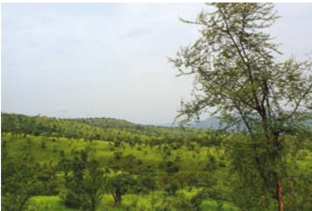
Ryc. 2. Typowy krajobraz wnętrza PN Mago.

kontynuujących starodawny tryb życia. O niektórych mówi się, że są jedne z ostatnich w Afryce, reprezentujących przedkolonialne formy społeczne. Ukośnie przecina Etiopię potężny rów tektoniczny, ciągnący się z głębi Afryki aż po Syrię, zwany Wielkim Riftem (jego część to Rów Abisyński). Ku Morzu Czerwonemu i Zatoce Edeńskiej rozszerza się on lekko w Kotlinę Danakijską, oddzieloną od mórz Górami Danakilskimi. Pomiędzy nią a granicą z Kenią powstało kilka wielkich jezior, przyciągających osadnictwo.