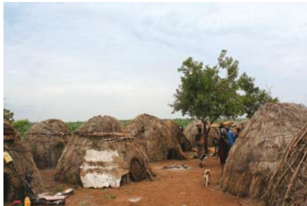
Ryc. 6. Wioska Mursi.

Stosownie do szerokości geograficznej i kontynentu przedstawia się skład miejscowej fauny. W Parku, zwłaszcza w jego południowo-zachodniej części żyją słonie (obecnie około 200 sztuk), choć ich populacja mocno zmalała wskutek zmian środowiska i polowań, w dużej mierze kłusowniczych. Podobnie jest z pogłowiem bawołów, których stada jeszcze nie tak dawno dochodziły do 1000 sztuk, a dziś szacowane są najwyżej na 400. Z innych większych ssaków, które też trudno spotkać, należy wymienić zebry i żyrafy – tych drugich obserwuje się dwa podgatunki: bardziej na zachód żyje tzw. żyrafa właściwa ( Giraffa camelopardalis camelopardalis ), bardziej zaś na południe – żyrafa siatkowana ( Giraffa camelopardalis reticulata ). Przy okazji warto wspomnieć o drugiej części nazwy gatunkowej, która powstała z połączenia słów camelus (wielbłąd) i panthera (lampart). Swojego czasu uważano bowiem na serio, że żyrafa