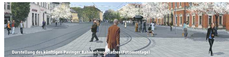
Darstellung des künftigen Pasinger Bahnhofsvorplatzes (Fotomontage)

Im Sommer 2013 wird es im Zuge des Baufortschritts weitere Änderungen bei den Buslinien im Bereich Pasing Bahnhof geben. Wir werden Sie wieder rechtzeitig informieren.