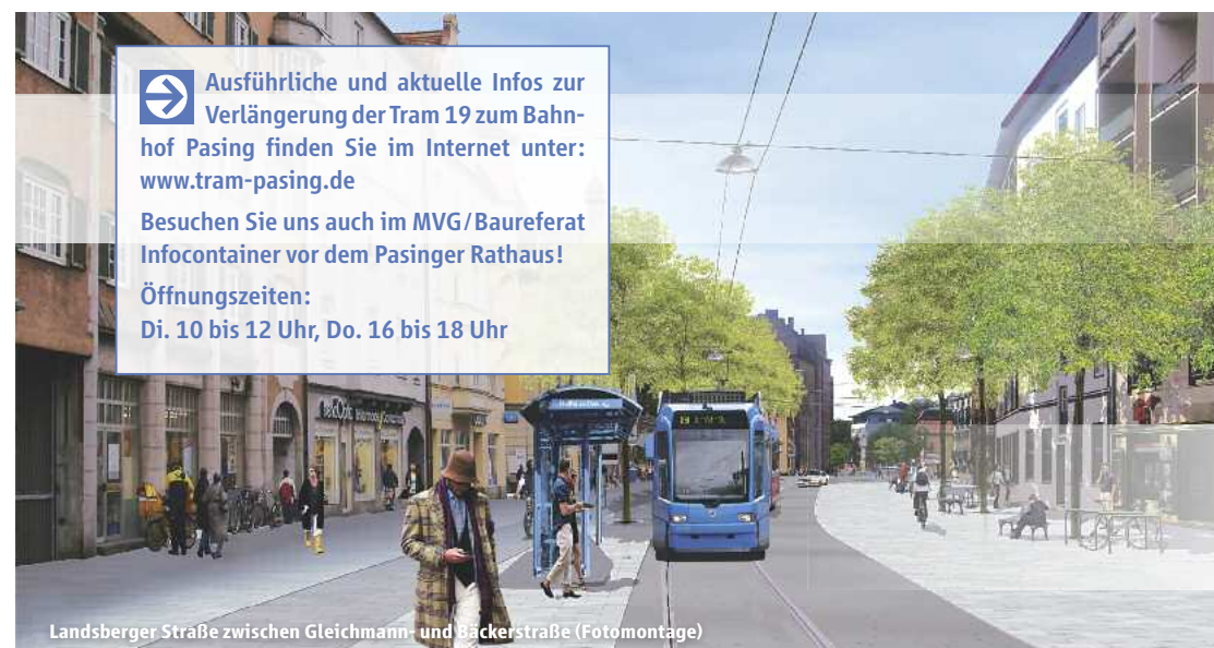
Landsberger Straße zwischen Gleichmann- und Bäckerstraße (Fotomontage)

Ausführliche und aktuelle Infos zur Verlängerung der Tram 19 zum Bahnhof Pasing finden Sie im Internet unter: www.tram-pasing.de