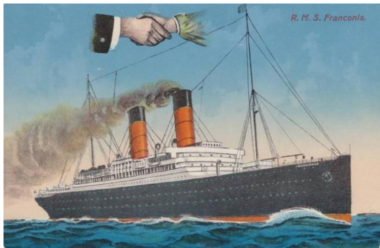
RMS Franconia Tarjeta postal de época