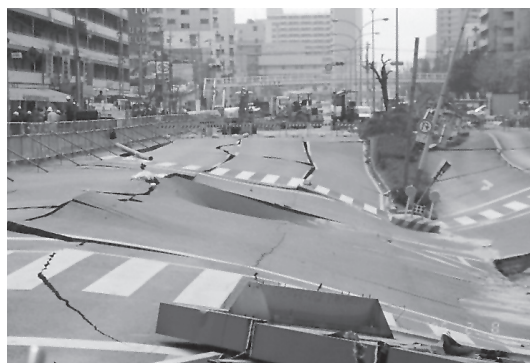
写真14 地下鉄大開駅崩壊による道路の沈下(1995年兵庫県南部地震)

い。写真15は、1997年イラン・ガエン地震の断層の横ずれにより、道路が数メートル横にずれている様子を示している。ずれの成分であるstrikeとdipの組合せ如何によっては構造被害のモードも異なってくる。また、同じdip成分でも例えば正断層タイプの断層面を貫通する埋設管の被害は引張型の被害であり、逆断層タイプの被害は圧縮型となる場合が多い。