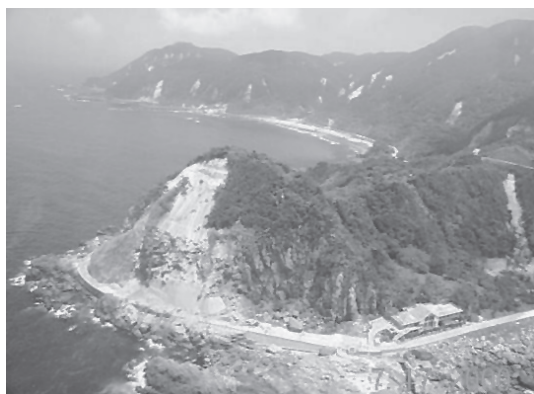
写真5 かけ崩れによる神津島周回道路の被害（2000年神津島近海地震）

活断層は事前には指摘されておらず（理科年表，2003），地方の中都市である米子，境港市を中心に被害が広がった。鳥取県における断水被害総数は最終的に5,744戸であり，近隣県を合わせると6,801戸に断水が生じた（写真6）。下水道の被害としては，主に管渠の破損とマンホールの隆起などの10数件が報告されている。ガス漏れは43件発生したが，ほとんどが灯内管であり，本支管の被害は数箇所程度であった。電力については，地震直後に停電したがすぐに復旧した。鳥取，岡山，鳥根など合わせて17,403戸が被害を受けた。電話については，溝口町内の一部不通を含め，