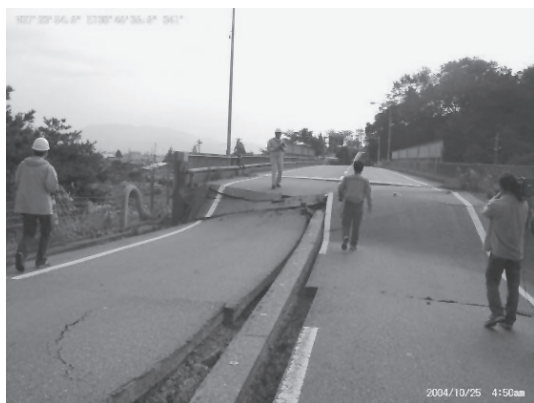
写真13 橋梁取り付け部の地盤の沈下(2004年新潟県中越地震)