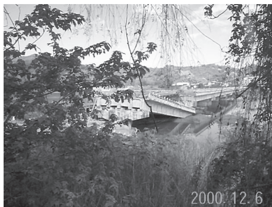
写真16 断層変位による道路橋の落橋(1999年台湾集集地震)