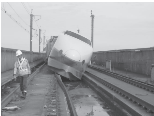
写真7 脱線した上越新幹線(2004年新潟県中越地震)

2007年(平成19年)の新潟県中越沖地震(M6.8)では, 新潟県で死者15人, 重軽傷者2,315人, 建物全壊1,319棟, 大規模半壊857棟, 半壊4,764棟, 一部損壊34,659の被害が生じ(新潟県, 2007[2]), また原子力発電所周辺施設の被害も発生した. 特にガス・上下水道管路には, 液状化による側方流動や斜面・法面被害による地盤変状(写真9), 砂地盤や緩斜面, 異地質境界面などに多くの被害が発生した. 上水道は, 送水管や大口径管路に多くの被害が見られ, 柏崎の配水管路被害率は0.65件/kmにのぼった. 柏崎市ガス水道局の供給エリアではガスの供給が停止された. 復旧対象戸数約3万戸のうち復旧に時間を要する約3千戸を除いた需要家への供給は約1ヵ月後に完了したが, 復旧工事は液状化や水道管被害によるガス管への浸入水(写真10)により困難を極めた. 電力製造としての原子力施設では, 原子炉主要部分以外の構造部分への耐震化への配慮や, 沈下や流動などの地盤変状への対応などが課題となった(土