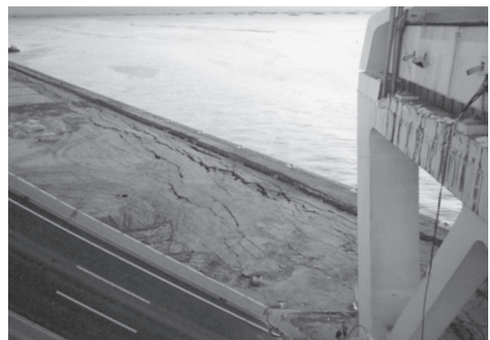
写真11 液状化による埋立地の側方流動(1995年兵庫県南部地震)