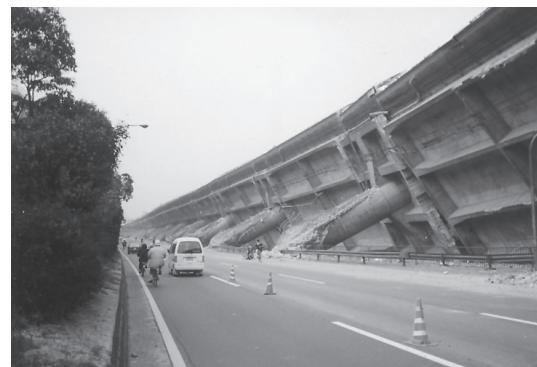
写真4 阪神高速高架橋の倒壊（1995年兵庫県南部地震）