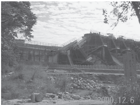
写真17 断層変位によるダムの破壊 (1999年台湾集集地震)

都市の社会基盤としてのライフラインは、我々の生活に欠くことのできない飲料水の供給やエネルギー供給、人