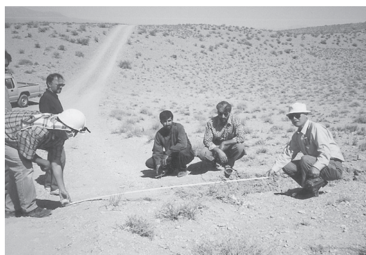
写真15 断層変位による道路の横ずれ(1997年イラン・ガエン地震)