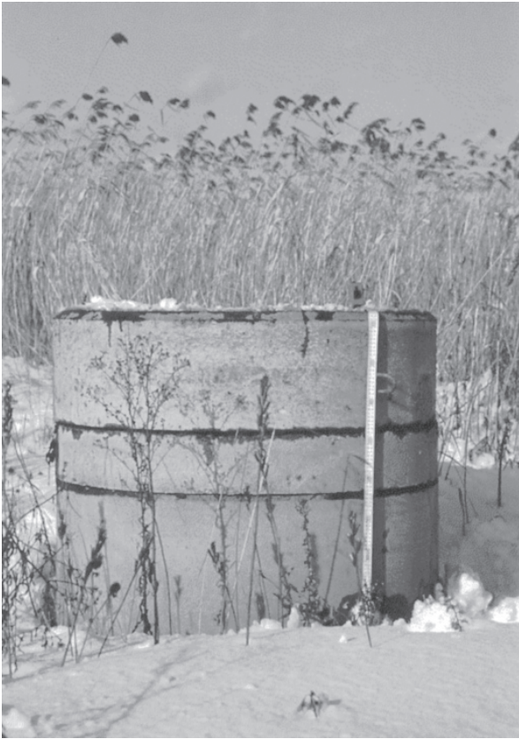
写真1 マンホールの浮き上がり（1993年釧路沖地震）