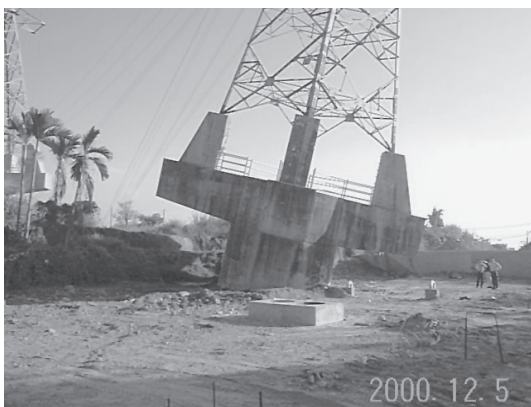
写真18 断層変位による送電線鉄塔の傾斜 (1999年台湾集集地震)

員・物資輸送、雨水・汚水処理、情報伝達やコミュニケーションの役割を担っており、また、それぞれの系が多重化、階層化している場合が多く、かつ相互依存性も大きいため、一度被害を受けるとその社会的な影響は計り知れない。そのため、3. で述べた有事の際の物理被害や機能被害を最小限に抑えるべく、ライフライン施設の耐震化を図ったり、ネットワークに冗長性を付加したりして、ハード的な事前対策を推進するとともに、それでも防げないリスクに対しては、事前に保険などによってリスク移転を行った。事後における物理・機能両面の迅速な応急復旧対応、波及被害の防止のための対策を講じなければならない。そこには、地震シナリオの策定、物理被害や機能被害の推定、波及被害の推定、耐震補強や復旧順序の優先順位付け、費用対効果などを勘案した地震リスクマネジメントの導入が必須となる。