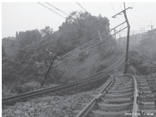
写真12 斜面崩壊で流された上越線の軌道(2004年新潟県中越地震)