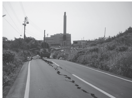
写真9 水道管が敷設されている道路の被害(2007年新潟県中越沖地震)