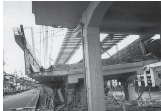
写真3 山陽新幹線高架橋の落橋（1995年兵庫県南部地震）

が終了している。下水道施設は、家庭排水設備から処理場・ポンプ場、管渠に至るまで大きな被害を被った。神戸の東灘処理場では処理機能が完全に停止（4ヵ月後に機能回復）し、神戸市内の下水管渠施設（汚水・雨水）の敷設延長の2%弱が被災した。電力は、地震直後には送電設備・配電設備の被害により関西電力管内の需要の1/4に当たる約260万戸が停電したが、約一週間後には応急送電により停電はほぼ解消した。家屋倒壊や火災による電柱や引込み線被害も多数発生した（写真2）。ガスは、大阪ガス管内で約86万戸の供給が停止したが、3ヵ月後までにはほぼ供給を再開した。通信施設は、一部の設備被害とともに約30万回線が一時的に不通となる被害を受けた。これ以降、全国利用型伝言ダイヤルが開発され、また衛星利用が拡大されている。鉄道においては、列車の脱線、高架橋の損壊、軌道変状、盛土の崩壊のみならず、停車場設備や電気設備、そして車両基地に至るまで大きな被害を受けた。山陽新幹線で8箇所、在来線および新交通システムで24箇所の計32箇所て橋梁の落橋（写真3）が発生している。道路では、阪神地区の大動脈である国道や高速道路が落橋等で寸断（写真3、写真4）されるとともに、家屋の倒壊で生活道路が機能しない状態になるなど、消火・避難・救援・復旧・生活物資輸送などあらゆる面に多大な負の影響を与え