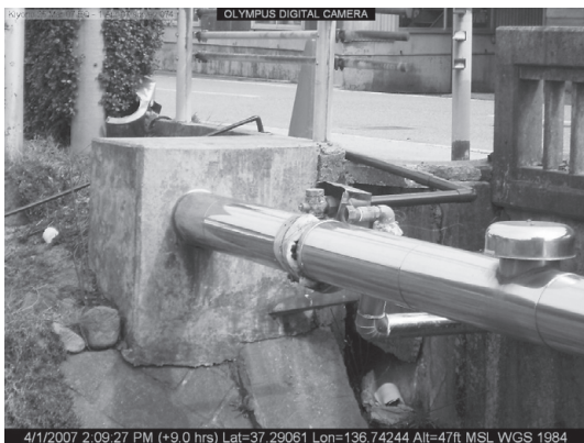
写真8 水管橋の破損(2000年能登半島地震)