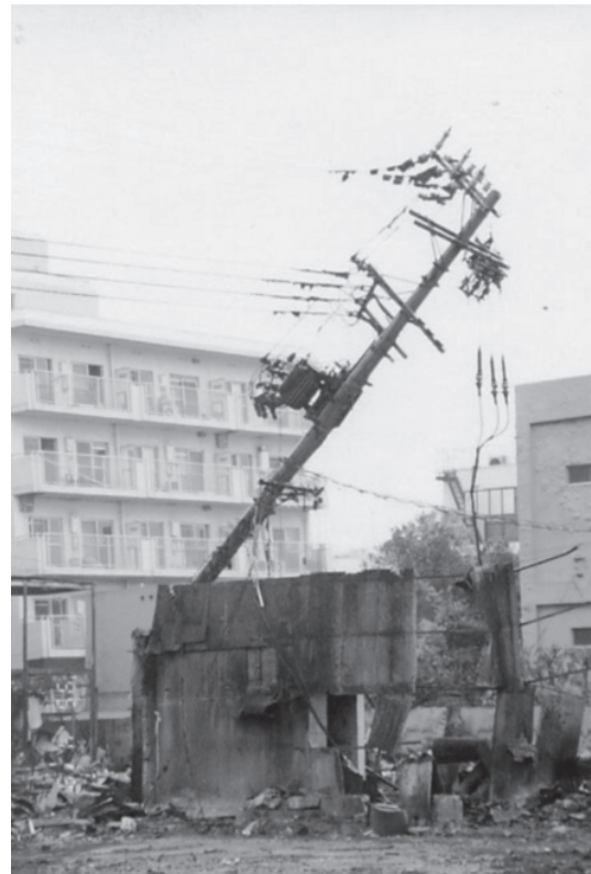
写真2 震動・火災などによる電柱の損壊（1995年兵庫県南部地震）

が終了している。下水道施設は、家庭排水設備から処理場・ポンプ場、管渠に至るまで大きな被害を被った。神戸の東灘処理場では処理機能が完全に停止（4ヵ月後に機能回復）し、神戸市内の下水管渠施設（汚水・雨水）の敷設延長の2%弱が被災した。電力は、地震直後には送電設備・配電設備の被害により関西電力管内の需要の1/4に当たる約260万戸が停電したが、約一週間後には応急送電により停電はほぼ解消した。家屋倒壊や火災による電柱や引込み線被害も多数発生した（写真2）。ガスは、大阪ガス管内で約86万戸の供給が停止したが、3ヵ月後までにはほぼ供給を再開した。通信施設は、一部の設備被害とともに約30万回線が一時的に不通となる被害を受けた。これ以降、全国利用型伝言ダイヤルが開発され、また衛星利用が拡大されている。鉄道においては、列車の脱線、高架橋の損壊、軌道変状、盛土の崩壊のみならず、停車場設備や電気設備、そして車両基地に至るまで大きな被害を受けた。山陽新幹線で8箇所、在来線および新交通システムで24箇所の計32箇所て橋梁の落橋（写真3）が発生している。道路では、阪神地区の大動脈である国道や高速道路が落橋等で寸断（写真3、写真4）されるとともに、家屋の倒壊で生活道路が機能しない状態になるなど、消火・避難・救援・復旧・生活物資輸送などあらゆる面に多大な負の影響を与え