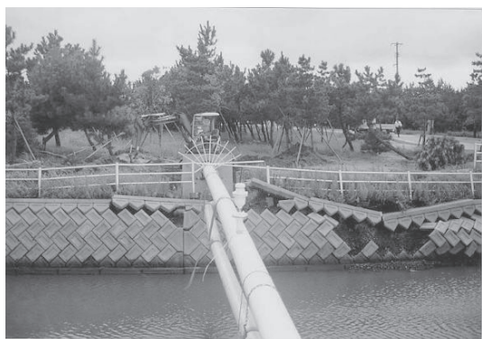
写真6 承水路に架かる水管橋の被害状況（2000年鳥取県西部地震）

鳥取県内で134回線が被害を受けた。また，安否を確認する電話が殺到して輻輳したが，災害用伝言ダイヤルを設けるなどして対応した。運用開始後30分で約3,200件の利用があるなど，これまでの災害で最高の利用数を記録した。道路橋については構造物そのものの被害は少なく，ほとんどが橋台付近での地盤の変状による段差の発生であった。山間部では地震動による土砂災害，法面崩壊，落石等の影響による被害が見られた（Kiyono et al., 2007）。