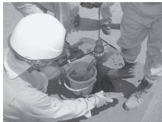
写真10 ガス管の水抜き作業(2007年新潟県中越沖地震)