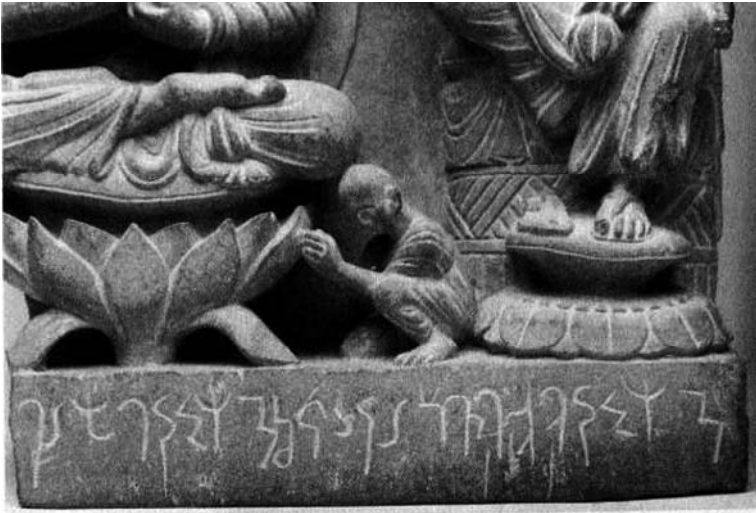
圖二：Detail of the inscription on the relief. JIABS . Vol.25, No.1-2, p.7 (由右向左讀：□ahadirma asartimahdub ehkumanad erapṣiolo asartimahd□)