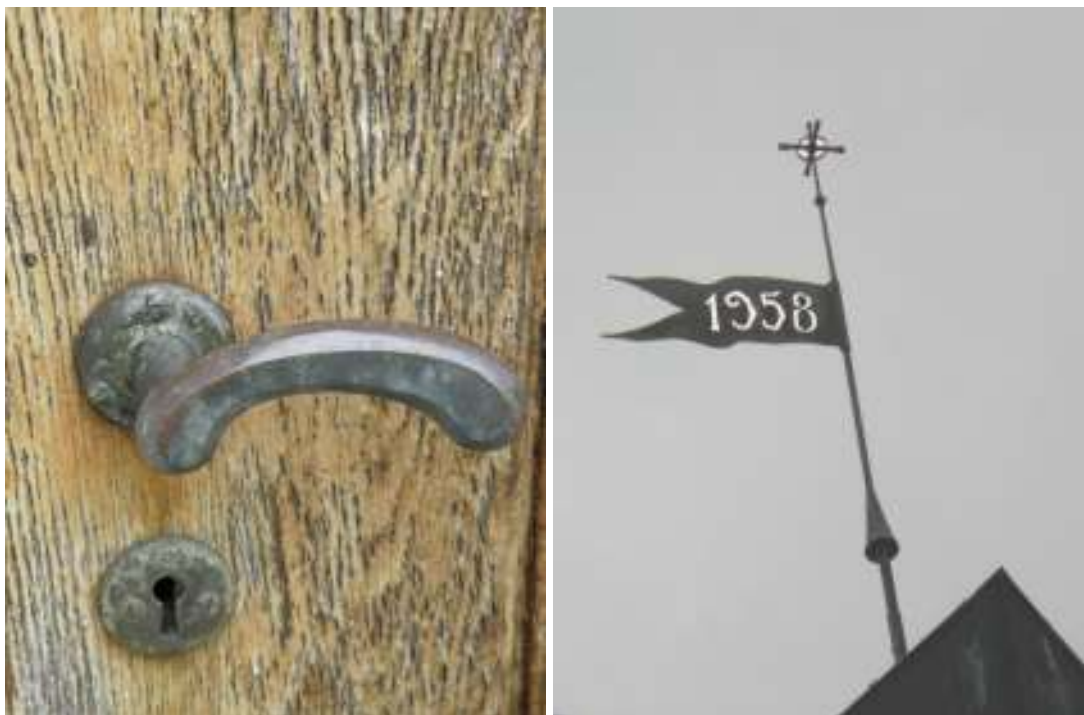
Samtliga ytterdörrar har en omfattande skadebild i form av bland annat flagnad lack och svartnat trä. Tryckena, i original från 1958, är unika för Källs Nöbbelövs kyrka och är ritade av Graebe. Samtliga ytterdörrar utom tornet och huvudentrén har likadana trycken. Ovan ses trycke till kapprummet. T h syns den smidda vimpeln med uppförandeåret.

Vid besiktning av kyrkan i samband med startmöte inför aktuell renovering befinns samtliga fönsterbågar- och karmar, tornluckor samt ytterdörrar i mycket dåligt skick. Kontakt togs med länsstyrelsen och beslut togs om en renovering av fönster och ytterdörrar, enligt lika befintligt. Endast lättare slipning ingick.