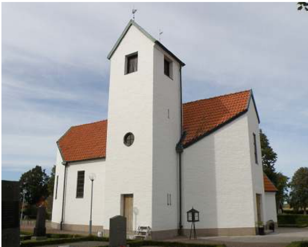
Den nyslammade kyrkan från sydost. Tornet nås via ingång i söder, medan kyrkans huvudentré är belägen i öster.