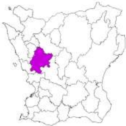
Skånekartan med Svalövs kommun markerad.