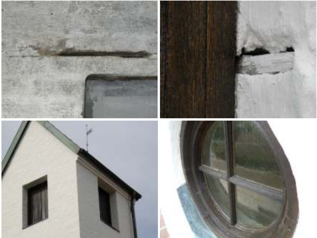
Övre raden, t v: Rostigt armeringsjärn ovan långhusets sydvästra fönster, t h: Synliga träkilar i anslutning till fönstersmygar. Undre raden, t v: Nyslammad torn med nymålade tornluckor.. Notera den tunna slamningen. T h: Nyrenoverat tornfönster i söder. Underliggande brun lackfärg satt hårt i tjocka lager och bör släpas ner helt vid en framtida fönsterrenovering.