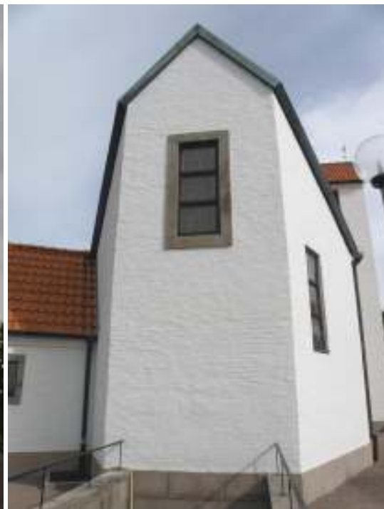
Kyrkan från sydväst, före och efter fasadrenovering. I förgrunden syns koret, beläget i väster, samt källarnedgången.