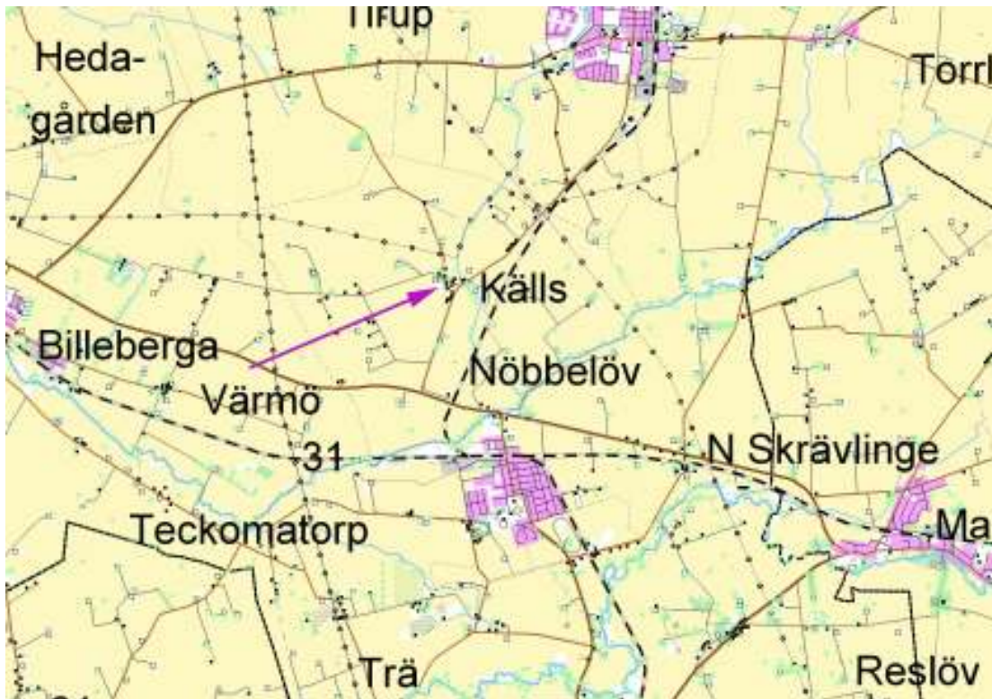
Delar av Källs Nöbbelövs socken med kyrkan utmärkt på kartan.