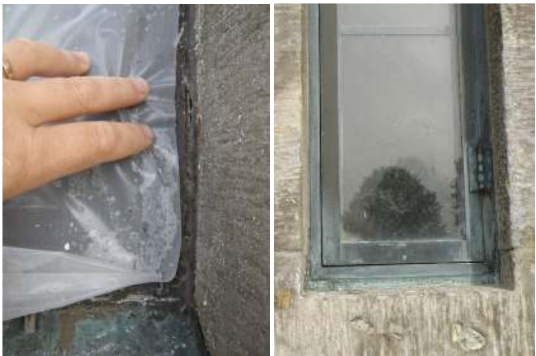
Sakerstians fönster mot väst. Gammal silikon och latexmassa kring fönster och använd som fogmassa avlägsnades.