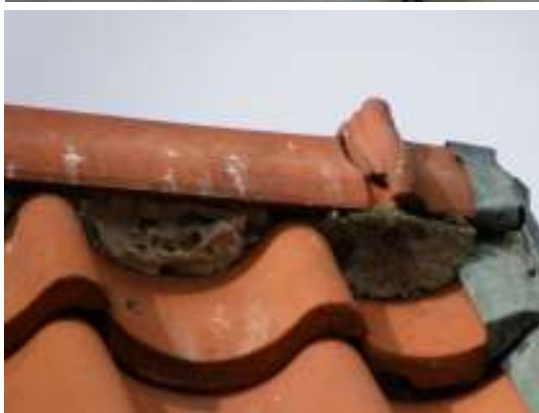
Övre raden: Partiellt lackade vinkelrännor i koppar. Notera tegelpannornas huggna kanter. Undre raden: Saknadnockpanna ersatt med ny. Kopparplåten åter fäst på plats.