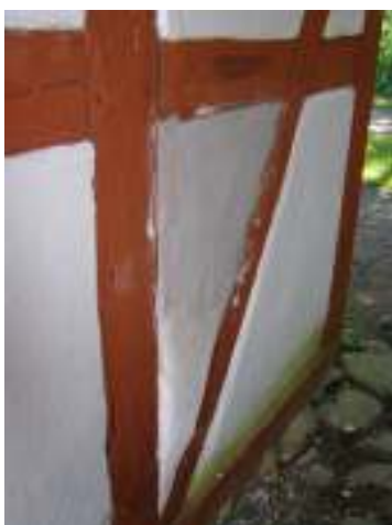
Pågående lagning av skadat fack på boningshusets södra vägg. Kalkning återstår.

Ett av facken på den södra längans östra gavel har målats med kalkfärg. Facket var missfärgat och hade en rosaröd ton varför befintlig färg tvättades ned och ny kalkfärg ströks på.