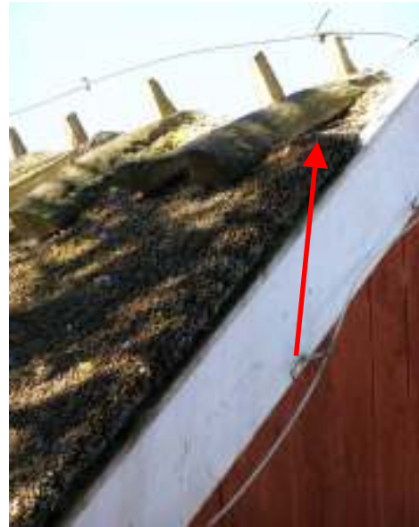
Pilarna visar hål i ryggingen vid södra respektive norra gaveln på östra längan. Nedan syns samma länga före respektive efter omrygging.