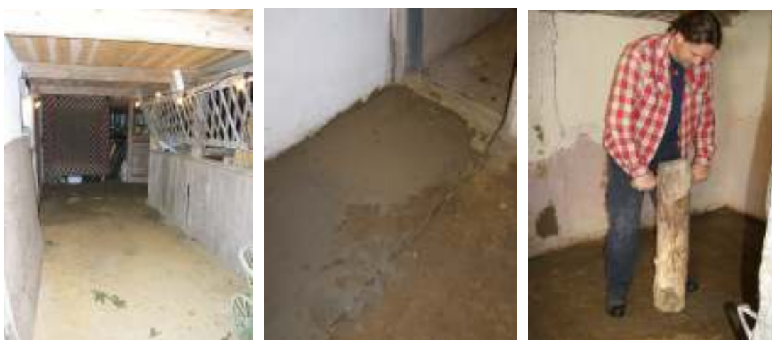
Första bilden visar golvet i stallet innan arbetena har börjat. På de följande två fotografierna har lera lagts ut och bearbetning för att få en jämn yta har påbörjats. Slutresultatet kan ses längre bak i rapporten under Bildbilaga.

Vid lagning av golven har gul lera som magrats med sand använts. Leran har lagts ut i håligheter och stampats samman till en jämns yta med ett träverktyg som syns på bilden nedan till höger. Avslutningsvis har golven strukits med en tunn lervälling.