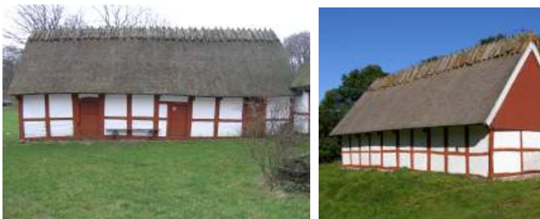
Bilderna visar södra längan före respektive efter omläggning av ryggningen.

Inför arbetenas igångsättande presenterades förslaget att återgå till torv som ryggningsmaterial för hembygdsföreningen men deras önskan var att fortsätta med råghalm och ryggaträn. Södra längan har således ryggats med löspressad råghalm som hålls på plats med ryggaträn. Samtliga ryggaträn var i gott skick och har kunnat återanvändas. De är sammanfogade med kätting.