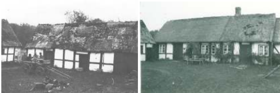
Bilderna är tagna 1945 och visar södra längan respektive boningsbuset.

Det finns en bra dokumentation av hur gården såg ut innan 1950-talets renovering där bland annat takens utseende beskrivs. Av detta material framgår att den östra längan var ryggad med halm utan ryggaträn medan övriga var ryggade med grästorv. Bilder tagna på gården vid mitten av 1940-talet visar också ryggningar utan ryggaträn. Mot bakgrund av att befintlig teknik med ryggaträn härstammar från renoveringen på 1950-talet samt att det finns en god dokumentation av vilka material som använts innan dess gavs genom länsstyrelsens beslut möjlighet att återuppta bruket av den äldre ryggningstekniken med grästorv.