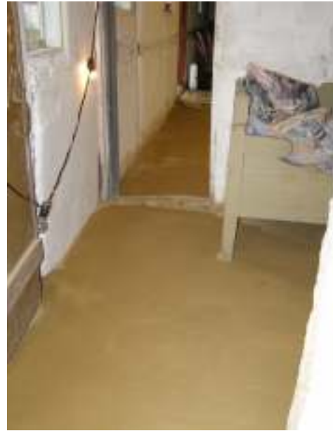
Stallet respektive drängkammarens golv sedan ny lera anbringats.