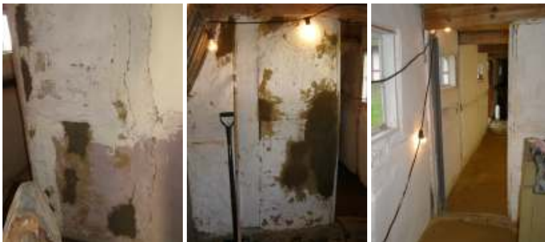
Interiörbilder från östra längan som visar lagningar på vägg i drängkammare och stall samt en vy genom drängkammaren ut i stallet efter färdigställt arbete.