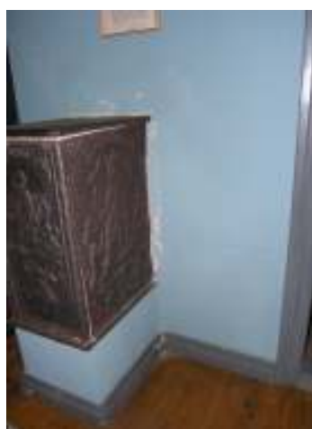
Vägg inne i stugan före och efter putsning av skadan. Målningsarbetet återstår.