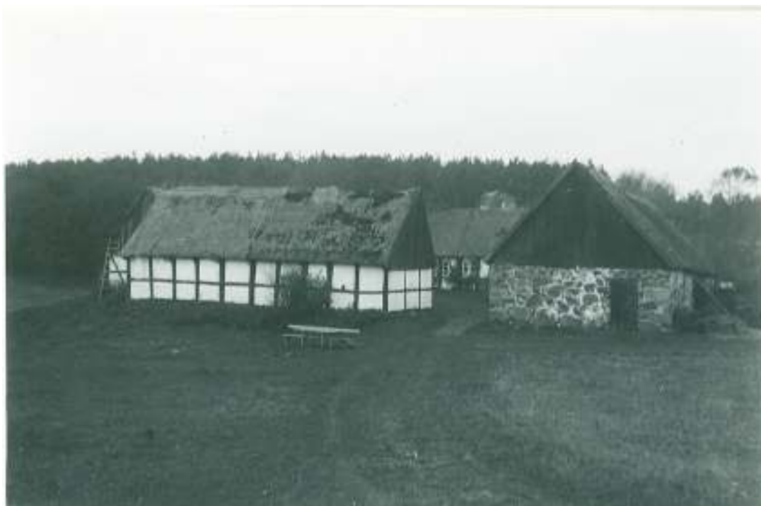
Foto är taget 1945 och visar Himmelstorp sett från söder. Notera ryggningen på södra längan.