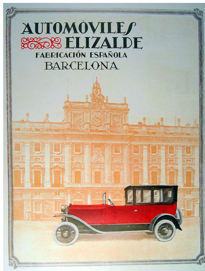
Cartell il·lustratiu dels negocis de la família Elizalde