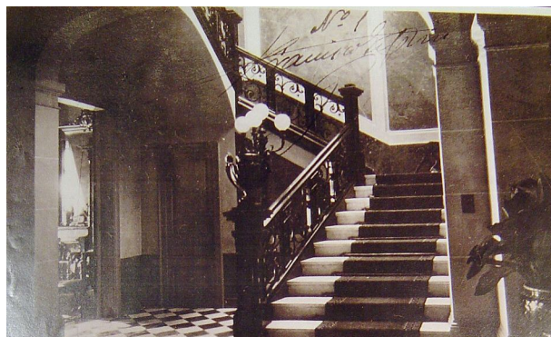
Saló a la planta noble i escala que l'uneix amb el primer pis. 1925.