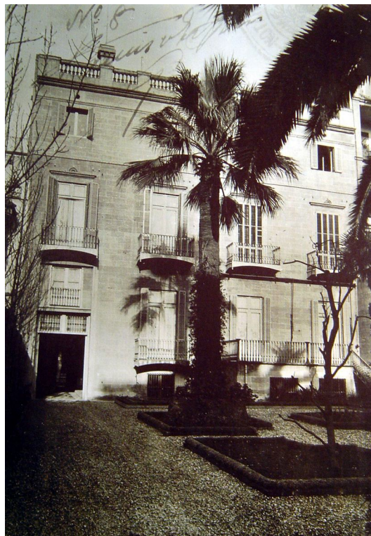
Façanes davantera i posterior de la Casa Elizalde en unes fotografies de 1925

A l'interior trobarem també tots els elements que caracteritzen aquest tipus de construccions típiques de l'Eixample: el pati central, una gran escala que uneix la planta noble amb el primer pis i l'interior d'illa.