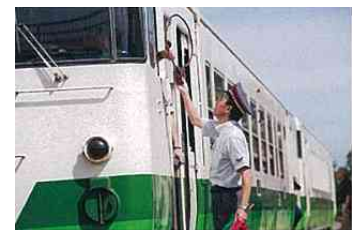
タブレット受渡し（イメージ）