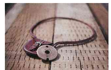
タブレット（イメージ）