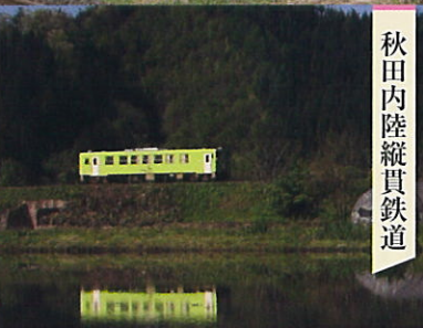
秋田内陸縦貫鉄道