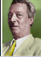
د/محمد مرسي احمد ١٩٧٢/١/١٧ : ١٩٧١/٥/١٤