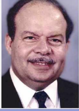
د/احمد فتحى سرور ١٩٩٠/١٢/١٢ : ١٩٨٤/١١/١١