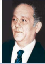
د/شمس الوكيل ١٩٧٣/٣/٢٤ : ١٩٧٢/١/١٨