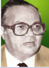
د/كامل ليله ١٩٧٤/٤/٢٥ : ١٩٧٣/٣/٢٧