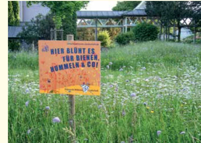
Abbildung 39: Blühende „Grünfläche“ um eine Schule in Wangen mit Informationstafel

zielführend für die Umsetzung tragfähiger Konzepte. Die Akzeptanz der Maßnahmen durch die Bewirtschafter, die letztendlich für deren Umsetzung und dauerhafte Erhaltung verantwortlich sind, steht hier im Vordergrund. www.foeko.de