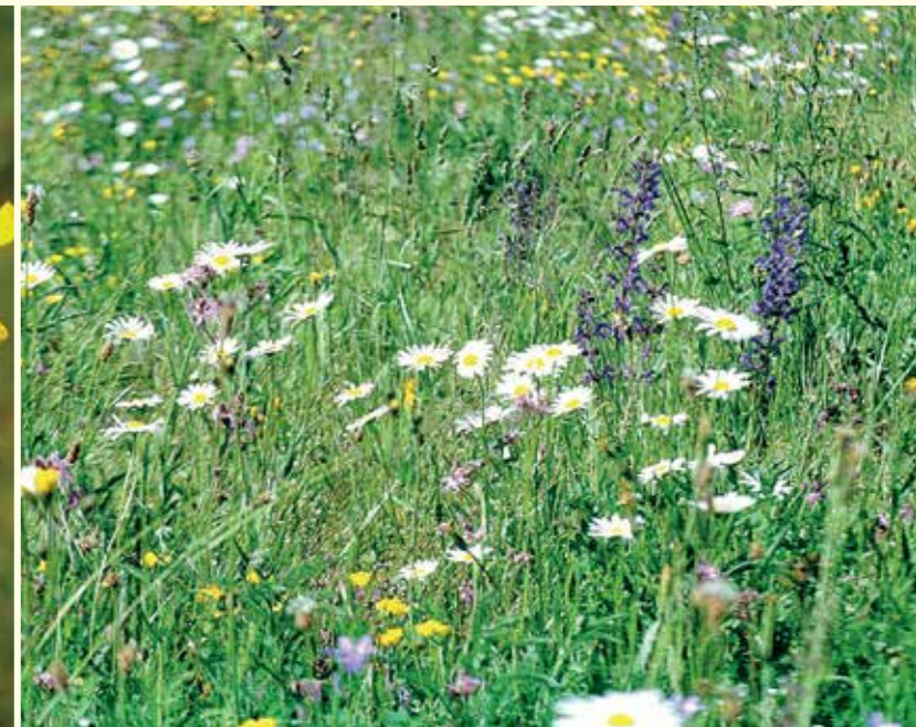
Abbildung 29: Durch die Beweidung von Streuobstwiesen können relativ blütenreiche Bestände erhalten werden.