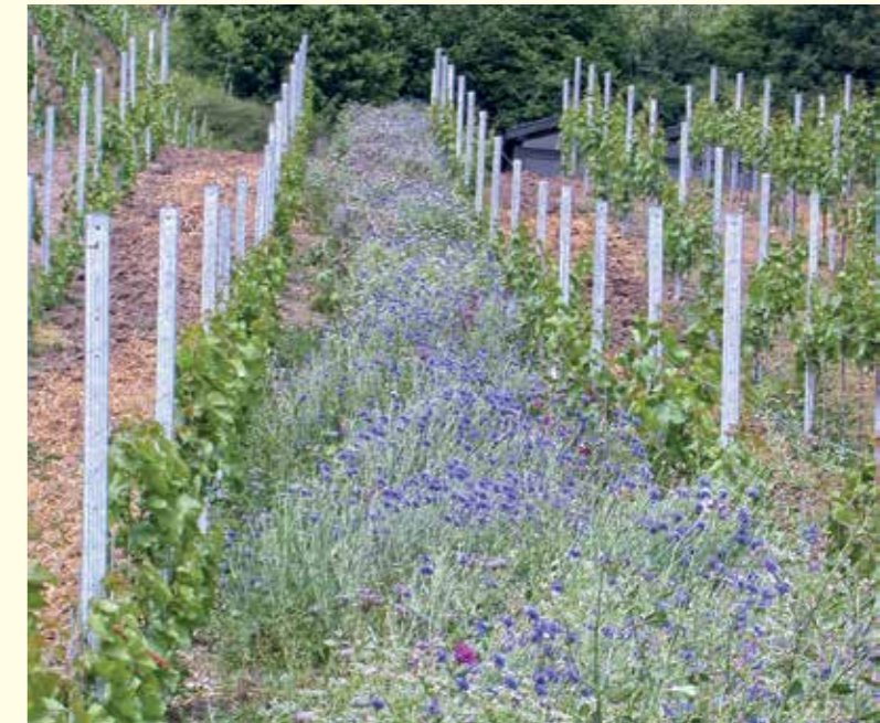
Abbildung 16: Artenreiche Blümmischung im Weinberg

Vor diesem Hintergrund ist das Belassen bereits bestehenden extensiven Grünlands die beste und kostengünstigste Methode.