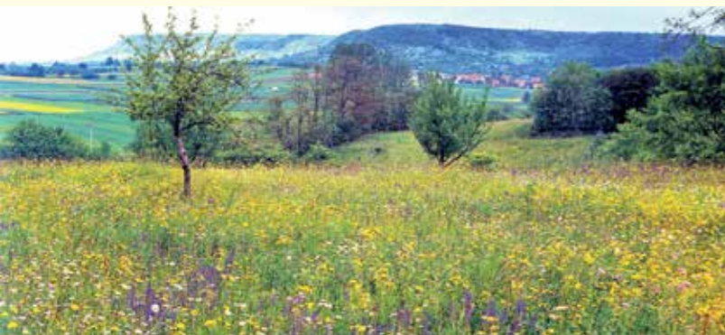
Abbildung 35: Ein Ackerrandstreifen auf der Gemarkung Heilbronn. Bunt blühende heimische Wildkräuterbestände stellen die Nahrungsgrundlage für zahlreiche Bienenarten (hier 29 Arten) dar.