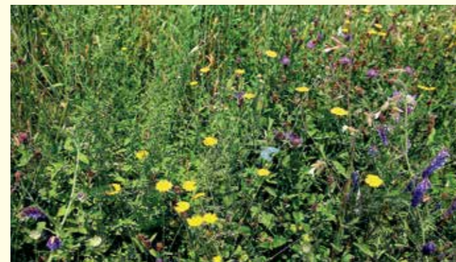
Abbildung 13: Färber-Kamille (Anthemis tinctoria), Vogel-Wicke (Vicia cracca) und Flockenblume (Centaurea jacea) am Rand eines Getreideackers.

Acker-Randstreifen bzw. von Acker-Lichtstreifen ohne größeren zusätzlichen Aufwand zu bewerkstelligen (siehe auch http://baden-wuerttemberg.nabu.de/themen/landwirtschaft/kultur-natur/ ). Der Bewirtschafter muss jedoch darauf achten, dass in Systemen von Kulturpflanzen mit eingesäten Insektentrachtpflanzen während deren Blühphase keine bienengefährlichen Pflanzenschutzmittel auf die Streifen verdriftet werden. Abbildung 13 zeigt einen blühenden Ackerrandstreifen auf einem ökologisch wirtschaftenden Betrieb. Im Übrigen sind Spritz- und Bodenbearbeitungsmaßnahmen an Ackersäumen zum Weg hin zu unterlassen. Auch diese Bereiche stellen Rückzugsräume für Flora und Fauna dar.