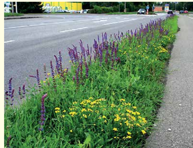
Abbildung 23: Eine einfache blühende Ansaat aus zwei Pflanzenarten, hier Salbei und Hornklee, sorgt für ausdauerndes Blütenflor mit geringem Pflegeaufwand an einem Straßenrand in Mössingen.

munen stellen sollten, sind „Warum mäht man so oft?“ und „Ist dies zwingend überall nötig?“. Oftmals reichen diese Fragen aus, um einen Denkanstoß und neue Planungsprozesse auszulösen. Ziel dieses Neudenkens ist es, insektenfreundlichere Pflegeregime Stück für Stück im Flächenmanagement der Kommune zu verankern. Große/radikale Veränderungen sind auch möglich, bedürfen jedoch längerer Vorbereitung mit breiter öffentlicher Diskussion und enger Einbeziehung der Entscheidungsträger sowie der Mitarbeiter und Bürger.