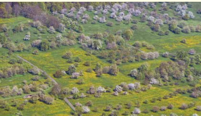
Abbildung 27: Die Kulturlandschaft Streuobst bietet Lebensraum für Insekten, Kleinsäuger sowie Sing- und Greifvögel.