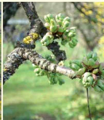
Abbildung 28: Durch geschickte Sorten- und Artenwahl kann sich die Blüte von Streuobstbeständen über nahezu zwei Monate erstrecken.