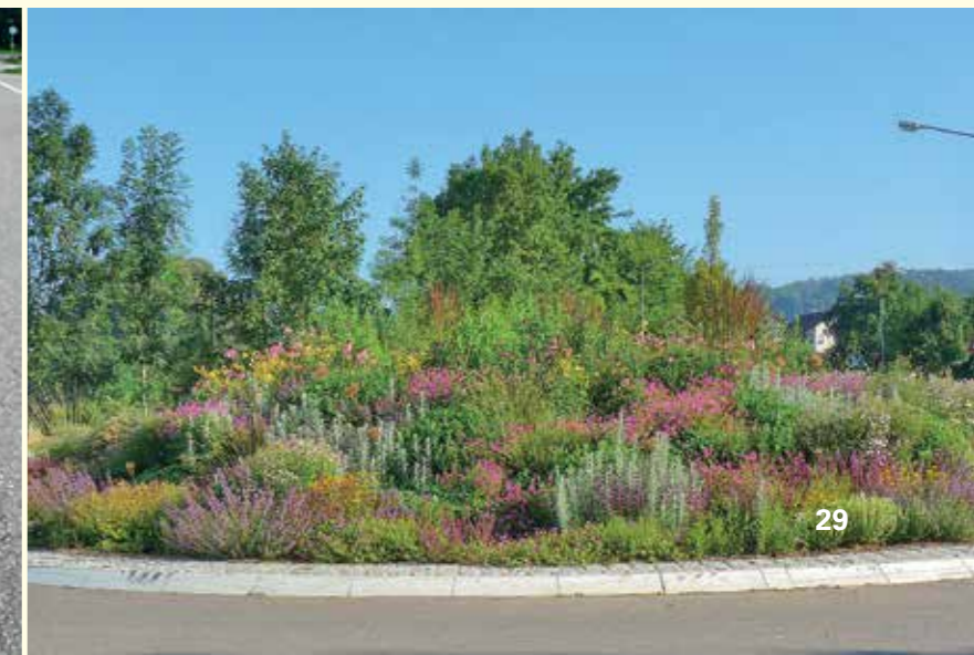
Abbildung 24: Staudenpflanzung in Donzdorf

Solche Veränderungen des Pflegeregimes erfordern in vielen Kommunen strukturelle Anpassungen mit langfristigen Umsetzungsperspektiven. Auch müssen diese Veränderungen keine völlige Abkehr von der herkömmlichen Arbeitsweise, etwa von saisonalen Schmuckbeeten bedeuten, denn viele Bürger werden dies weiterhin fordern. Ebenso gilt, dass naturnahe insektenfreundliche Pflanzungen und Pflegekonzepte nicht überall die beste und effizienteste Lösung darstellen. Doch gibt es in jeder Kommune Potentiale für ein ökologisches Umdenken im Grünflächenmanagement. Ausdauerndes Erklären und Werben für die ökologische Neuausrichtung der Pflege bei Mitarbeitern und in der Öffentlichkeit ist deshalb eine Grundlage für den langfristigen Erfolg.