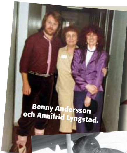
Benny Andersson och Annifrid Lyngstad.