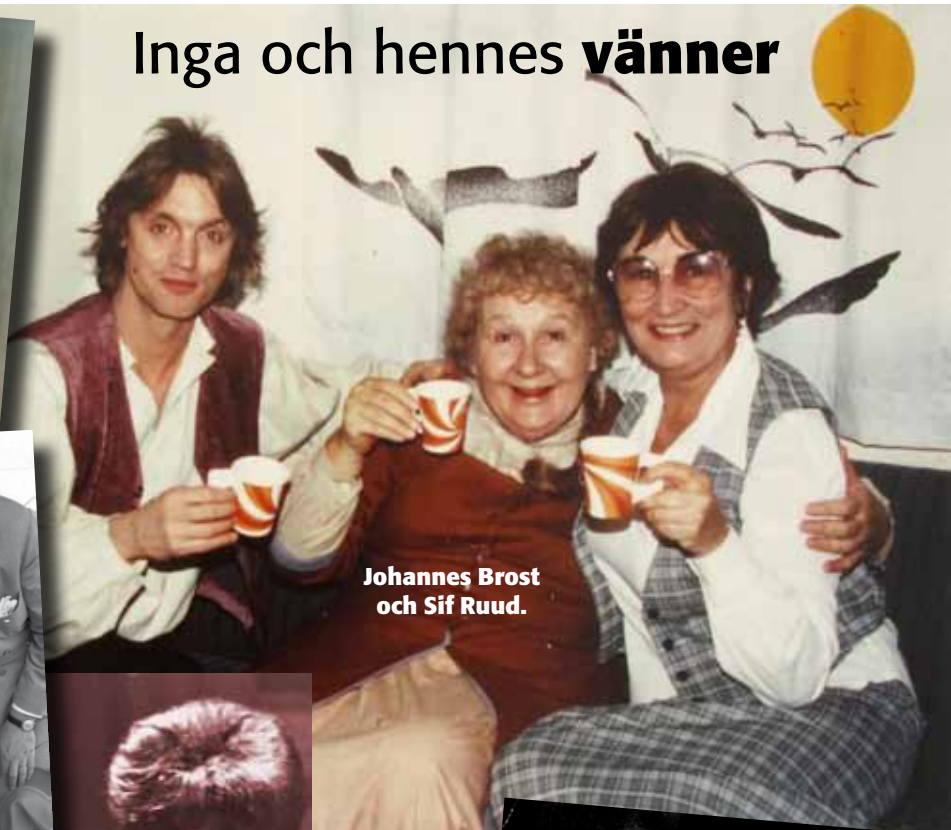
Johannes Brost och Sif Ruud.