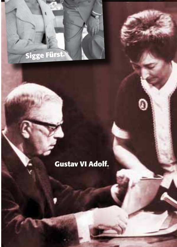
Gustav VI Adolf.