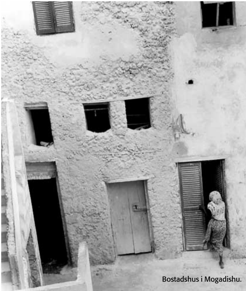
Bostadshus i Mogadishu.

Intervjuerna ger grundläggande information om uppväxt, skolgång, arbete och arbetsliv, men utelämnar ändå åtskilligt av intresse. De frågestyrda intervjuerna sätter förstärkt gränser för berättelsernas detaljrikedom och djup, men det är också högst troligt att återhållsamheten dikteras av osäkerhet om det egentliga syftet med intervjuerna och bristande tillit till intervjuerna. Därför har vi återkommit till dem som låtit sig intervjuas, men nu i ett delvis annat sammanhang; vi bjöd in dem till några längre, gemensamma träffar på Arkiv-Centrum. Vid det första tillfället var syftet att förstärka tilliten till projektet och dess medarbetare.