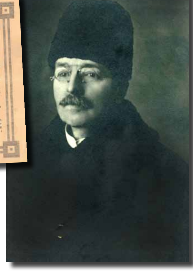
UR N A NILSSONS PERSONARKIV.

10. Civilisationen måste genomgå tre stadier för att nå världskulturen. I världens, II behövs raser för världskulturen och III de civiliserade stadierna utan krig m. m., som med full personlig frihet skall för massen som i symmetri för världen, det logiska och kyrkans i all världskulturen och världskulturens tillstånd.