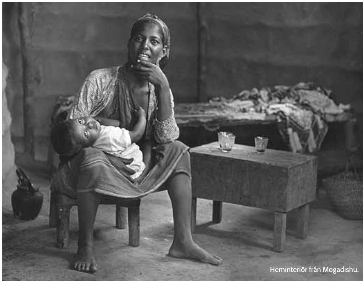
Heminteriör från Mogadishu.