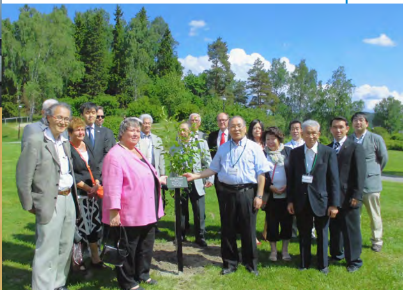
◀◀ 記念植樹をした桜を囲んで記念撮影（上）。中央下は交流 25 年の記念に出席者全員の親指で木の葉のように押しサインしたもの。