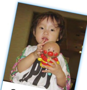
アンパンマンと一緒に