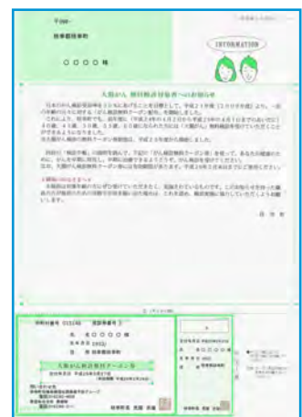
【大腸がん検診無料クーポン券の見本】