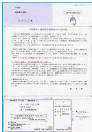
【子宮頸がん検診無料クーポン券の見本】

※子宮頸がん、乳がん検診は女性のみ対象で、大腸がん検診は男女とも対象となります。