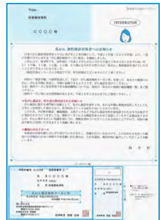
【乳がん検診無料クーポン券の見本】