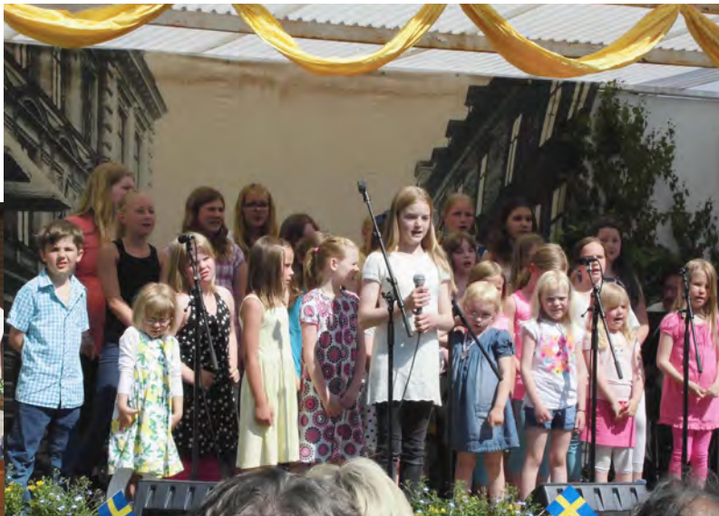
◀ ナショナルデイ会場で子どもたちのコーラスの様子

ソレフテオ市庁舎の会議室において、ソレフテオの紹介映像を視聴しながら、両自治体関係者に蹴場一等書記官を交え、それぞれの現状や今