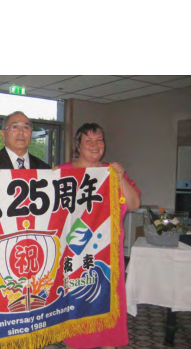
▲ 交流 25 年記念式典で枝幸町から特注の大漁旗を贈呈（左）。中央上はノルウェーと共同開発で整備を進めている風力発電所を視察。

夕刻からは、いよいよ交流25年記念式典が始まりました。会場は、ホテル・ハリストタベリエットの最上階5階のスカイバーです。ここからソレフテオ中心部を一望することができます。快晴だったため、昼間のような明るさで美しい街並みが映