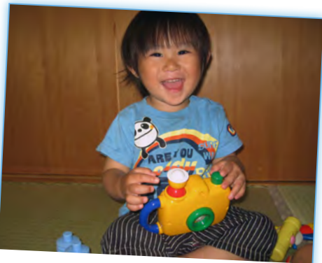
このオモチャ、おもしろいよ！