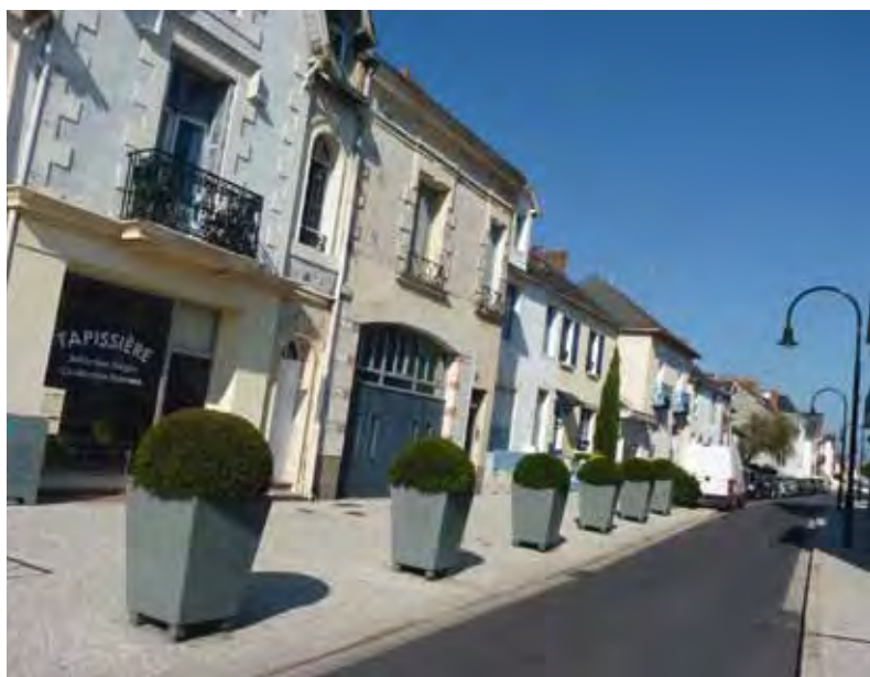
Rue de la Gare

La Ville a trouvé une solution alternative pour débroussailler ses terrains : les moutons. Quatre Landes de Bretagne, espèce locale et rare, ont été adoptées par la commune. Leur pâturage permet de limiter l'utilisation de la tondeuse mécanique et la pollution sonore. Et si leur nature rustique leur permet de vivre au grand air, la Ville leur a confectionné un abri transportable d'un endroit à l'autre.