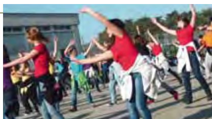
Affinement du projet de rénovation du gymnase du collège

De nouveaux projets seront lancés dans l'année. Parmi eux :