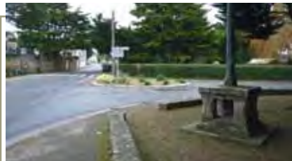
Aménagement des abords du futur musée des jeunes artistes (villa Boesch)