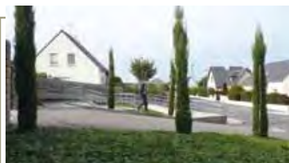
Création d'un accueil et d'un vestiaire au cimetière de Codan