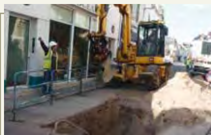
Effacement des réseaux

De nouveaux projets seront lancés dans l'année. Parmi eux :