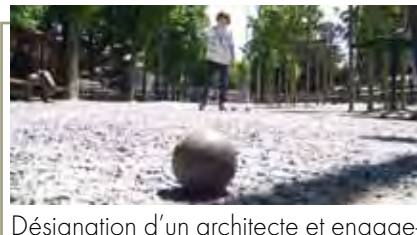
Désignation d'un architecte et engagement de la maîtrise d'œuvre pour une salle d'activités sportives et culturelles

D'autres projets sont en préparation, comme les réflexions sur le remplacement de l'orgue de l'Église Saint-Nicolas ou encore sur l'aménagement de l'espace jeunes.