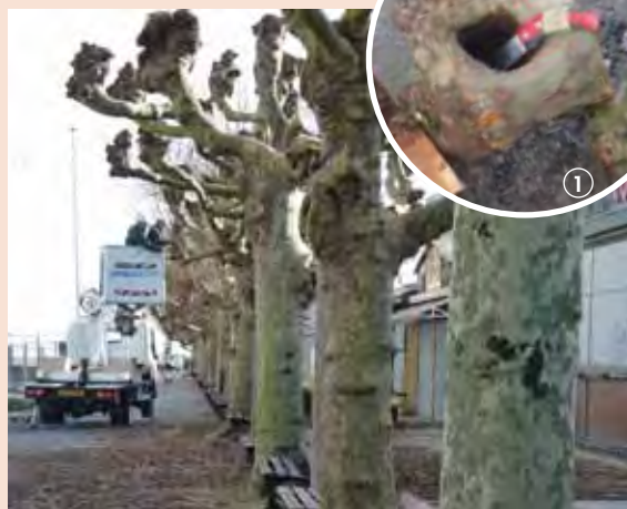
① Tête de branche charpentière creusée par l'infection. La lame de l'outil (30 cm) s'enfonçait entièrement, sans forcer.

A terme, les platanes devront être remplacés. Une réflexion sur l'essence à sélectionner est actuellement en cours.