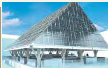
Réhabilitation de la place des Halles

Plusieurs chantiers viennent de s'achever :