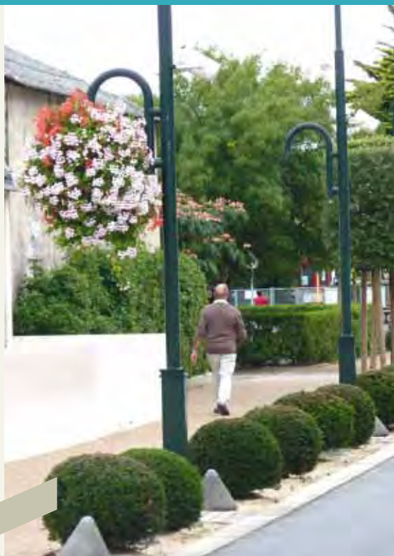
Rue des Marais

Les résidus des tailles sont collectés par une entreprise spécialisée dans le recyclage de ces déchets verts. Les pousses d'ifs permettent en effet l'hémisynthèse d'une matière d'intérêt majeur dans la lutte contre le cancer : le taxotère.