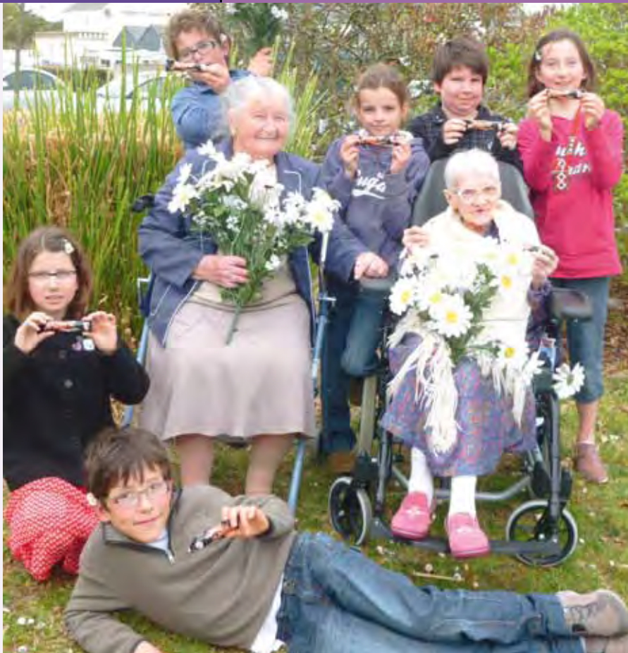
Illustration du mois de mars intitulée « Un mars et ça repart ! »