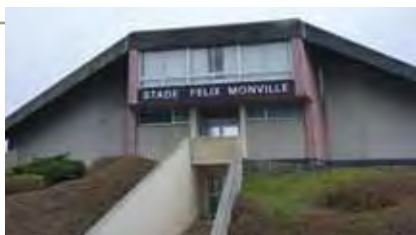
Lancement des études pour la rénovation des tribunes du stade Félix Monville