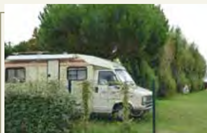
Création d'une aire de camping-cars