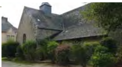
Amélioration du cadre de vie autour de la Chapelle Saint-Julien Sainte-Anne