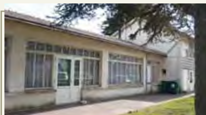
Rénovation de la toiture de la salle municipale Bimont