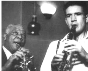
Avec Sidney BECHET