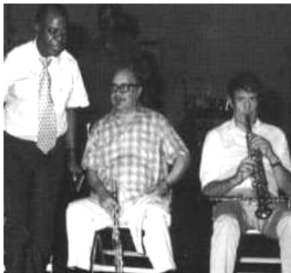
Avec Louis ARMSTRONG & Barney BIGARD

Il accompagne Sidney Bechet au cours du Festival de Jazz de Paris (1949). Cette rencontre déterminante marquera le début d'une amitié indéfectible, jalonnée de fameuses « jam-sessions » avec Stéphane Grappelli, Jerry Mulligan, Earl Hines, Tommy Dorsey, Albert Nicholas, Lionel Hampton, Kenny Clark, etc.