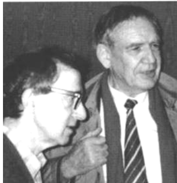
Avec Woody ALLEN