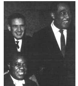
Avec Louis ARMSTRONG & Duke ELLINGTON

Aux premiers disques, réalisés à titre privé et vendu aux amateurs de Lorientais , succède un contrat avec « Swing » en 1947. Les choses viennent de prendre un tour sérieux, les enregistrements de disque s'enchaînent pour Claude Luter et sa formation.