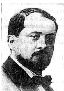
Fig. 6: Tr. Lalescu

TRAJAN LALESCU Professeur à l'Université de Bucarest