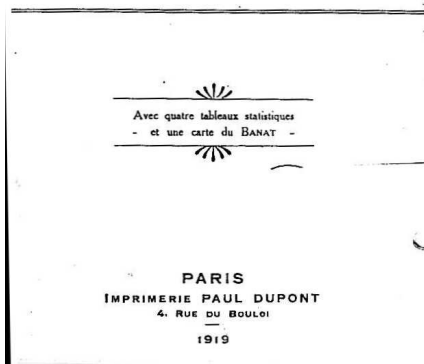
Fig. 7: Foia de titlu a publicației lui Traian Lalescu la Paris

Tecuci) pentru a raporta. Nu-l găsește însă pe comandant, maiorul aviator Andrei Popovici, întrucât acesta primise ordine superioare și se mutase cu tot comandamentul la aerodromul de la Tecuci. Echipajul Vincent-Pârvulescu decolează, ajunge la Tecuci și Pârvulescu aleargă să raporteze șefului său tragica descoperire. Comandantul consideră că acest fapt deosebit de grav trebuie verificat înainte de a-l raporta superiorilor, misiune îndeplinită de echipajele Vincent-Pârvulescu și Olănescu-Gafencu care au fost de acord asupra spargerii frontului de la Mărășești. Acesta este faptul. Fără descoperirea lui la timp, soarta bătăliei de la Mărășești – și prin ea soarta țării – era alta. Kaiserul Wilhelm al II-lea care privea de pe înălțimea celebrei cote 1001, ar fi asistat la succesul trupelor sale. Neanunțarea la timp a acelei spargerii a frontului, tocmai într-o epocă în care pe front rămăsese numai o