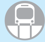
โครงข่ายสายหลัก

โครงข่ายรถไฟฟ้าตามแผนการพัฒนาโครงการระบบขนส่งมวลชนทางรางในเขตกรุงเทพมหานครและปริมณฑล 10 เส้นทางตามนโยบายรัฐบาลเร่งด่วน ดังนี้