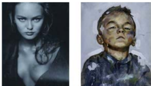
A gauche, une photo signée Paolo Roversi et à droite une œuvre de Lou Ros, en vente le 6 février chez Artcurial au profit d'Autistes sans frontières. © à droite Paolo Roversi / à gauche Lou Ros

Publié le 04/02/2013 à 15H32, mis à jour le 04/02/2013 à 15H50