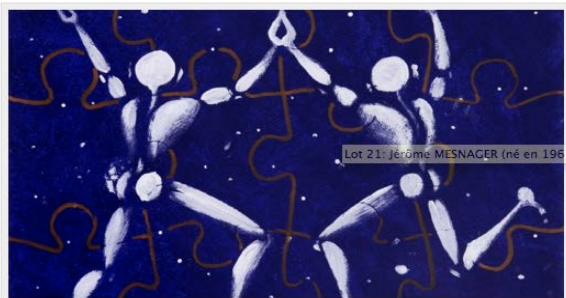
Lot 21: Jérôme MESNAGER (né en 1961)

Des artistes plasticiens et une centaine de musiciens de la scène rock et heavy metal se mobilisent contre l'autisme et le cancer à l'occasion de deux ventes de bienfaisance organisées à Paris les 6 et 11 février.