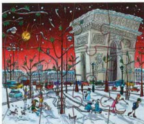
Alain Godon, Ça glisse à Paris I, 2013, bildo reliefo 3D, 32 x 40 cm, mise à prix : 300 euros, vente du 6 février, Artcurial, Paris.

Artcurial disperse 50 œuvres originales réalisées sur des puzzles au profit d'Autistes sans frontières