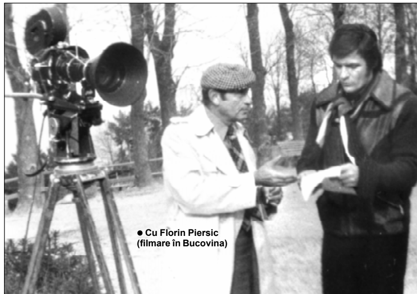
● Cu Florin Piersic (filmare în Bucovina)

* - De ce ați urmat Filosofia și nu Conservatorul? - Încă de pe când eram elev al Liceului Evreiesc din Iași, îmi plăceau textele filosofice. Le discutam ore întregi cu prietenul și colegul meu Tolea, Anatol Vieru. Țin minte zilele când mă duceam