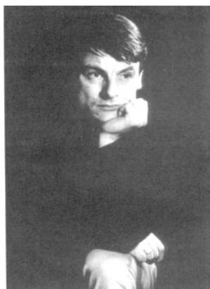
Andrej Arszenyevics Tarkovszkij