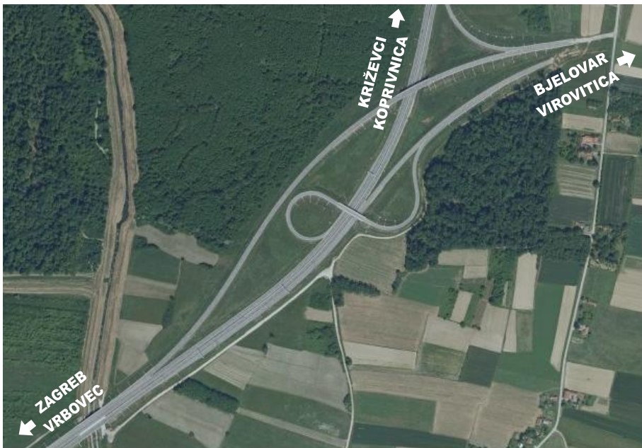
Interregionalni čvor Vrbovec 2

Dionica Gradec - Velika Mučna nastavlja se na prethodno izgrađenu brzu cestu Sv. Helena – Gradec neposredno iza interregionalnog čvora Vrbovec 2.