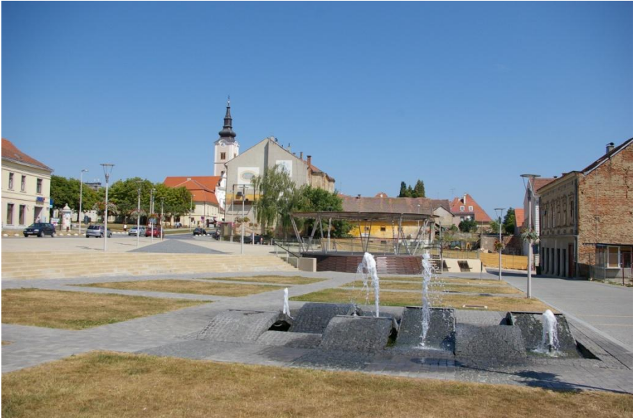
Trg u Križevcima

Svojom netaknutom prirodom i bogatim šumama s brežuljkastom okolicom podno planine Kalnik, Križevci pružaju veliku mogućnost za razvoj svih oblika turizma (izletničkog, seoskog, lovnog i dr.) te za pripreme sportaša.