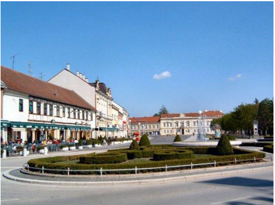
Zrinski trg u Koprivnici

Koprivnica se nalazi na križištu magistralnih prometnica od Zagreba i Varaždina prema Virovitici i Osijeku te željezničko križište na pruzi Budimpešta-Zagreb i Varaždin-Osijek.