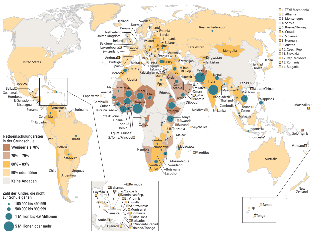
Abbildung 1: Zahl der Kinder, die nicht zur Schule gehen, und Nettoeinschulungsraten, 2005