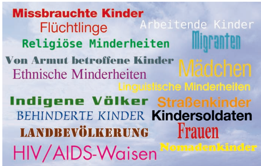
Abbildung 2: Beispiele für Gruppen, die im Bildungsbereich ausgeschlossen oder marginalisiert sind

Inklusion zu fördern bedeutet Diskussionen anzuregen, positive Einstellungen zu fördern und soziale wie bildungsbezogene Rahmenbedingungen zu verbessern, um so die neuen Anforderungen für Bildungsstrukturen und Politik zu bewältigen. Dies beinhaltet die Verbesserung der Inputs, Prozesse und Bedingungen zur Förderung von Lernprozessen und gilt sowohl auf der Ebene der Umgebung des Lernenden als auch auf der Ebene des Systems. Wie viel erreicht werden kann, hängt vom Willen und den Kapazitäten der Regierungen ab, Politik im Sinne der armen Bevölkerungsschichten zu gestalten, die öffentlichen Ausgaben für Bildung am Prinzip der Gleichheit auszurichten, interdisziplinäre Verbindungen zu schaffen und inklusive Bildung als konstituierendes Element lebenslangen Lernens anzugehen.