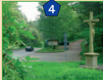
Parkplatz „Eilöchel“ zwischen Busenberg und Schindhard