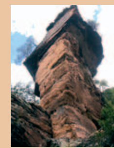
Sprinzelfelsen am Dickenberg