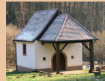
Die St. Gertraudkapelle – idyllisch gelegen im Tal nach Erlenbach und zur nahen Burg Berwartstein