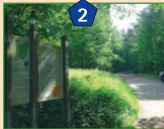
Waldparkplatz am Weißensteiner Hof