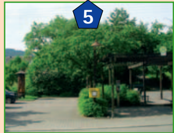
Dorfplatz in der Ortsmitte (Sehenswert die Jakobus Statue)