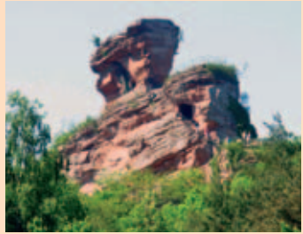
Majestätisch hoch über Busenberg – die Felsenburgruine Drachenfels