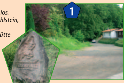
Startpunkt Parkplatz Hexenplätzel

Am Parkplatz „Hexenplätzel“ (1) oberhalb des Sportplatzes geht's los. Pferchsfeldfelsen, Löffelsberg, Buhlstain, St. Gertraud Kapelle, Heidenberg, Buchkammer, Drachenfels, Jagdhütte am Jüngstberg, Geierstein, Dickenberg, Eilöchel, Eichelberg sind die wichtigsten Stationen im Uhrzeigersinn.