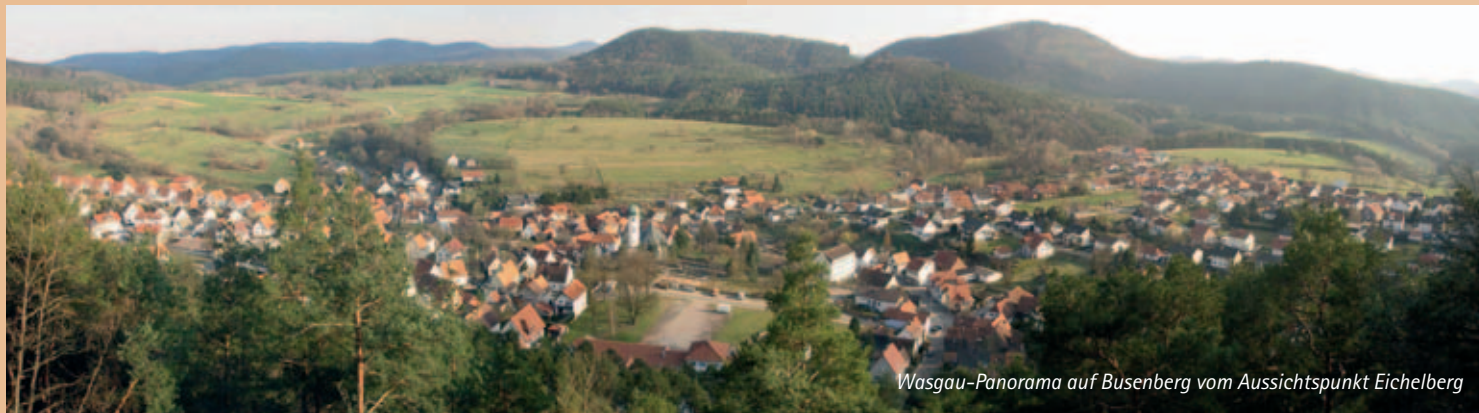
Wasgau-Panorama auf Busenberg vom Aussichtspunkt Eichelberg