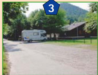
Drachenfelshütte des PWV Busenberg