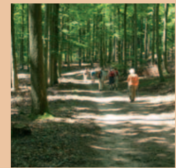
Urlaub im Dahner Felsenland – ein Paradies zum Wandern und Erholen

Herrliche Wandertour durch den schönen Wasgau – im Herzen des einzigartigen „Naturpark Pfälzerwald“