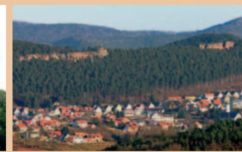
Eichelberg mit Kreuzel und Dreifelsen