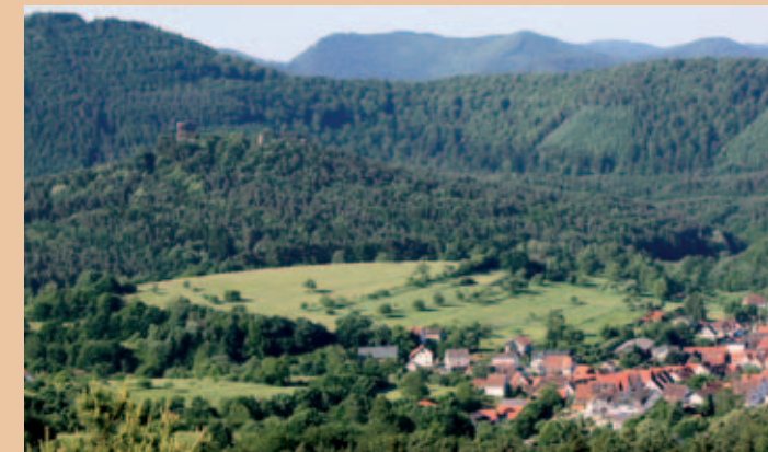
Aussichtspunkt am Löffelsberg mit Blick auf Drachenfels und Jüngstberg