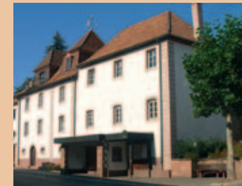
Ein Kleinod in der Ortsmitte von Busenberg – das „Schlüssel“, einst im Besitz der Dürkheimer Grafen