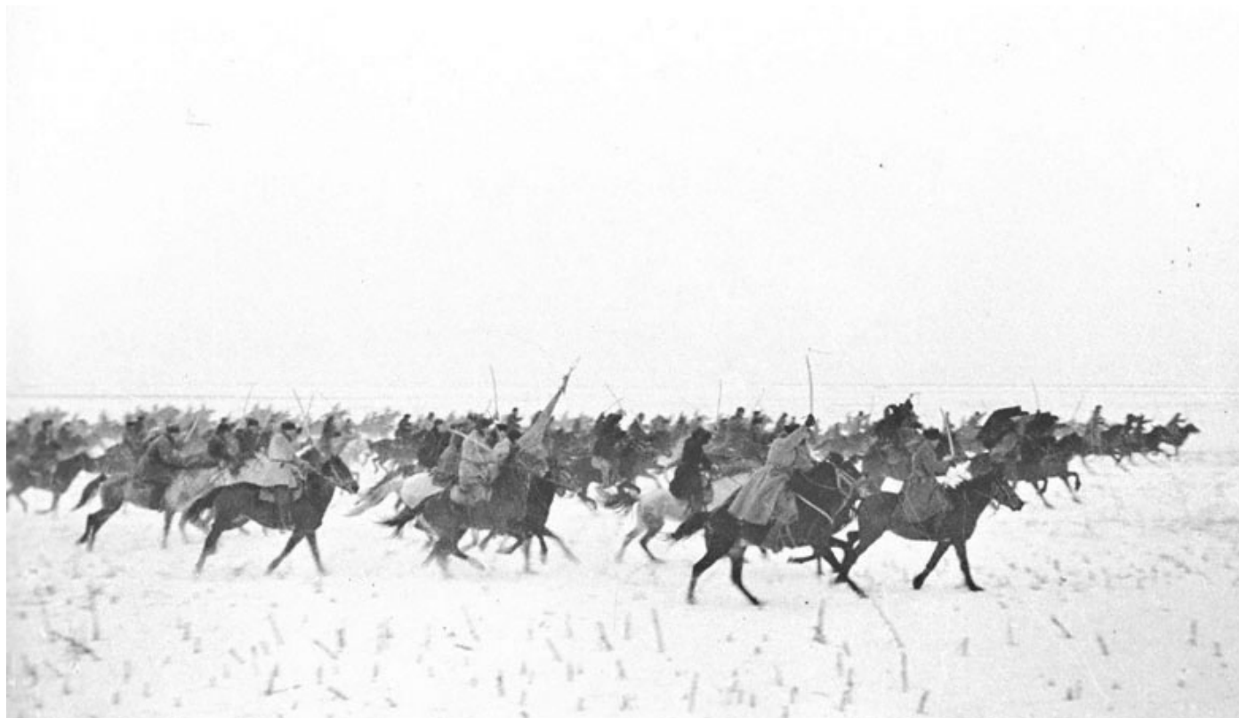
Рейд конницы Доватора по тылам противника

гром, что возникла паника. Всегда сопровождающие панику невероятные слухи распространились очень быстро. По слухам, «ходившим» в солдатской среде, в тыл прорвалось 100 тысяч казаков. Немецкое командование, для того, чтобы умерить страх своих солдат сообщило о том, что казаков не 100, а 18 тысяч. На самом деле их было 3 тысячи.