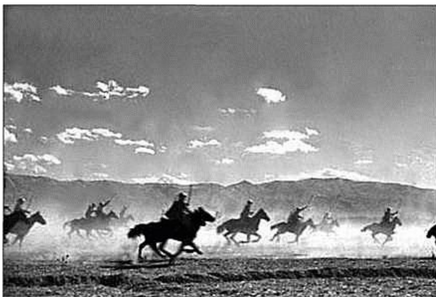
Кавалерийский корпус Н. Я. Кириченко в атаке

Казачьи кавалерийские соединения принимают участие в освобождении Северного Кавказа и Украины.