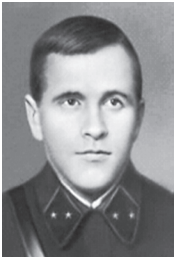
Командир кавалерийской группы Л.М. Доватор

Прорвав оборонительные позиции немцев, казаки-доваторцы сумели продвинуть в глубь территории, занятой противником, на 100 километров. В немецком тылу был учинен такой раз-