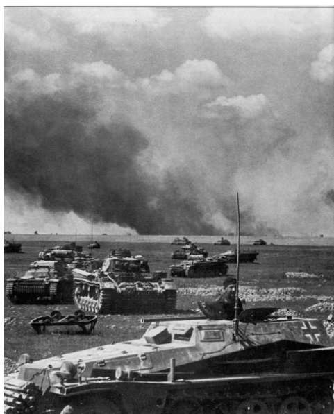
К бакинской нефти

1942 год. После разгрома немецко-фашистских войск под Москвой, Красная Армия потерпела ряд серьезных поражений на харьковском направлении, был оставлен Крым, а в июле 1942 года - и Севастополь. Немцами были оккупированы территории Северного Кавказа, где традиционно проживало казачье население. Немецкие части устремились на Кавказ – к бакинской нефти.