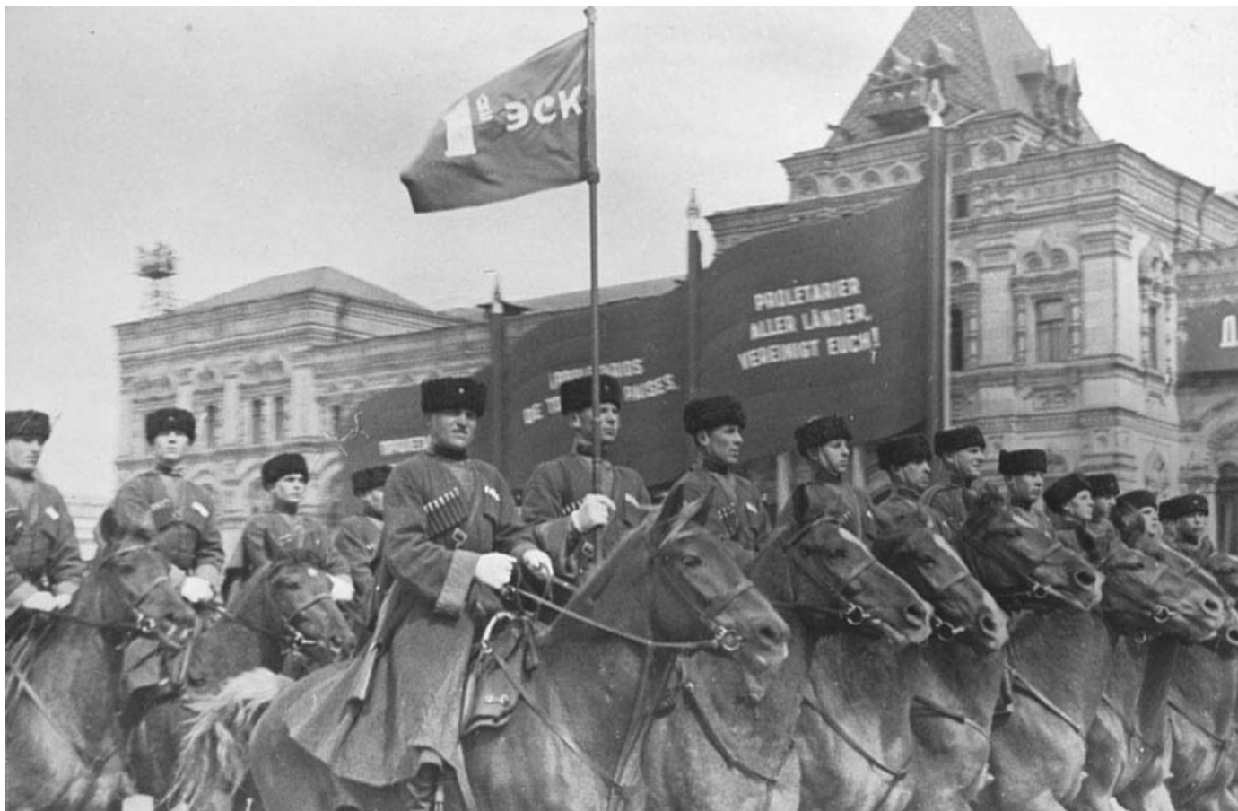
Кубанские казаки на первомайском параде в 1937 г.

В феврале 1937 года в Северо-Кавказском военном округе была сформирована Сводная кавалерийская дивизия в составе Донского, Кубанского, Терско-Ставропольского казачьих полков и полка горцев. Эта дивизия участвовала в военном параде на Красной площади в Москве 1 мая 1937 года.