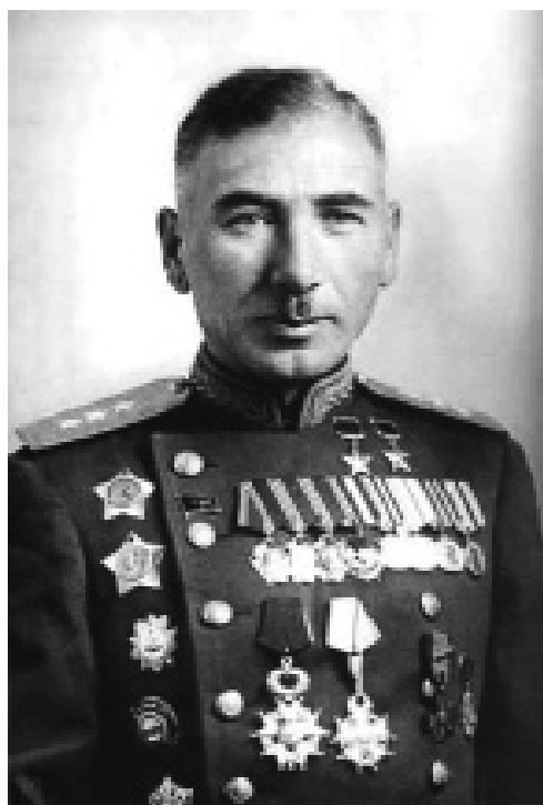
И. А. Плиев

В конце марта 1944 г. 4-й гвардейский Кубанский кавалерийский корпус в составе конно-механизированной группы 3-го Украинского фронта принял активное участие в Одесской наступательной операции. В боях по окружению и уничтожению одесской группировки противника казаки кавалерийские соединения показали образцы воин-