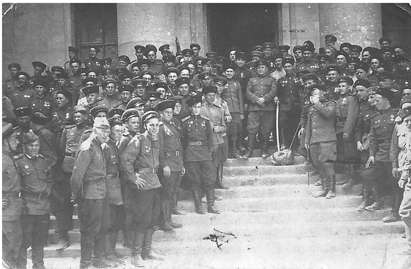
Казаки в Берлине. 1945 г.

Зимой 1945 года развернулись ожесточенные бои в Венгрии. Германия опасалась потерять своего последнего союзника. В боях у озера Балатон с середины января 1945 года отличились казаки 5-го гвардейского кавалерийского корпуса. Они внесли весомый вклад в уничтожение 6-й танковой армии СС – одного из последних элитных соединений войск вермахта.