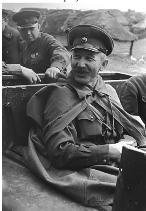
Командир 2-го кавалерийского корпуса П. А. Белов

В 1942-1943 годах в битве за Кавказ особую стойкость, храбрость и героизм проявили казаки сформированного в начале 1942 г. 17-го казачьего кавалерийского корпуса генерала Н.Я. Кириченко. Летом 1942 г. корпус вел тяжелые оборонительные бои на Кубани против имевших абсолютное превосходство в танках и самолетах немецких сил.