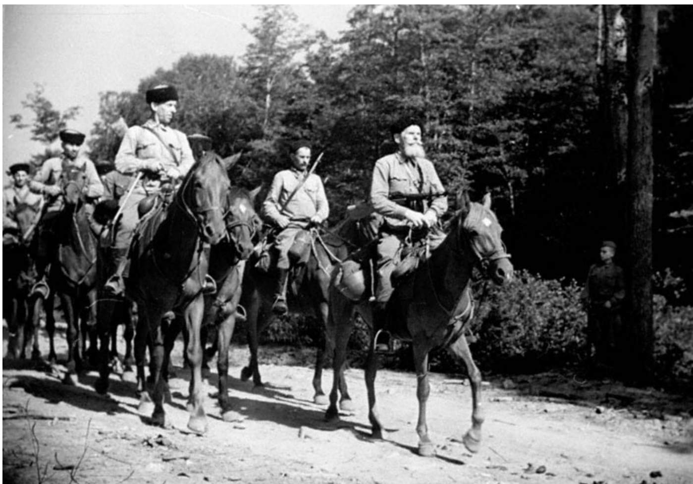
Казачи корпуса генерал-лейтенанта Кириченко на марше 1942 г.

1943 год - год коренного перелома в войне. Красная Армия приступила к проведению масштабных наступательных операций на всех фронтах. Немецко-фашистские войска были сокрушены под Сталинградом (более 22 дивизий попали в окружение и были разгромлены) и потерпели поражение в боях на Курской дуге.