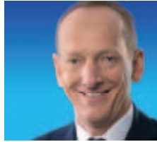
Dr. Karl-Thomas Neumann

GM Vice President, President GM Europe Chairman of the Management Board of the Adam Opel AG as of March 1st, 2013 GM Vice President, President GM Europe Vorsitzender des Vorstands der Adam Opel AG ab 1. März 2013