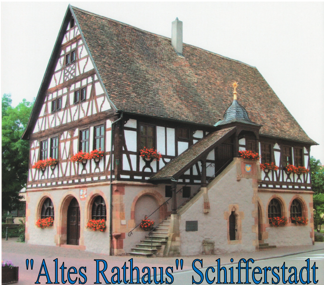
"Altes Rathaus" Schifferstadt

Bei der Verleihung selbst, die immer während der Karnevalssaison stattfindet, wird ein zünftiges Saumagen-Essen mit dazu passendem Saumagen-Wein gereicht. Ein buntes Rahmenprogramm mit Musik und humorigen Beiträgen umrahmt die Verleihungsfeierlichkeiten. Die Ordens-Form eines gefüllten Saumagens wurde gewählt, um die Pfälzer Spezialität darzustellen, welche in den 90er Jahren auf staatsmännischer Ebene berühmt wurde und die Pfalz in aller Welt bekannt machte. Der Orden besteht aus Rosenquarz, wiegt ca. 740 Gramm und ist jedes Mal ein Unikat. In Idar-Oberstein bekommt er den Schliff auf Saumagen-Form. Er ist verziert mit silbernen Abschnürungen, die an einer Silberkette befestigt sind, damit der Orden um den Hals getragen werden kann.