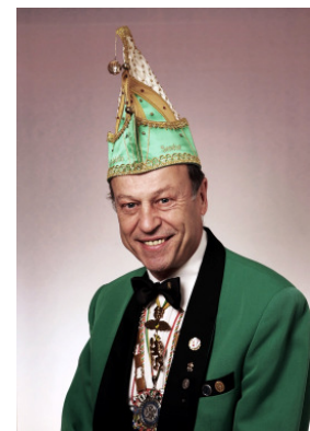
Moderator der Veranstaltung: Senator Wolfgang Knobloch