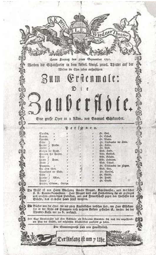
6. ábra. A varázsfuvola 1791-es ősbemutatójának plakátja

Mozart alkotásai a műfaj remekművei közé tartoznak, úgymint a Varázsfuvola és a Szöktetés a szerájból.