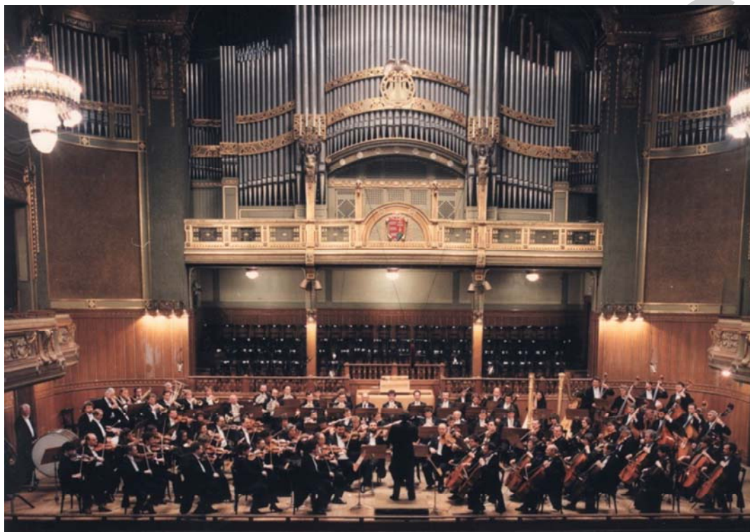
7. ábra. Szimfonikus zenekar

Ezeket a koncerteket jegyvásárlás ellenében bárki látogathatta, ami alapvető változást jelentett nem csak a zenekarok életében, de az egész európai zenekultúra jövője szempontjából.