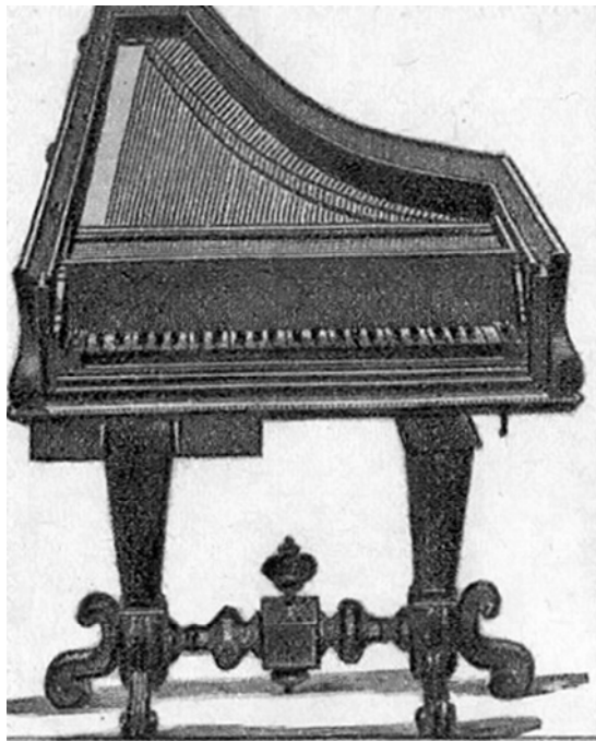
8. ábra. Cristofori zongorája 1726-ból

Az első olyan billentyűs hangszert, amely a húrokat nem pengetéssel, hanem kalapácsok megütésével szólaltatta meg, Bartolomeo Cristofori spinét- és csembalókészítő alkotta meg 1709-ben. Az új szerkezetet cembalo con piano e forte (hangos és halk hangú csembaló) jelzővel illették. A pianoforte elnevezés későbbre tehető, melyet a piano rövidítés váltott.