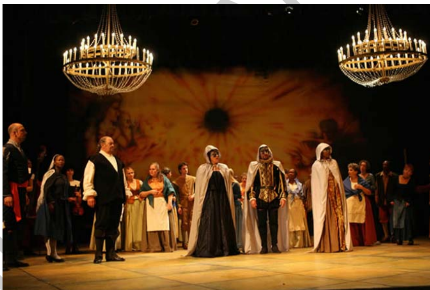
5. ábra. Mozart: Don Giovanni (részlet)

Az opera buffa cselekményét a félreértések, tévedések és a kényelmetlen helyzetbe hozott gazdagok kinevettetése jelentette.