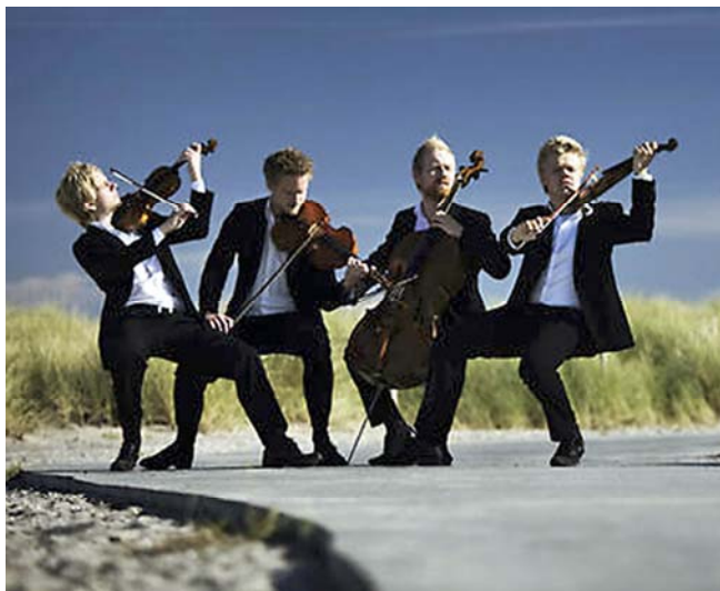
4. ábra. Vonósnégyes

A vonósnégyes mellett a következő klasszikus kamarazenei műfajokkal is találkozhatunk: