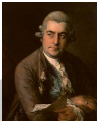
1. ábra. Johann Christian Bach (1735–1782)

A rokokó jellegzetes képviselője Bach legifjabb fia, Johann Christian Bach (1735–1782). Művei könnyed hangvételük és érzéki kifejezőmódjukkal hatással voltak Mozart korai alkotásaira is.