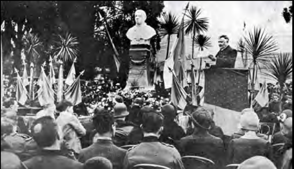
Lámina 6. Inauguración del monumento a Monseñor Arbeláez. El Gráfico . Año XV. Número 786. Junio 12 de 1926.