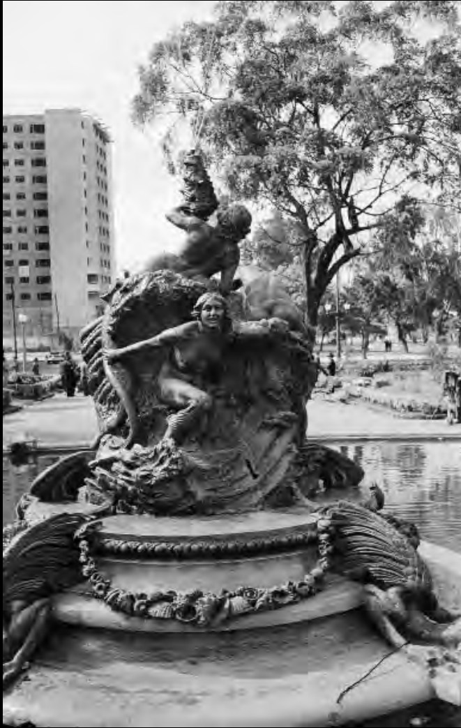
Fuente elaborada por Francisco Antonio Cano, Felix María Otalora y José C. Rodríguez. Inaugurada el 25 de Octubre de 1920, emplazada en el Parque de la Independencia. Fue retirada para dar paso a las obras de viaducto de la calle 26.