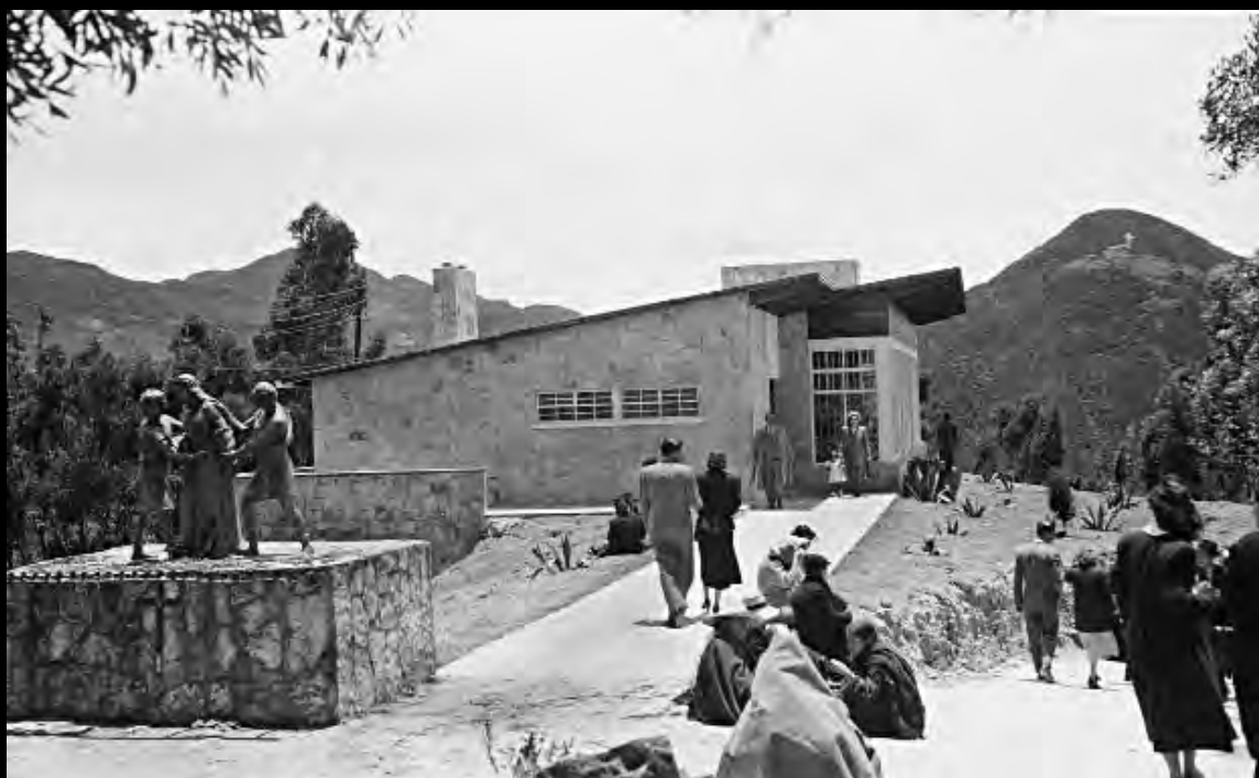
Lámina 11. Paso del Via Crucis de Monserrate.

Izquierda: Lámina 12. Inauguración del Monumento a Luis Pasteur en la Avenida La República. Cromos. Volumen XVI. No. 366. Julio 21 de 1923