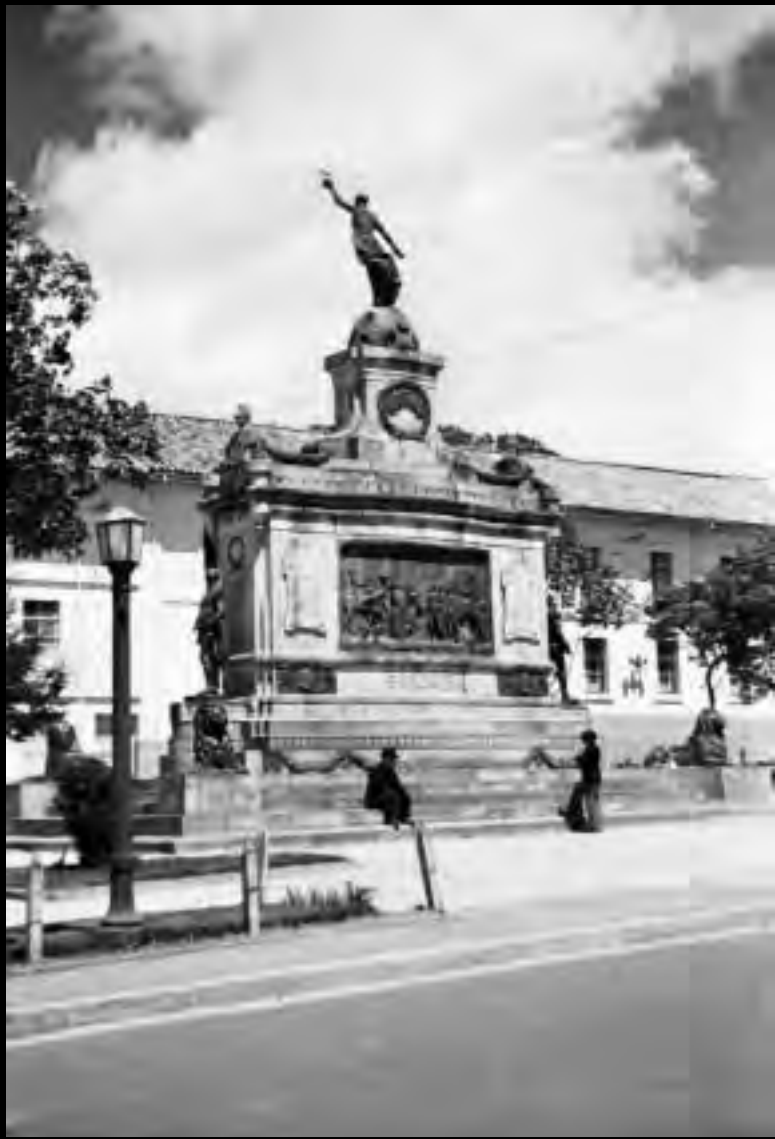
Lámina 6. Monumento a la Batalla de Ayacucho.