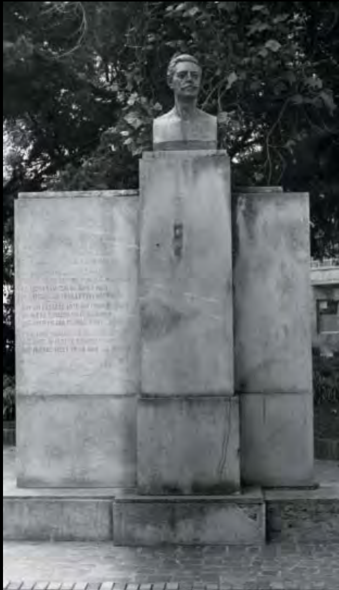
Lámina 1. Monumento a Julio Flórez Circa 1974.