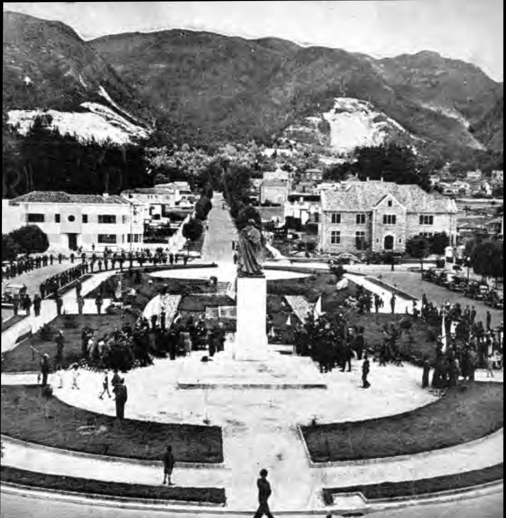
Lámina 3. Monumento a Benito Juárez. Cromos . Volumen XLVI.. Número 1139. Septiembre 24 de 1938