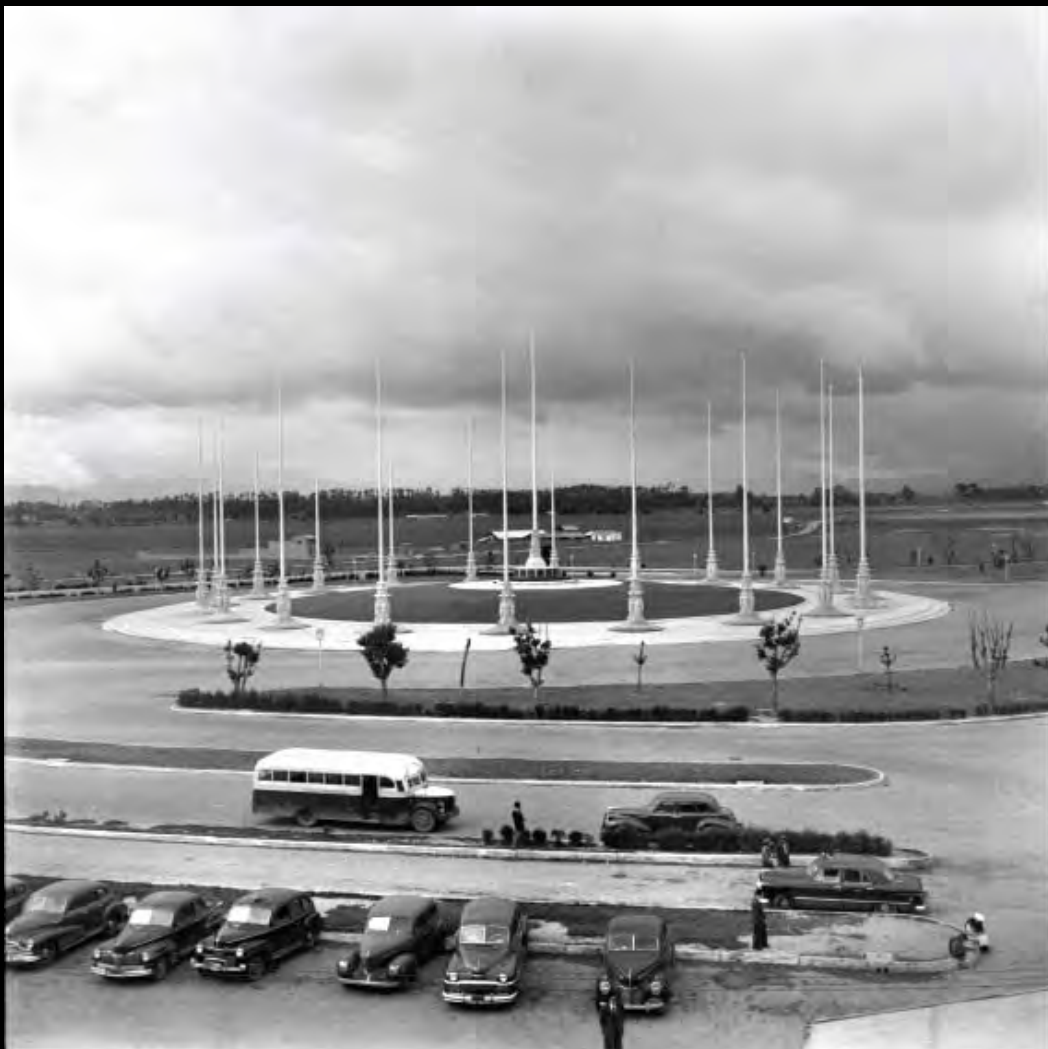
Lámina 4. Monumento a las Banderas. Circa 1949.