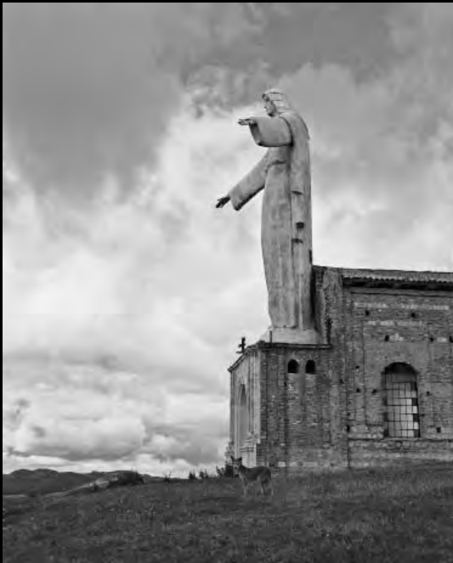
Lámina 20. Guadalupe. s.f.