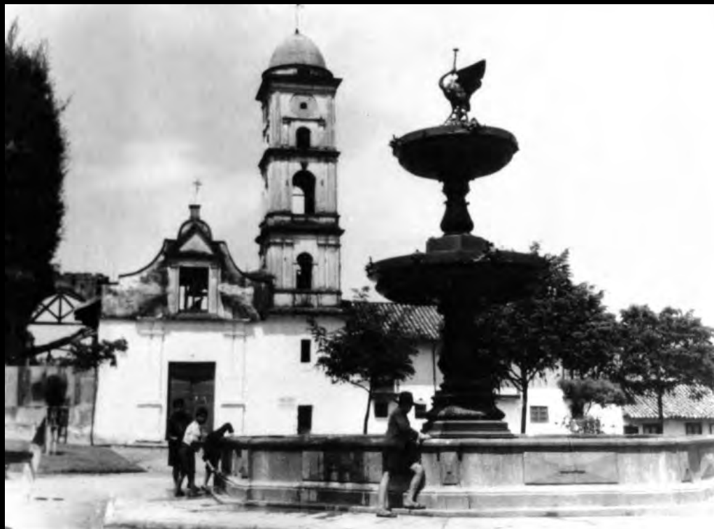
Lámina 21. Pila Pública del barrio Las Cruces. Anónimo.