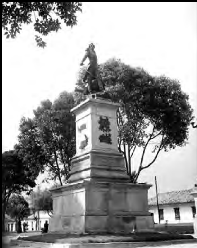
Láminas 2 y 2B. Monumento a Antonio José de Sucre. 1945.