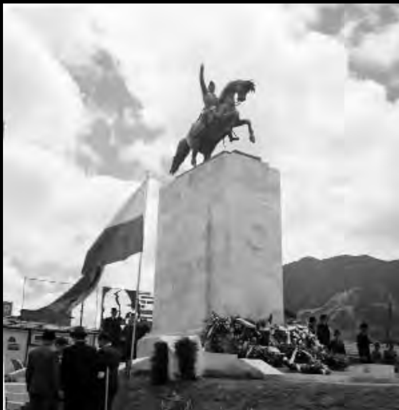
Lámina 10. Inauguración del Monumento a José de San Martín. 1941.