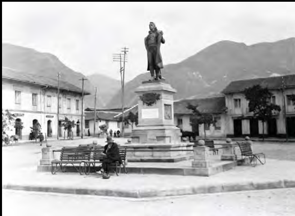
Lámina 16. Monumento a Antonio Nariño.

Arriba: Circa 1912.