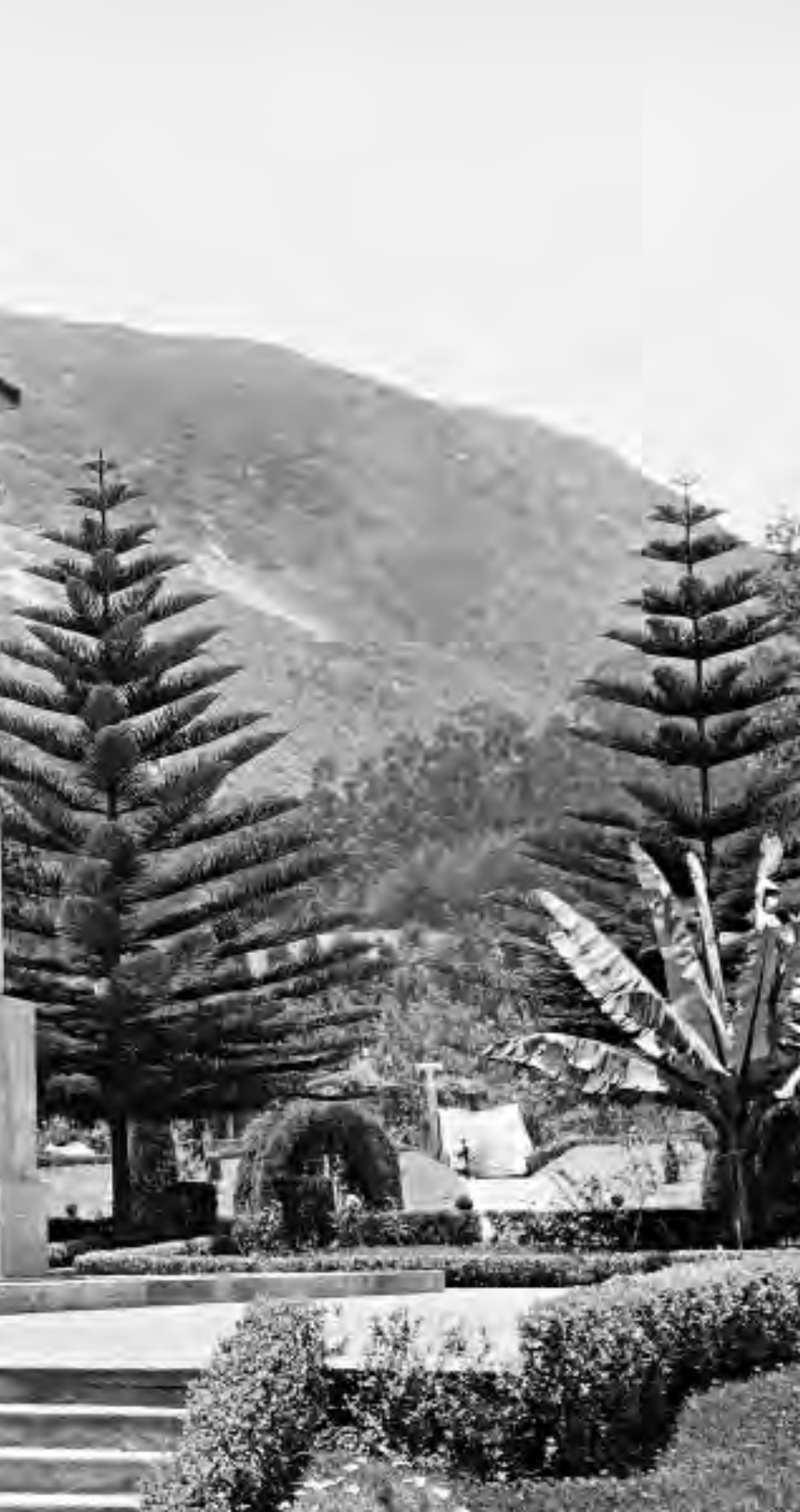
Lámina 4. Monumento al General Rafael Uribe Uribe.