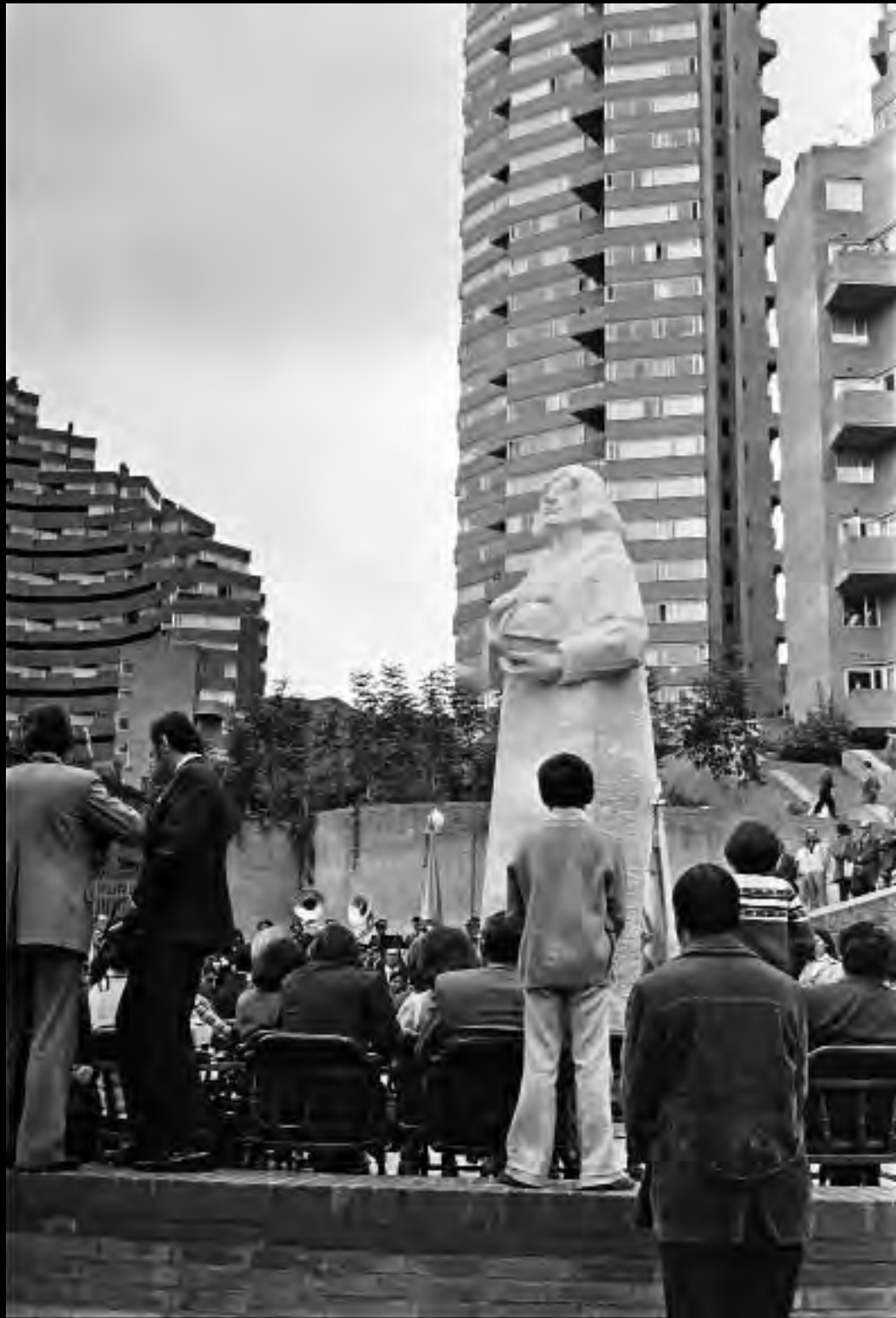
Lámina 5. Inauguración del Monumento a Nicolás Copérnico. 1974.