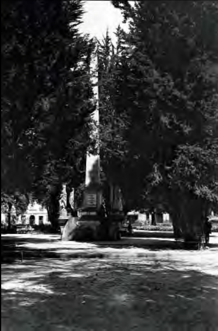
Lámina 22. Monumento a Los Mártires de la Independencia. Circa 1918. Fondo Luis Alberto Acuña, Archivo Museo de Bogotá