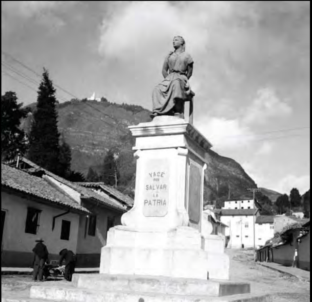
Lámina 2. Monumento a Policarpa Salavarrieta. Circa 1935.