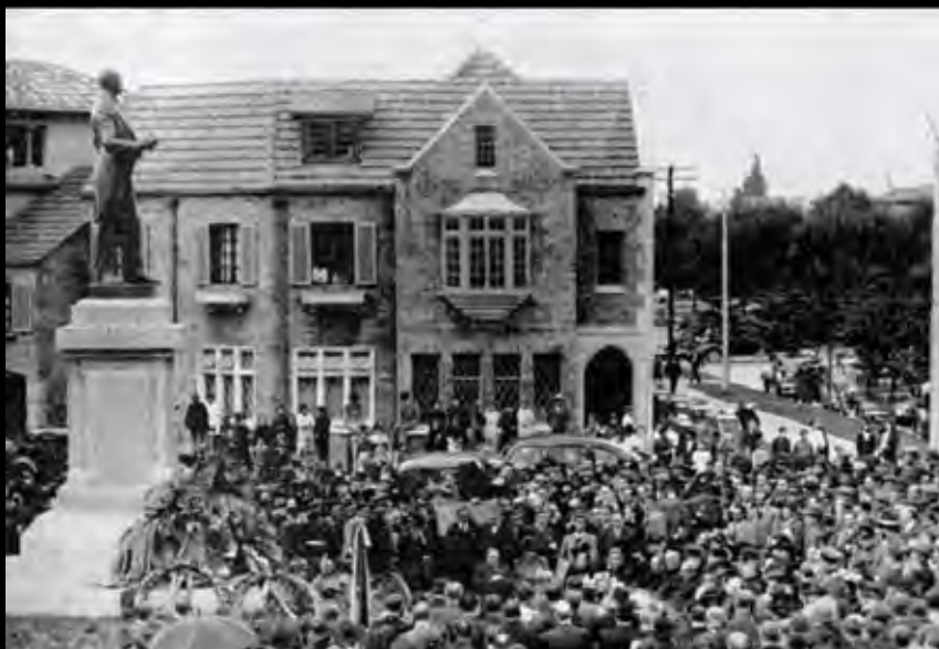
Lámina 17. Inauguración del monumento a Pedro Nel Ospina. Cromos. Volumen XLIX. Número 1218. Abril 13 de 1940