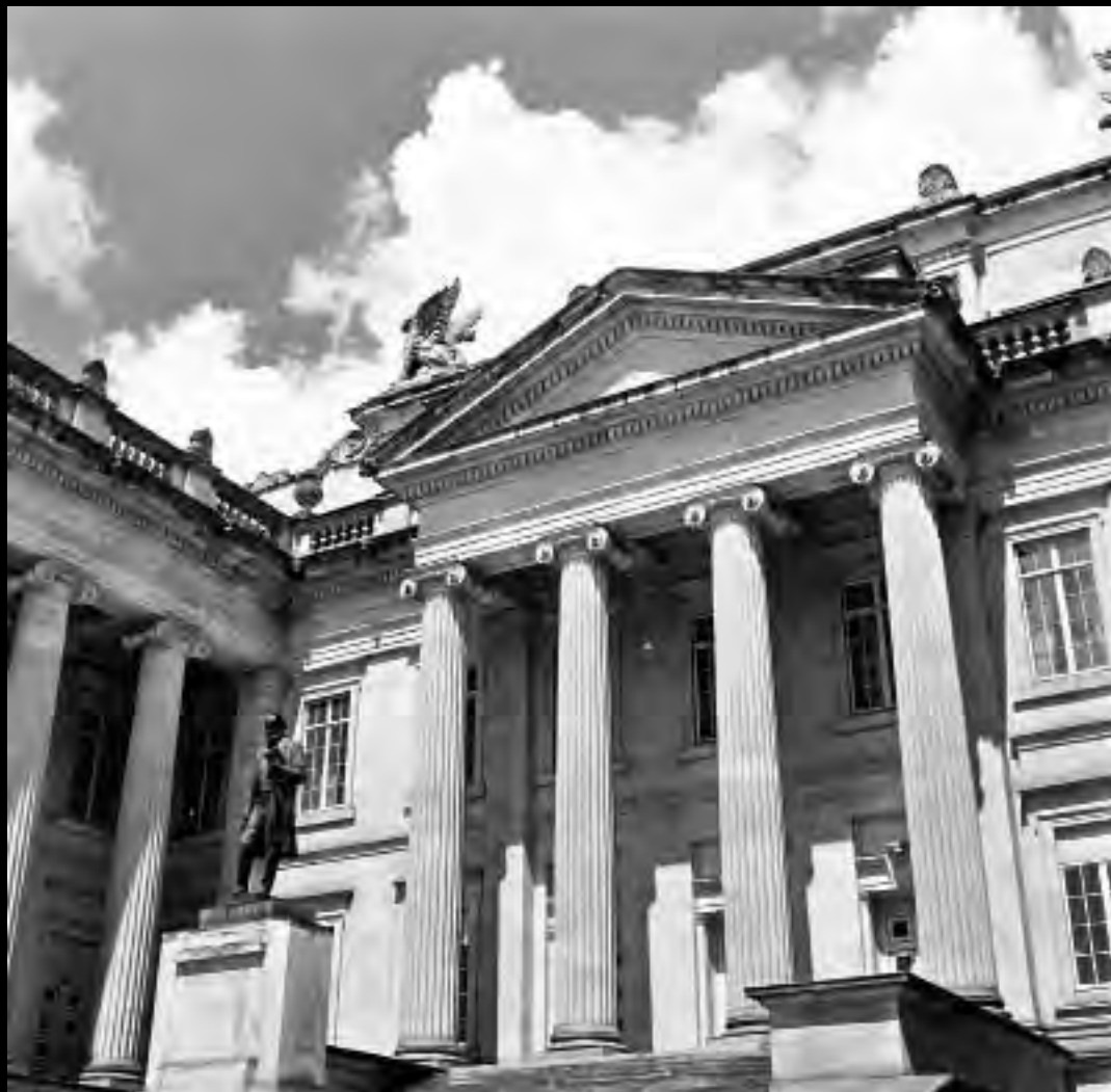
Lámina 1. Monumento a Rafael Núñez localizado en el patio sur del Capitolio Nacional. Circa 1937.