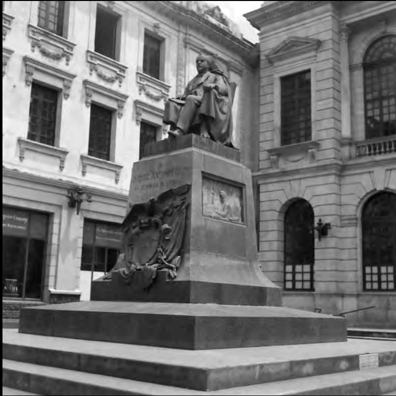
Lámina 13. Monumento a Miguel Antonio Caro. 1938.