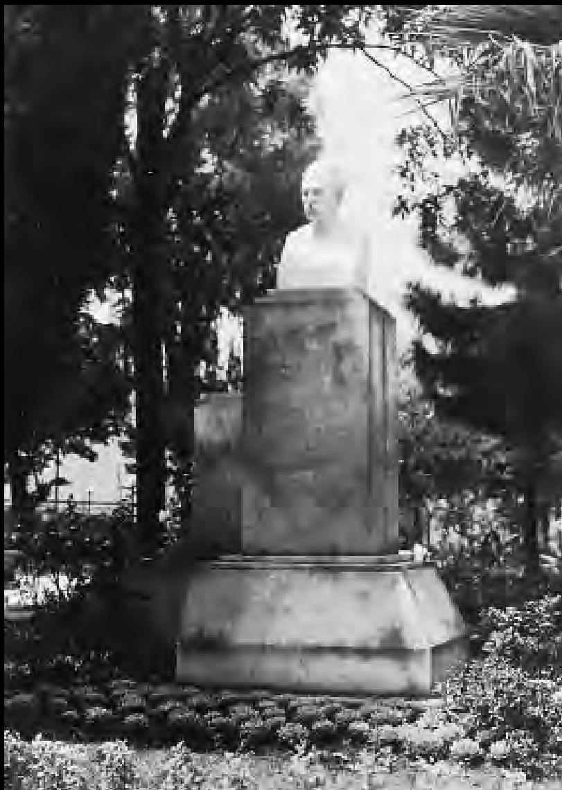
Monumento a Jorge Isaacs. Inaugurado el 20 de abril de 1947. Donado por Cornelio Hispano y emplazado en el Parque del Centenario. Álbum Jose Vicente Ortega Ricaurte, Archivo Sociedad Mejoras y Ornato de Bogotá.