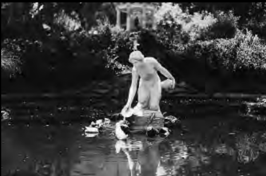
Lámina 7. La Rebeca.

Izquierda: Lámina 8. Monumento a Fracisco de Paula Santander. 1958.