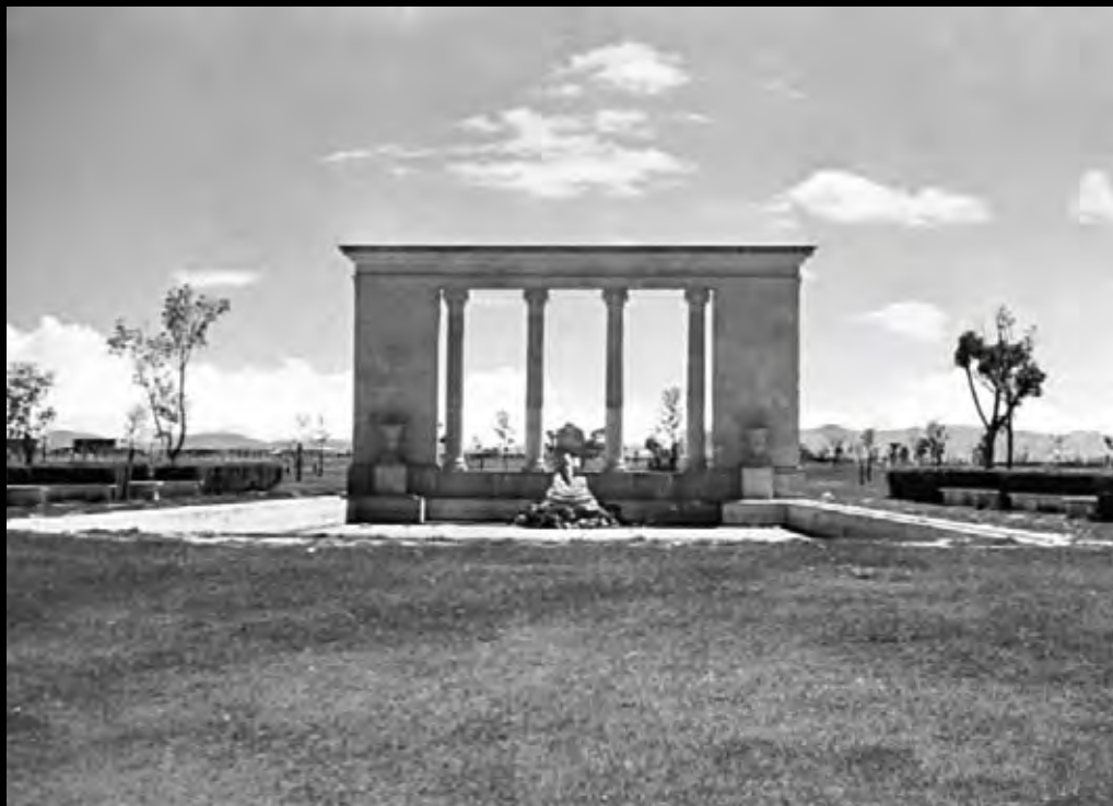
Lámina 1. Monumento a Sía. s.f.