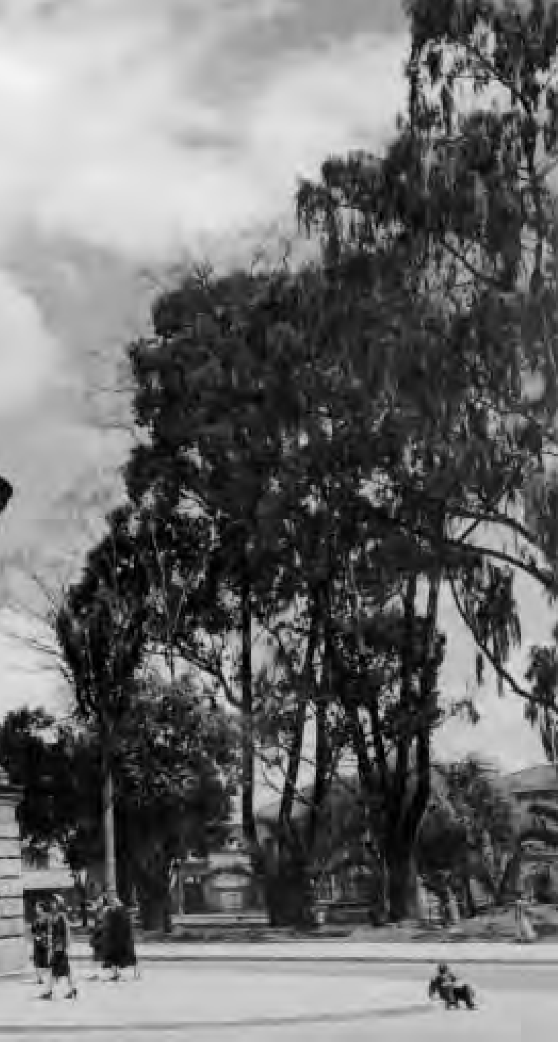
Lámina 15. Templo de Libertador. Archivo Museo de Bogotá