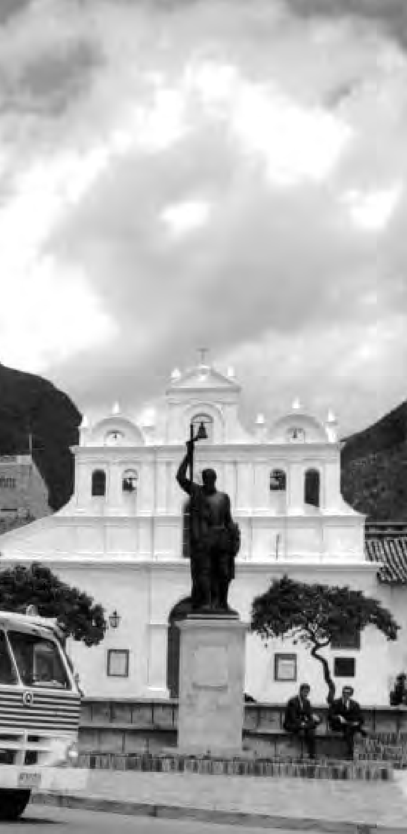
Lámina 26. Monumento a Gonzalo Jiménez de Quesada ubicado en la plazoleta de Las Aguas. Circa 1960.