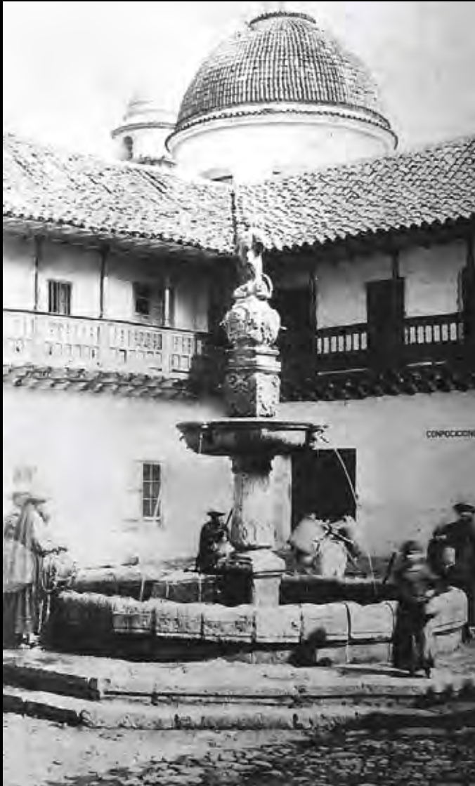
Lámina 24. La Pila del Mono.