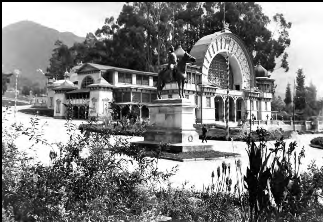
Lámina 7. Estatua ecuestre del Libertador en el Parque de la Independencia. Circa 1910.