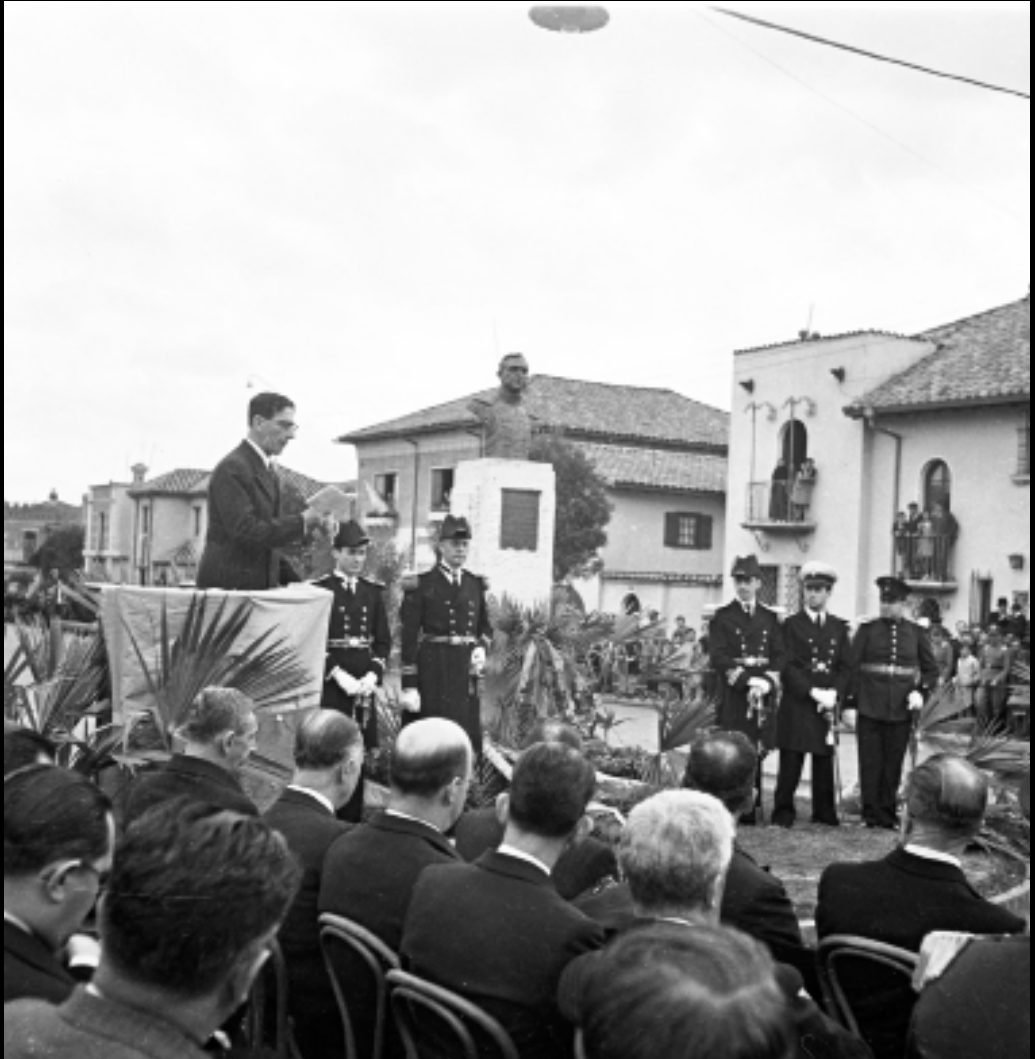
Monumento al almirante José Prudencio Padilla. Inaugurado el miércoles 7 de agosto de 1940. Busto en bronce obra de Bernardo Vieco, erigido en el separador de la calle 34, entre carreras 14 y 15.