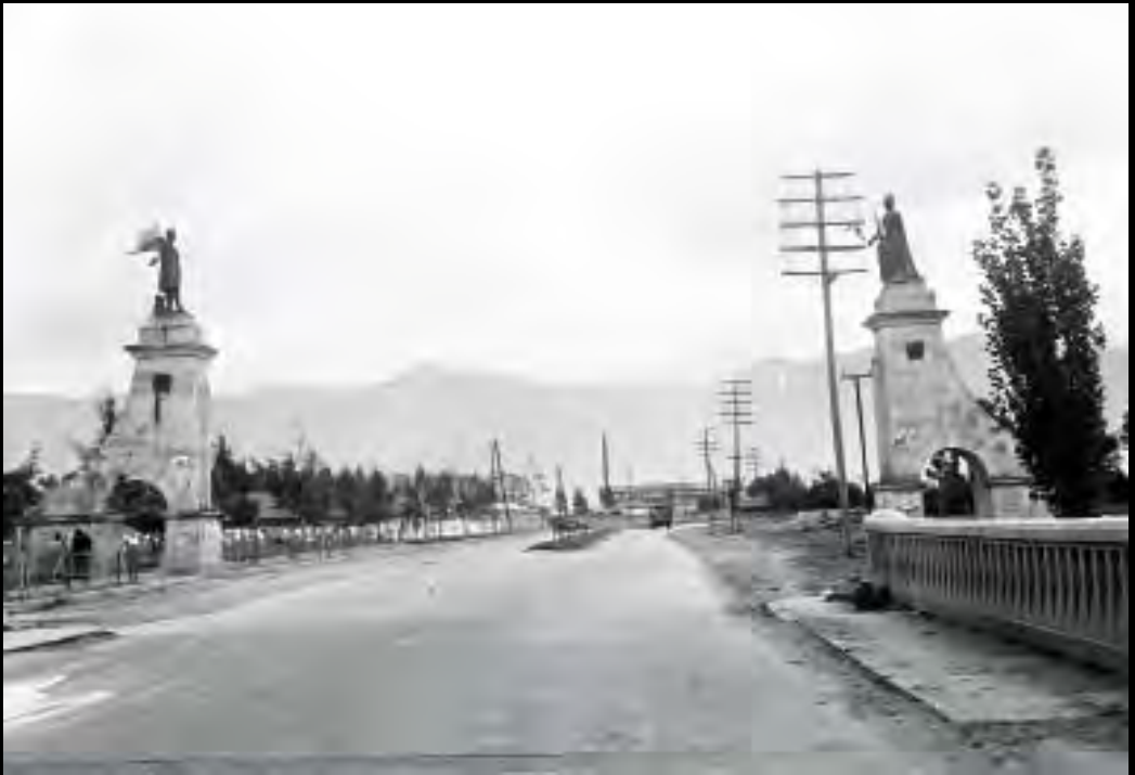
Lámina 2. Monumento a Isabel la Católica y Cristóbal Colón cuando se encontraba emplazado sobre la Avenida de las Américas, circa 1939.