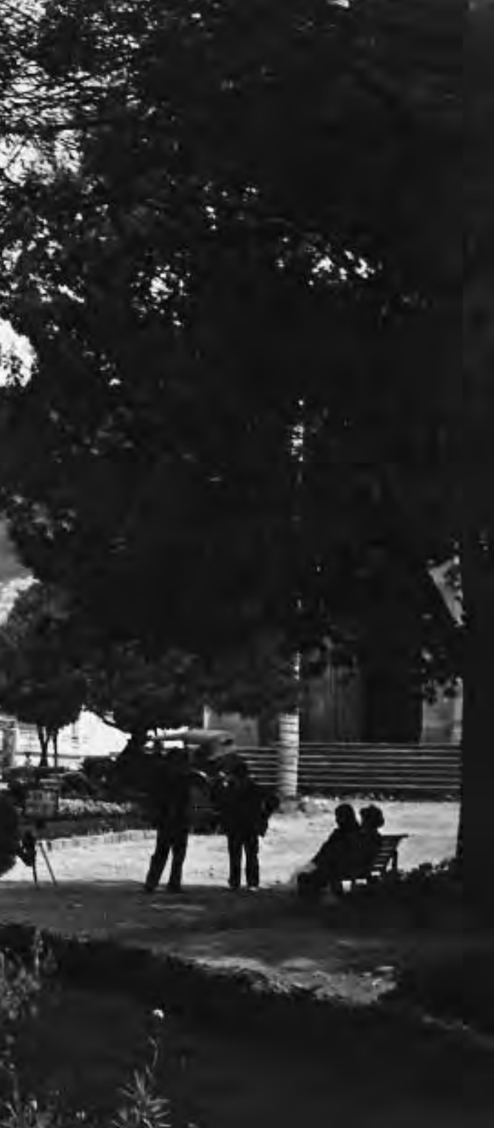
Monumento a José de San Martín en la plaza de Argentina.