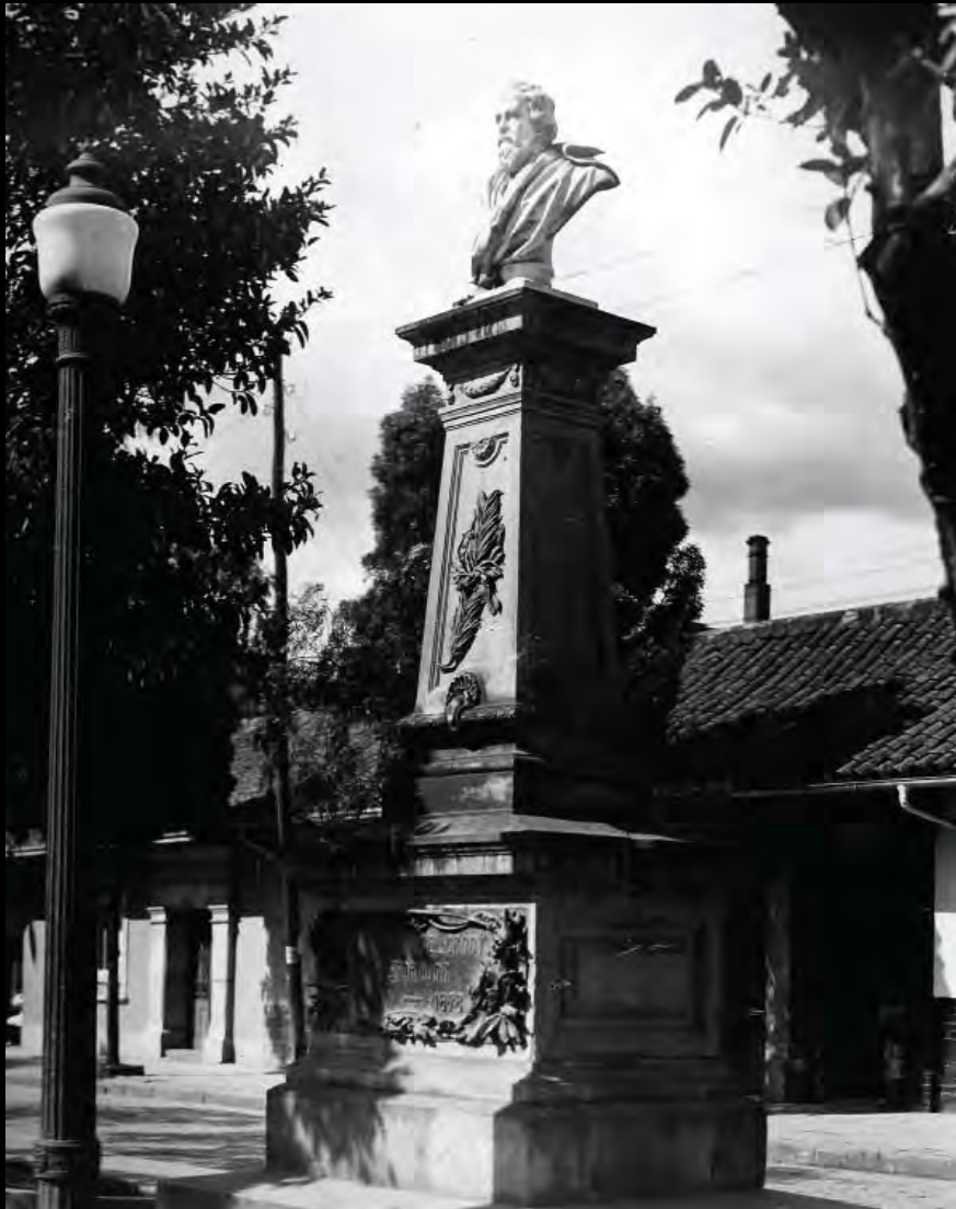
Lámina 19. Monumento a José Manuel Groot. Archivo Sociedad Mejoras y Ornato de Bogotá. s.f