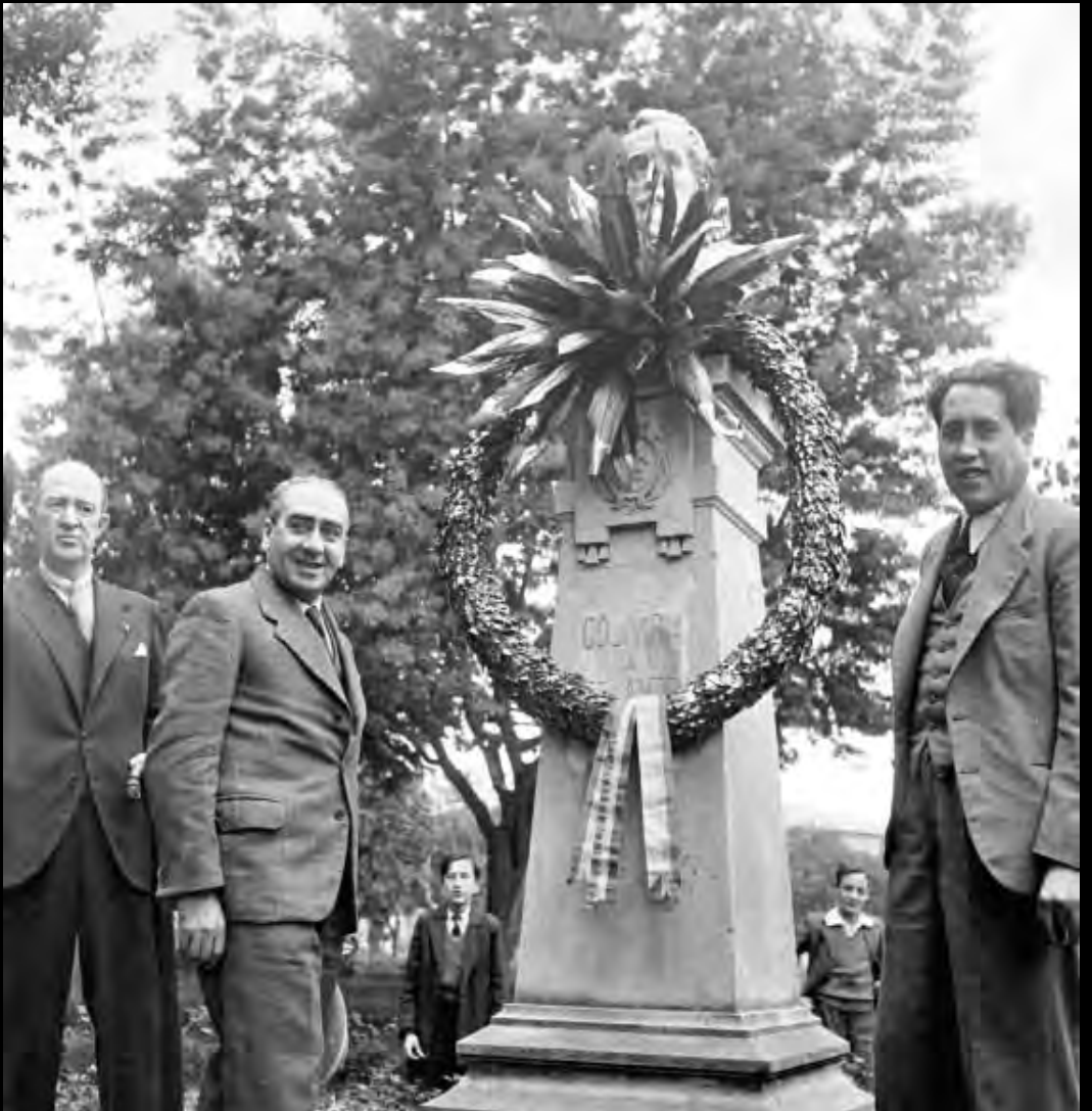
Lámina 5. Monumento a Miguel de Cervantes Saavedra. Circa 1950. Fondo Daniel Rodríguez, Archivo Museo de Bogotá