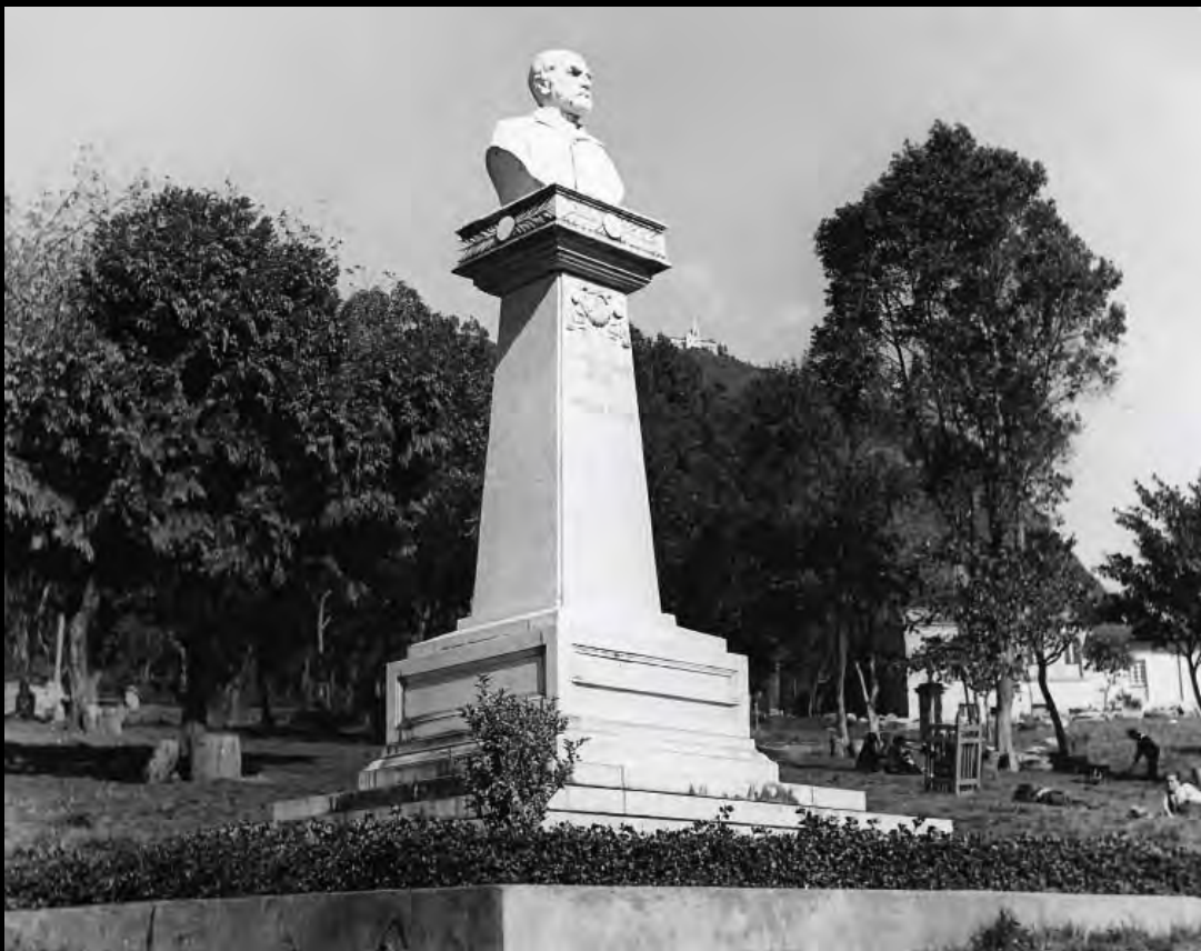
Lámina 23. Monumento a Salvador Camacho Roldán.