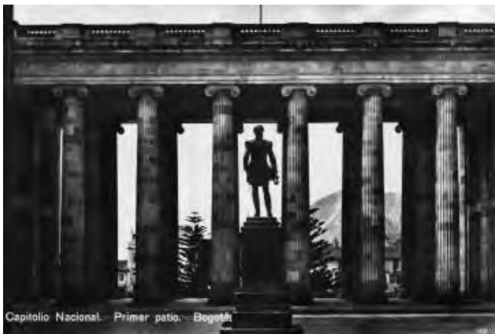
Monumento a Tomás Cipriano de Mosquera, ca 1928. Tarjeta Postal

Mientras la Secretaría de Planeación Distrital ha completado en 2007 un inventario de más de setecientos monumentos y piezas de arte ubicadas en espacio público de la ciudad, el Instituto de Patrimonio, a partir de la investigación que expone esta publicación, promovió la declaratoria de un total de cien monumentos conmemorativos y esculturas que considera merecen ser reconocidos y manejados como Bienes de Interés Cultural por su valor artístico, histórico y simbólico. Es importante aclarar que se trata de una selección que no deja de ser aleatoria. Estamos seguros de que en la medida en que avancemos en la valoración de la totalidad de las obras que por cierto se instalan a diario en parques y avenidas encontraremos probablemente otras tantas obras tan valiosas como las que presentamos a continuación.