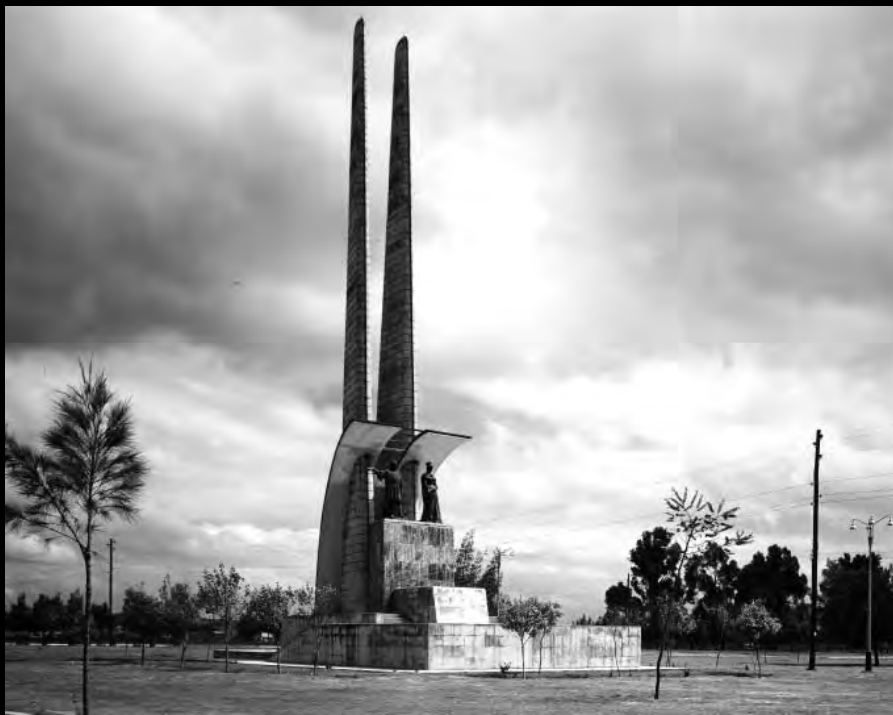
Lámina 2A. Monumento a Isabel la Católica y Cristóbal Colón sobre la glorieta de Puente Aranda. Circa 1952. Fondo Daniel Rodríguez, Archivo Museo de Bogotá.