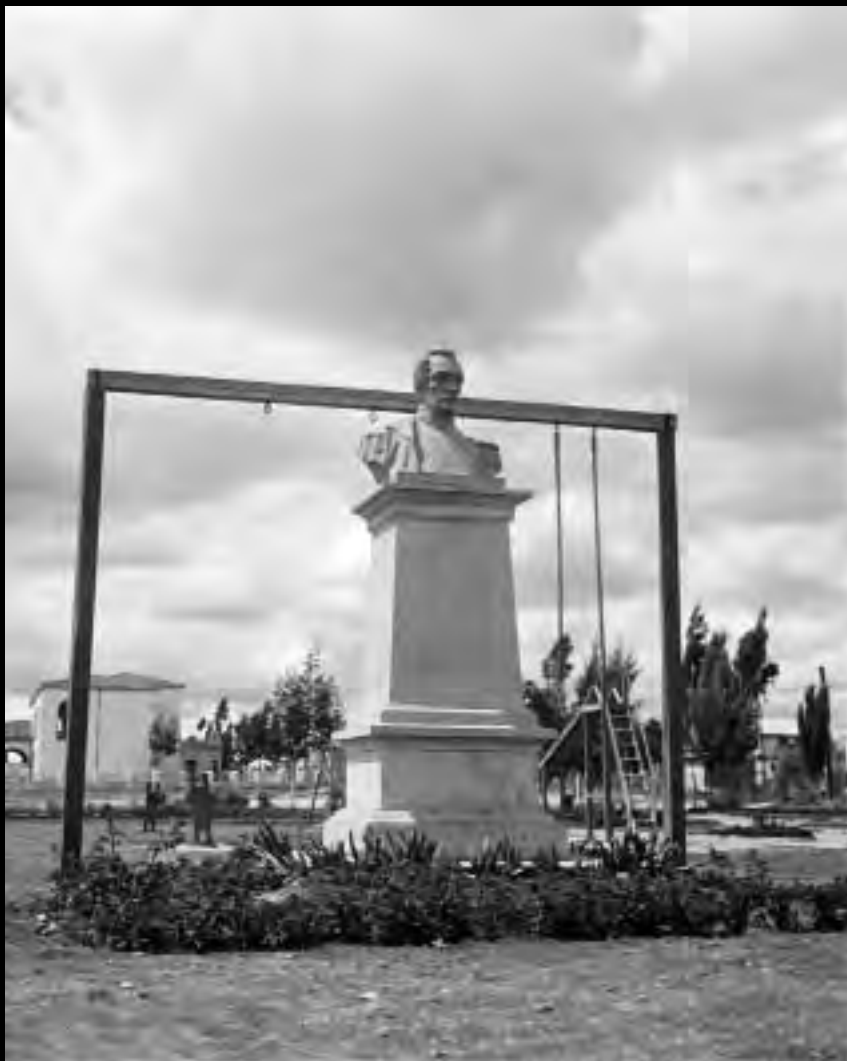
Lámina 3. Monumento a Francisco de Paula Santander, 1943. Fondo Daniel Rodríguez Archivo Museo de Bogotá