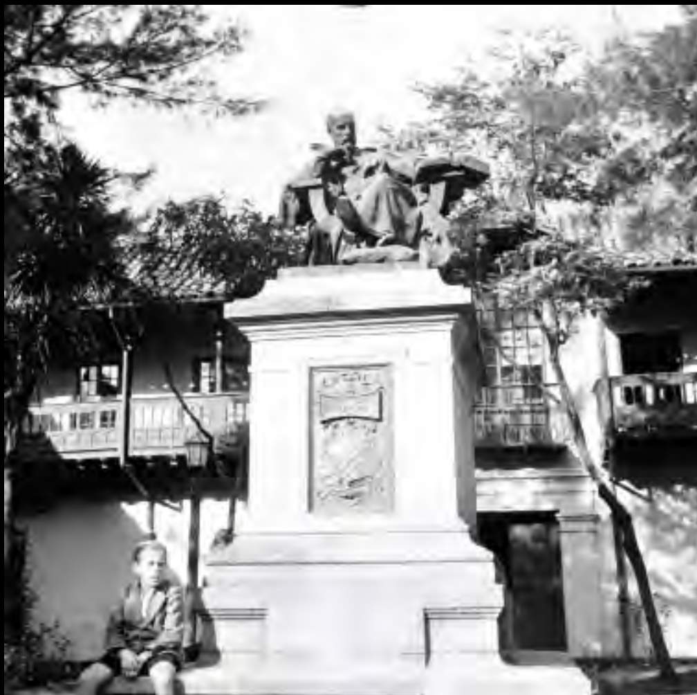
Lámina 3. Monumento a Rufino José Cuervo. Circa 1938.