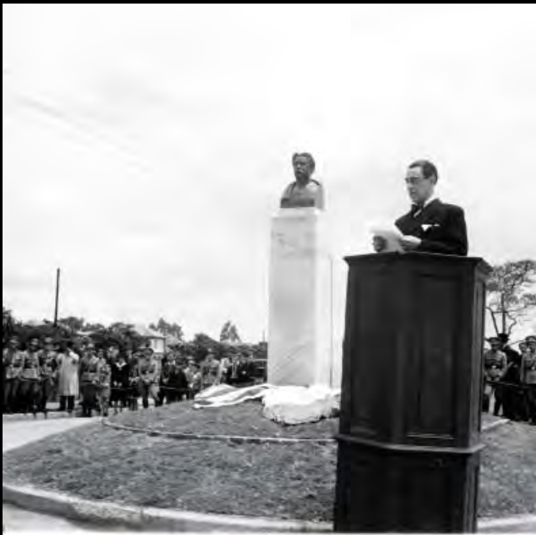
Lámina 4. Inauguración del Monumento a José Enrique Rodó. 1942.