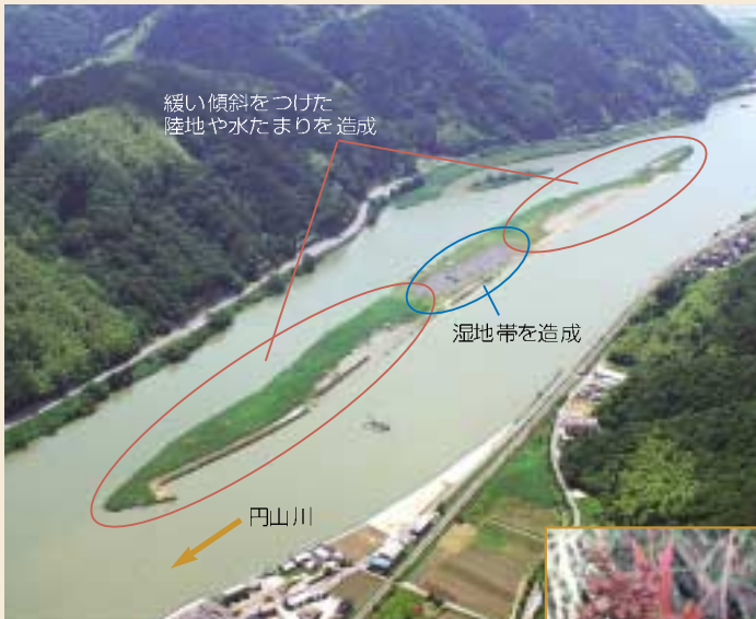
左岸側半分を掘削したひのそ島。これまで約16ヘクタールのこの中洲が、円山川の円滑な流れを妨げてきた。(平成19年6月撮影)