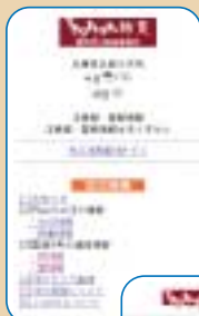
表示イメージ ライブ画像も配信

め、円山川の水位と雨量が規定の数値を超えた時、国道9号の雨量が通行規制値に達した時、気象庁より兵庫県北部地域に注意報・警報が発表された時に、メールでお知らせします。 また、円山川・出石川・奈佐川の14カ所に設置したライブカメラの画像も無料配信。 兵庫北部・但馬の旅を安全・快適に過ごしていただくために、本サイトを活用ください。