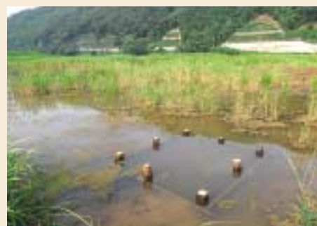
(上) 7月28日に行われた「ひのそ島掘削完成を祝う会」。地元小学生とひのそ島に造成した湿地で、豊岡産どじょうを放流。 (下) 湿地には、巣穴を設けて環境に配慮。