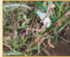
多様な植物を有するひのそ島には、タコノアシ(上)、ホンバイヌタデ(下)などの貴重種が自生している。