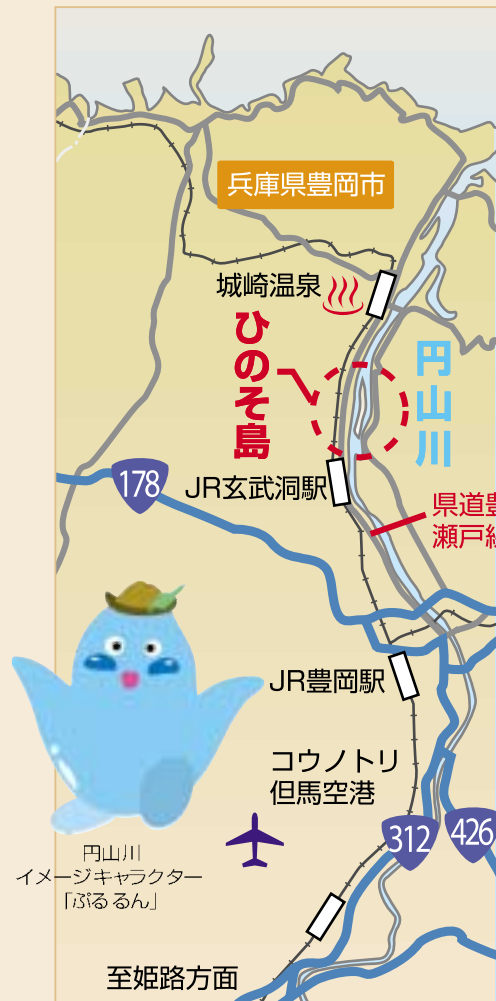
円山川イメージキャラクター「ぶるるん」