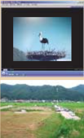
人工巣塔の様子。マスコミ、見学者に掘削土砂の仮置き場を提供。

災害用の衛星通信装置を活用して、ライブ配信を実施 7月31日、兵庫県豊岡市百合地の人工巣塔で、国内の自然界で46年ぶりに、野生のコウノトリのヒナが巣立ちました。