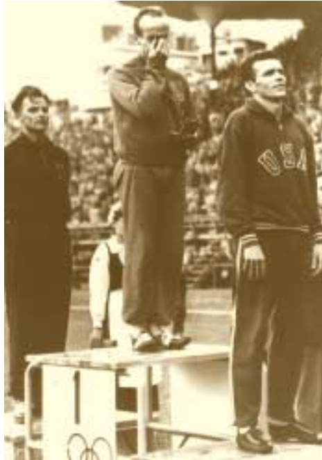
Josy Barthel aux Jeux Olympiques de Helsinki lors de la remise de la médaille d'or pour la course des 1500 m 26 juillet 1952

Au même moment où le Luxembourg s'intègre à la CECA, le gouvernement luxembourgeois est confronté à un autre projet européen commun, celui d'une Communauté européenne de défense (CED) qui doit fournir un cadre au réarmement de l'Allemagne. Au cours des négociations, le gouvernement réussit à faire admettre une représentation à part entière: l'un des neuf commissaires de la CED sera luxembourgeois. Toutefois, la faiblesse démographique du pays ne lui permet pas de remplir les obligations proprement militaires. Ici encore, le gouvernement obtient un traitement spécial du cas luxembourgeois. Le 27 mai 1952, le traité créant la CED est signé à Paris. On sait que cet accord n'aura pas de suite puisque l'Assemblée nationale française refusera la ratification de la CED en 1954.