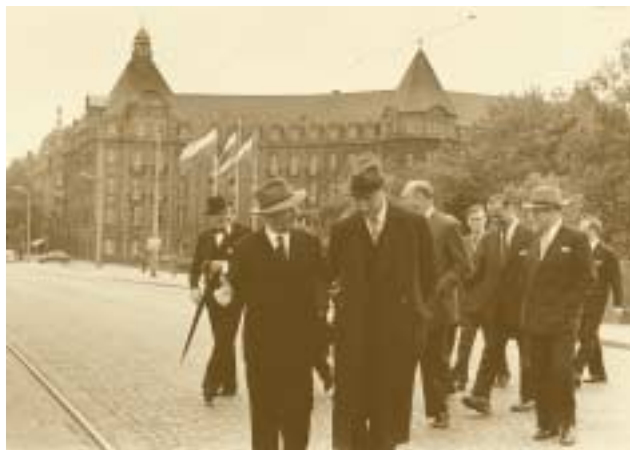
Jean Monnet et Robert Schuman devant le siège de la CECA