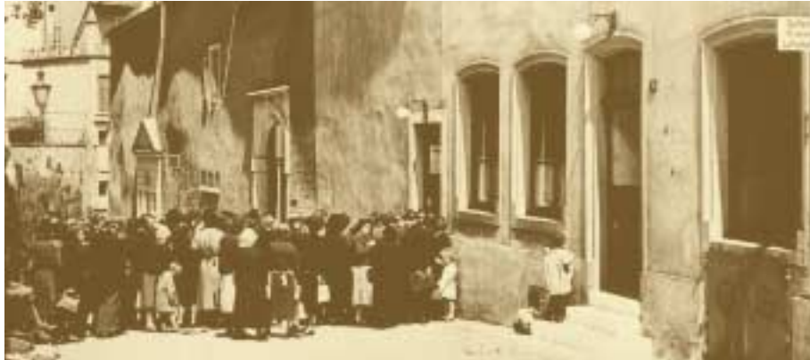
La population fait la queue devant l'Office social dans la rue du Saint-Esprit Batty Fischer – vers 1935