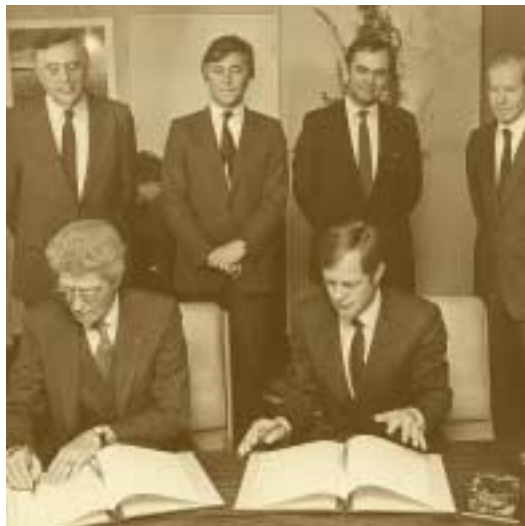
Signature d'un accord de coopération universitaire entre le Luxembourg et la France 10 mars 1982

Chambre des députés vote un ensemble de lois qui entrent en vigueur le 1 er juillet et qui mettent le gouvernement en mesure de poursuivre la restructuration de la sidérurgie conformément aux recommandations du rapport Gandois. Parallèlement, le gouvernement luxembourgeois recherche une coopération avec son homologue belge en vue de susciter des synergies et des échanges de production. Le 9 septembre 1983, une rencontre de ministres belges et