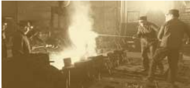
La sidérurgie, principale industrie du pays Edouard Kutter – 1969

En 1968, le gouvernement luxembourgeois doit pour la première fois défendre un intérêt capital du Grand-Duché qui, par la suite, sera contesté plus d'une fois par ses partenaires. Il s'agit de la place financière. Celle-ci a pu se développer depuis le début des années 1960 grâce notamment à une législation bancaire et fiscale très libérale. Or, lors de leur réunion en 1968, les ministres des Finances de la CEE examinent un projet qui vise l'harmonisation de la fiscalité affectant les mouvements des capitaux. Cette proposition se heurte à l'opposition véhémente de Pierre Werner. Conscient du danger que le nivellement des conditions fiscales fait courir à la jeune place financière, le ministre des Finances luxembourgeois propose au contraire de donner la priorité à l'harmonisation monétaire. En effet, les difficultés de la livre sterling, puis du franc français détourneront l'attention des ministres des Finances des spécificités financières luxembourgeoises et mettront à l'avant-plan les questions monétaires.