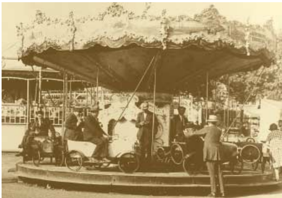
La Schueberfouer, kermesse de Luxembourg 1925

Bien que le Parti socialiste n'ait pas de représentant direct au sein du gouvernement, il constitue, avec le Parti national indépendant, le principal appui du cabinet Prüm. Sous l'impulsion des socialistes, le gouvernement prend un certain nombre de mesures sociales. Ainsi, un des premiers gestes sera le rétablissement des délégations ouvrières dans les entreprises employant au moins 20 ouvriers. Cependant, le projet de loi sur les congés des ouvriers, débattu à la Chambre à partir de mai 1926, finit par diviser les libéraux et les socialistes. N'ayant plus de majorité, le gouvernement Prüm présente sa démission le 22 juin 1926.