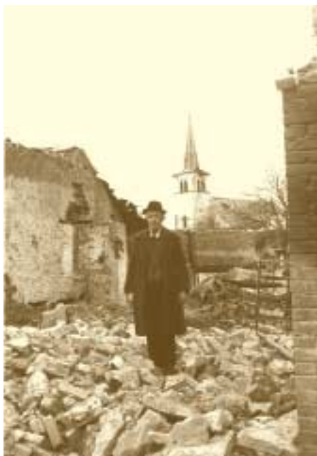
Les dégâts causés par la guerre 1945

sont affectés à des travaux de reconstruction. En matière monétaire, le gouvernement tente également d'éviter trop de rigueur tout en jugulant l'inflation. L'arrêté du 14 octobre 1944 fixe les modalités de l'échange des Reichsmark en francs luxembourgeois. Le Reichsmark , que l'occupant avait introduit au taux de 1: 10, vaut 5 francs mais la première tranche de 100 RM est convertie à 10 francs. La Belgique met à la disposition du Luxembourg les billets nécessaires à l'opération. Si le gouvernement gère avec beaucoup d'habileté les nombreux problèmes socio-économiques de l'après-guerre, la maîtrise d'un souci majeur semble néanmoins lui échapper: celui du rapatriement des quelques 30.000 compatriotes déportés au cours de la guerre. La lenteur de leur retour suscite d'amères critiques.