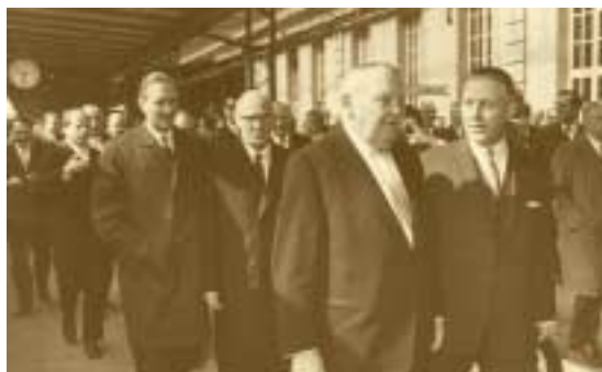
Visite de Ludwig Erhard, chancelier de la République fédérale d'Allemagne, au Luxembourg 1964