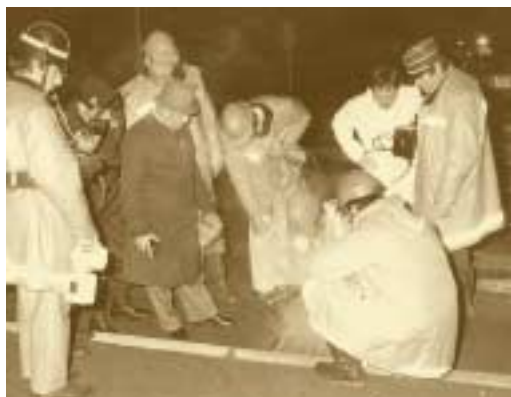
Explosion de gaz due à un attentat à Hollerich 25 juin 1985 et 21 octobre 1985