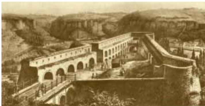
La forteresse de la Ville de Luxembourg avant 1867

Dès son avènement à la tête du gouvernement, le baron de Tornaco s'engage dans la voie de la conciliation sur le plan intérieur. Il abroge un certain nombre d'ordonnances qui ont été octroyées à la suite de la révision constitutionnelle de 1856. Cependant, le monde politique luxembourgeois reste singulièrement divisé. Dans son autobiographie, Emmanuel Servais décrit les luttes politiques qui agitent l'élite luxembourgeoise de l'époque: "Ce n'étaient pas des questions politiques, mais des animosités personnelles qui excitaient les passions. Les luttes électorales étaient parfois conduites avec une vivacité extraordinaire et donnaient lieu à des dépenses fabuleuses; les discussions à la Chambre étaient irritantes quand même elles n'avaient pour objet que des affaires de moindre importance; la polémique des journaux était d'une insolence excessive."