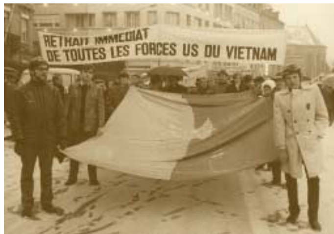
Les mouvements de gauche luxembourgeois manifestent contre la guerre au Vietnam 15 décembre 1969