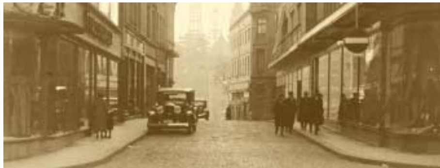
Nouveaux magasins à Luxembourg Coin Rue du Fossé-Grand Rue Batty Fischer – 1936