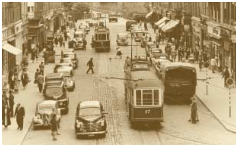
Avenue de la Gare à Luxembourg 1954

La politique intérieure des années 50 est placée sous le signe de la modernisation. Sur le plan politique, une innovation importante est l'abandon du renouvellement de la Chambre par moitié tous les trois ans et l'instauration d'élections générales tous les cinq ans. Le système des élections partielles, organisées seulement dans deux des quatre circonscriptions – l'une urbaine ou industrielle, l'autre rurale – était destiné, dans une optique conservatrice, à éviter des changements politiques jugés trop brusques. Le 30 mai 1954 ont lieu des élections générales dans les quatre circonscriptions après que les députés ont déclaré sujets à révision un certain nombre d'articles de la Constitution. La révision constitutionnelle des 27 juillet, 25 octobre et 2 novembre 1956 fixe uniformément le mandat des députés à cinq ans et ajoute un article 49 bis qui permet le transfert de souveraineté à des institutions internationales.