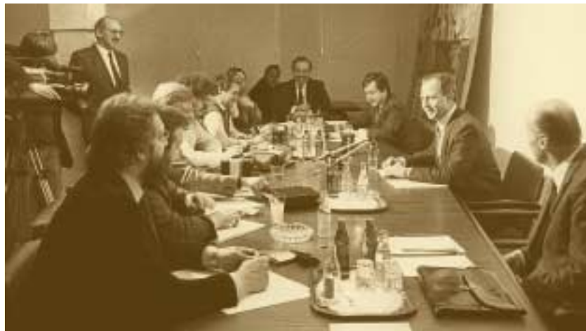
Le Premier ministre donne une conférence de presse 23 novembre 1985