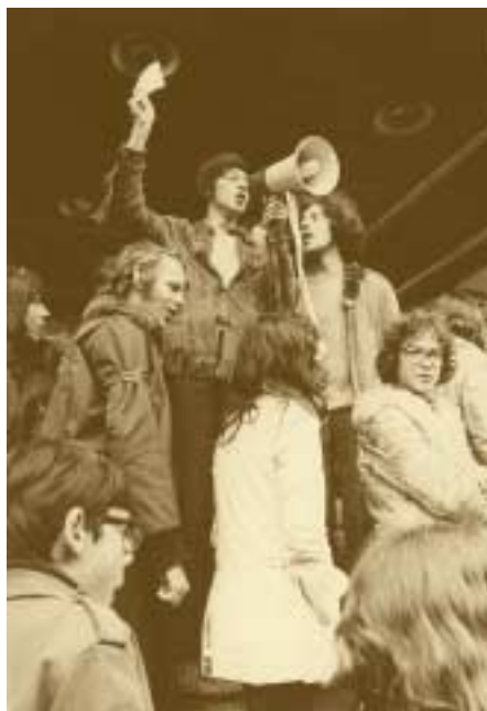
Manifestation des étudiants luxembourgeois 28 avril 1971

risque d'accélérer la spirale de l'inflation. Marcel Mart, ministre de l'Économie à l'époque, a parlé d'une "conjoncture aiguë". Dès lors, l'action du gouvernement vise à contrer les effets pervers de la surchauffe économique par un renforcement du contrôle des prix, par l'injonction donnée aux établissements de crédit et aux caisses de pension de freiner leur politique de crédits et de prêts, par l'autorisation temporaire du travail de samedi dans le secteur de la construction particulièrement touché par la pénurie de la main-d'œuvre, par la diminution des taux de la TVA sur un certain nombre d'articles de large consommation avec forte incidence sur l'indice des prix et, enfin, par l'introduction d'une surtaxe