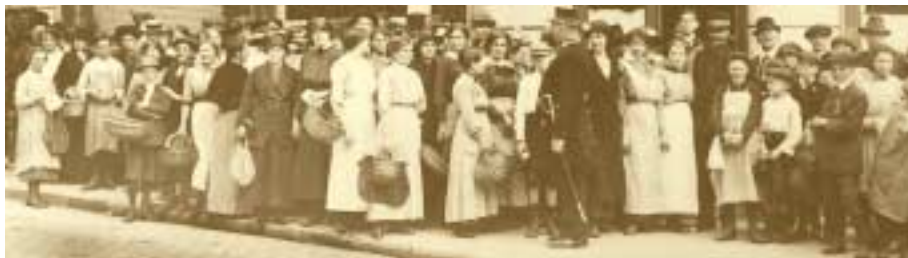
Vente de sucre et d'œufs à la centrale ouvrière de la ville de Luxembourg 1916