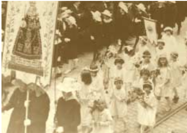
Procession finale de l'Octave, pèlerinage vers Notre-Dame de Luxembourg 1920

l'ordre dans le bassin minier. La grève des ouvriers de la sidérurgie échoue aussi parce qu'elle ne parvient pas à mobiliser d'autres catégories professionnelles. Dans l'immédiat après-guerre, le gouvernement accorde aux employés privés, aux fonctionnaires et aux cheminots une nette amélioration de leur statut. La loi du 31 octobre 1919 offre aux employés privés une série d'avantages qui les différencient des ouvriers : délégations distinctes, durée de travail limitée à huit heures par jour, congé payé annuel de dix à vingt jours selon l'ancienneté de service et garanties en matière de sécurité de l'emploi. La loi du 14 mai 1921 attribue aux cheminots un statut proche de la fonction publique notamment en ce qui concerne le régime des pensions et de la sécurité de l'emploi. Quant aux fonctionnaires, ils obtiennent l'indexation de leurs traitements. Tirant la leçon de la grève, le gouvernement met en place des organismes de concertation et de consultation. La loi du 4 avril 1924 crée cinq chambres professionnelles : la Chambre de commerce (qui existait déjà auparavant), la Chambre des artisans, la Chambre de travail, la Chambre des employés privés et la Chambre de l'agriculture.