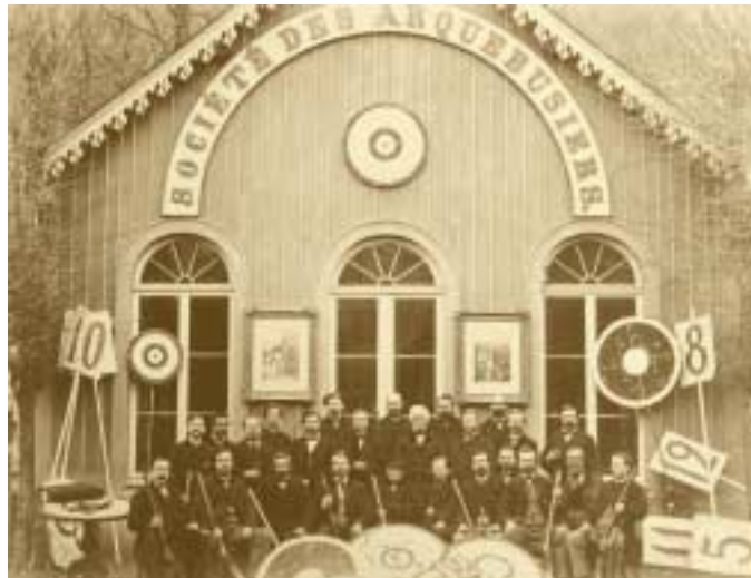
Les membres de la Société des Arquebusiers posent devant leur chalet à Luxembourg 1890