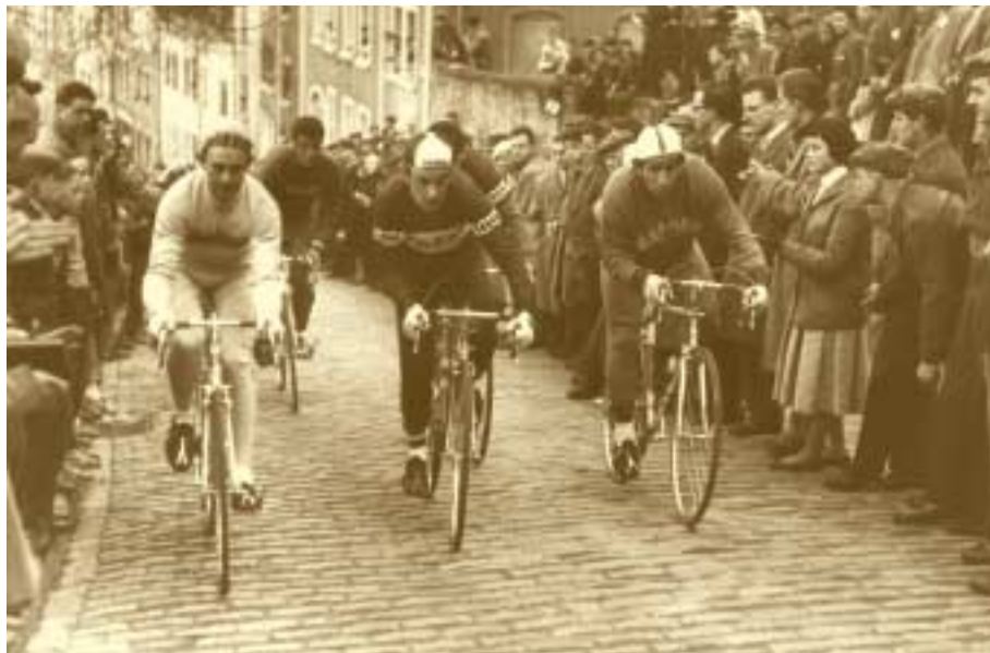
Charly Gaul, vainqueur du tour de France en 1958, dans la montée de la rue Large à Luxembourg 1958