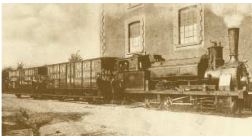
Transport de champagne Mercier fabriqué à Luxembourg 1886