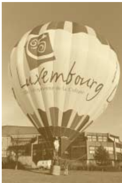
Luxembourg, Ville européenne de la Culture Raymond Faber – 1995