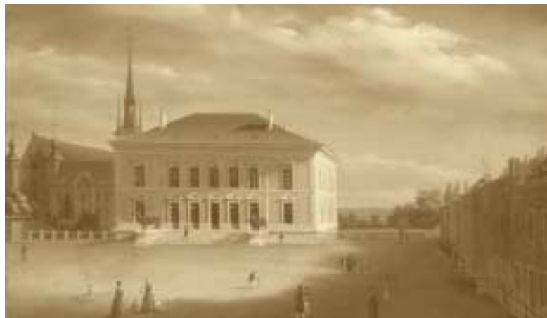
Tableau de Jean-Auguste Marc (1818 – 1886)