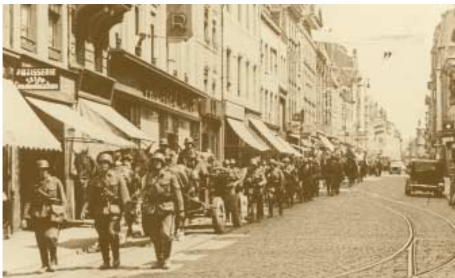
La Ville de Luxembourg sous l'occupation allemande Passage des troupes allemandes dans la Grand-Rue Tony Krier – 10 mai 1940