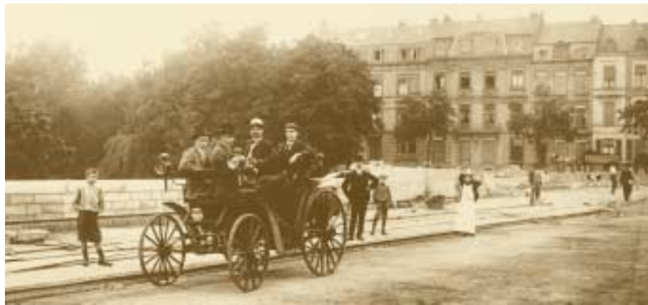
La première voiture sur le pont Adolphe 1903

Pendant les années Eyschen, l'agriculture luxembourgeoise réalise des progrès impressionnants. Le gouvernement prend une part décisive dans ce développement en diffusant l'enseignement agricole, en encourageant le perfectionnement des méthodes d'élevage et de culture, en favorisant la création de coopératives agricoles et en stimulant l'utilisation de l'engrais chimique. La sidérurgie offre à l'agriculture luxembourgeoise un engrais chimique efficace et bon marché : la scorie issue du procédé inventé par Thomas et Gilchrist. Le gouvernement oblige les industriels à fournir des scories Thomas aux agriculteurs à un prix préférentiel, en faisant dépendre l'attribution de nouvelles concessions minières de ces livraisons. Le gouvernement Eyschen encourage aussi la viticulture luxembourgeoise à s'orienter vers la production de vins de qualité. En 1909, une loi et un arrêté fixent le régime des vins et organisent leur contrôle. Déjà en 1892, la création d'un service de phytopathologie permet de mieux combattre le phylloxera.