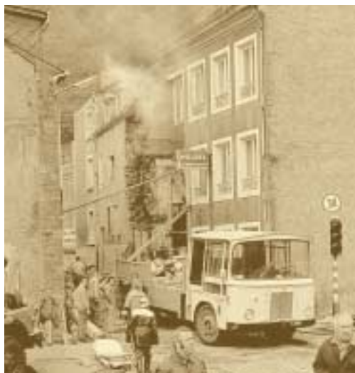
Explosion d'une conduite de gaz au Pfaffenthal Antoine Davito – 1976

patronat et des syndicats. La conférence tripartite "sidérurgie" parvient à un premier accord conclu le 19 mars 1979 et mis en œuvre par la loi du 8 juin 1979, sur la restructuration et la modernisation de la sidérurgie. Cette institutionnalisation de la coopération entre partenaires sociaux a été présentée ultérieurement comme "modèle luxembourgeois". Quoiqu'il en soit, la tripartite a permis de gérer de façon consensuelle une crise structurelle qui était en train de devenir un problème de solidarité natio-