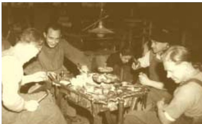
Fabrique de chaussures Vooser 5 janvier 1949

Suivant en cela la politique des Alliés, le Luxembourg procède à une normalisation de ses relations avec l'Allemagne. En 1949, le gouvernement luxembourgeois renonce à ses revendications territoriales, ne gardant qu'une forêt près de Vianden, le Kammerwald , en gage de paiement des réparations de guerre.