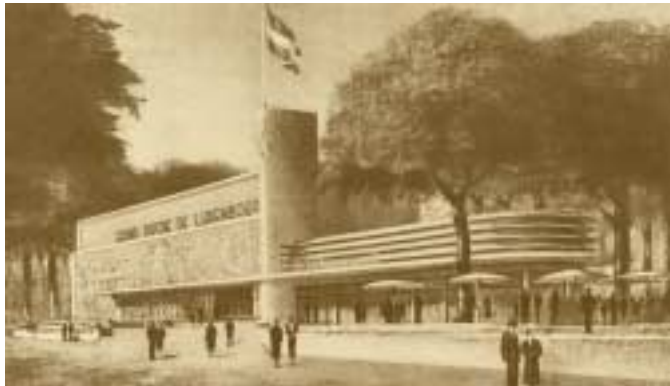
Pavillon du Grand-Duché de Luxembourg à l'Exposition internationale de Paris 1937

ont lieu le 6 juin 1937 dans les circonscriptions du Nord et du Centre. À la surprise générale, 50,67 % des électeurs votent non. Aux élections, le Parti de la droite parvient à garder tous ses sièges mais les libéraux subissent des pertes importantes. Les socialistes sortent vainqueurs du scrutin. Même si un maintien de la coalition gouvernementale est théoriquement possible (31 sièges sur 55), Bech se sent désavoué et donne sa démission.