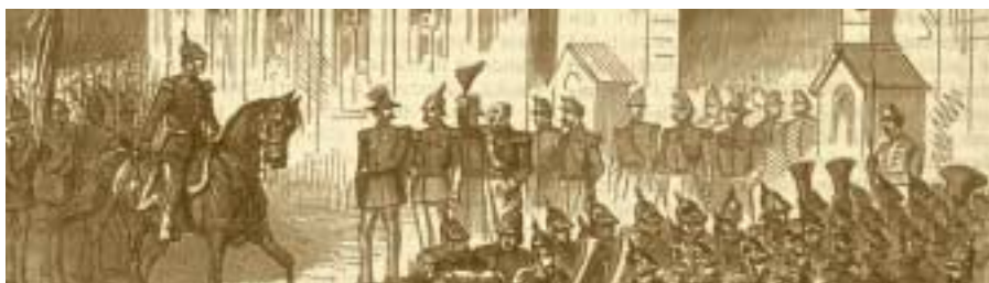
Défilé du dernier bataillon de la garnison prussienne devant le prince Henri des Pays-Bas 21 septembre 1867