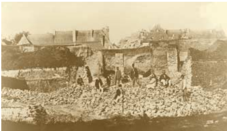
Démantèlement de la forteresse de Luxembourg Percée de l'avenue Monterey 1869