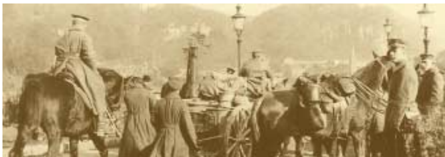
La retraite de l'armée allemande – novembre 1918

La démocratisation aura profité à la droite dans un pays où, malgré les progrès de l'industrialisation la majorité de la population reste attachée à une mentalité rurale, traditionnelle et conservatrice. Le libéralisme qui avait régné en maître absolu sur le 19 e siècle perd du terrain. Dans la Constituante, les libéraux tentent encore de mener un combat d'arrière-garde en s'opposant au vote des femmes, qu'ils présument favorables aux catholiques. En vain. Le Parti de la droite dirigera les gouvernements successifs pendant le reste du siècle, abstraction faite de deux interruptions entre 1925 et 1926 et entre 1974 et 1979. Afin de tenir compte de la nouvelle majorité, les directeurs généraux Collart, Liesch et Welter présentent leur démission. Cependant, la grande-duchesse et le ministre d'État la refusent, désirant le maintien du gouvernement d'union nationale qui avait réussi à traverser la crise de 1918–1919. Collart quitte le gouvernement en janvier 1920, Liesch et Welter en avril 1921. À partir de ce moment, le cabinet sera exclusivement de droite. Les élections partielles qui ont lieu dans les circonscriptions du centre et du nord le 28 mai 1922 ne changent rien à cette situation, même si les libéraux améliorent leur score électoral au détriment des socialistes.