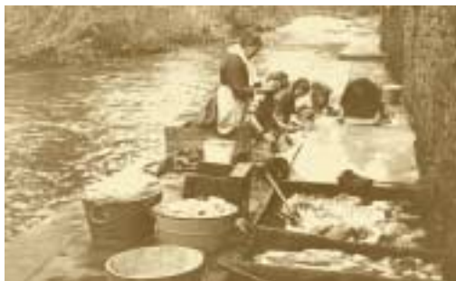
Krigelsbur Lavoir au niveau de l'Alzette (entre Clausen et Grund près du pont du Stierchen) Batty Fischer – 1905

Avec le début du 20 e siècle, les tensions internationales augmentent. Le gouvernement se réfugie derrière le statut de neutralité qui, il l'espère, garantira l'indépendance du pays. En 1899, puis en 1907, Paul Eyschen participe aux deux conférences de La Haye sur le désarmement en y plaidant la cause des États neutres. Le choc sera grand quand, le 2 août 1914, l'armée allemande envahit le pays suivant la stratégie du plan Schlieffen. Le gouvernement luxembourgeois proteste contre la violation du territoire mais continue à observer une stricte neutralité envers tous les belligérants. La réponse de Berlin se veut rassurante mais les plans secrets de l'état-major allemand comptent le Luxembourg parmi les buts de guerre. En attendant la victoire, l'occupation allemande se limite au domaine militaire. L'occupant ne touche pas, à de rares exceptions près, aux institutions et rouages de l'État qui continuent à fonctionner comme si de rien n'était. De son côté, Eyschen s'accroche à une politique de neutralité tous azimuts, se gardant bien de dénoncer le Zollverein . Afin de préserver autant que possible la population des rigueurs de la guerre, le gouvernement optera pour la cohabitation avec l'occupant.