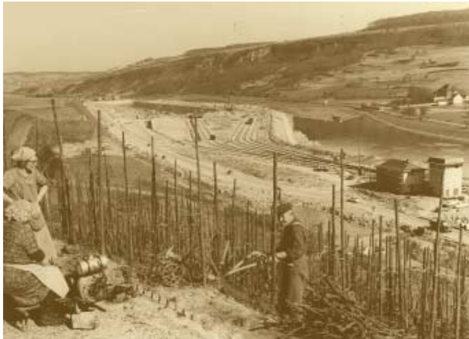
Vignobles de la Moselle En arrière-fond, construction du port de Mertert 1966

votée le 16 août 1967. Celle-ci prévoit la construction d'environ 150 km de grandes routes dans un délai de dix ans et la création d'un fonds des routes destiné à soustraire les dépenses au principe de l'annuité du budget et à garantir la continuité des travaux. L'entreprise s'avère de longue haleine puisque la connexion définitive au réseau autoroutier international sera seulement achevée dans les années 1990.