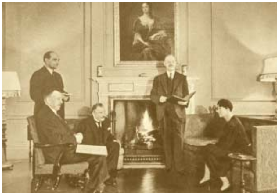
Le gouvernement en exil et la grande-duchesse Charlotte à Londres

une commission administrative composée de conseillers de gouvernement et présidée par Albert Wehrer entre en fonction. Elle essaie de combler le vide laissé par le départ de l'exécutif et espère trouver un arrangement avec les autorités militaires allemandes. La commission administrative et la Chambre des députés lancent même un appel à la grande-duchesse lui demandant de revenir au Luxembourg. Les autorités luxembourgeoises restées au pays n'ont pas encore abandonné l'espoir que dans le nouvel ordre européen dominé par l'Allemagne hitlérienne, le Grand-Duché pourra garder son indépendance. À Lisbonne, le mois de juillet se passe dans le doute. Alors que Dupong et la souveraine penchent pour le retour, Bech est réticent. L'annexion de fait du Luxembourg par l'Allemagne met brutalement fin aux hésitations. Le 29 juillet 1940, Gustav Simon, Gauleiter du Gau Coblence-Trèves est nommé Chef der Zivilverwaltung au Luxembourg. Toutes les institutions de l'État luxembourgeois sont supprimées. La grande-duchesse et le gouvernement décident de rejoindre définitivement le camp des alliés et optent pour un double siège. La famille grand-ducale, Pierre Dupong et, dans un premier temps, Victor Bodson s'établissent à Montréal, ville francophone à proximité des États-Unis. Joseph Bech et Antoine Krier restent à Londres qui est le siège d'autres gouvernements en exil, notamment ceux de Belgique et des Pays-Bas.