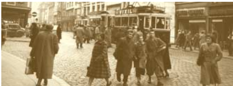
La Grand-Rue, principale rue commerçante de la ville de Luxembourg 16 décembre 1953

Après la signature du traité de Paris qui crée la CECA (18 avril 1951) se pose la délicate question du siège de la nouvelle institution. Du 23 au 25 juillet 1952, les ministres des Affaires étrangères des six pays membres se rencontrent à Paris pour trouver une solution. Plusieurs villes, parmi lesquelles Luxembourg, ont posé leur candidature. Aucune ne fait l'unanimité. La Haute Autorité et la Cour de justice risquent de ne pas pouvoir démarrer, faute de siège. C'est dans cette impasse que le ministre des Affaires étrangères luxembourgeois Joseph Bech, probablement inspiré par Adenauer, entreprend une manœuvre diplomatique qui déterminera l'avenir européen du Grand-Duché. Bech retire la candidature de Luxembourg et propose ensuite la capitale du Grand-Duché comme "lieu de travail" provisoire. Les autres pays acceptent cette voie d'issue qui reporte la décision concernant le siège définitif des institutions européennes à une date incertaine. Le 10 août 1952, la Haute Autorité tient sa première réunion solennelle à l'Hôtel de Ville de Luxembourg sous la présidence de Jean Monnet.