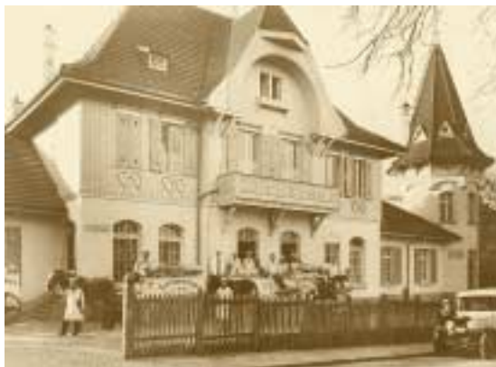
La laiterie centrale boulevard d'Avranches M. Kutter – vers 1932

Dès 1930, la crise mondiale déclenchée par le krach de Wall Street touche aussi bien le Luxembourg que la Belgique. La production et les exportations commencent à s'effondrer. La crise a inévitablement des répercussions sur le fonctionnement de l'UEBL, puisqu'elle provoque dans tous les pays touchés un retour vers le protection-