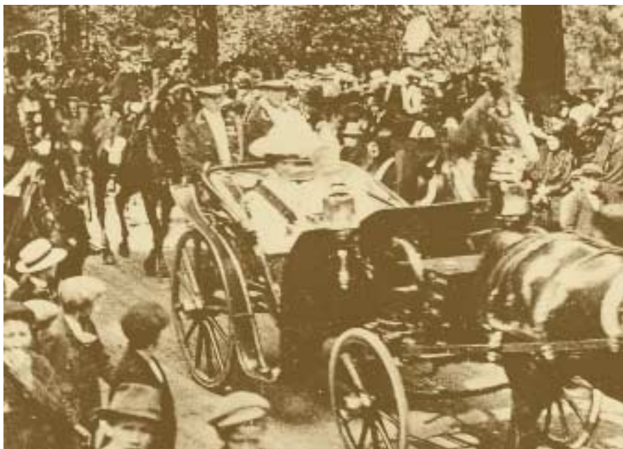
S.A.R. la grande-duchesse Marie-Adélaïde se rend à la Chambre des députés pour sa prestation de serment 18 juin 1912