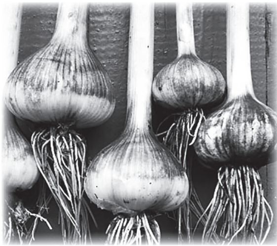
По материалам СМИ.

В первых числах августа убирают лук-севок (как только перо начинает желтеть и ложиться). А с 15 августа убирают лук и репку.