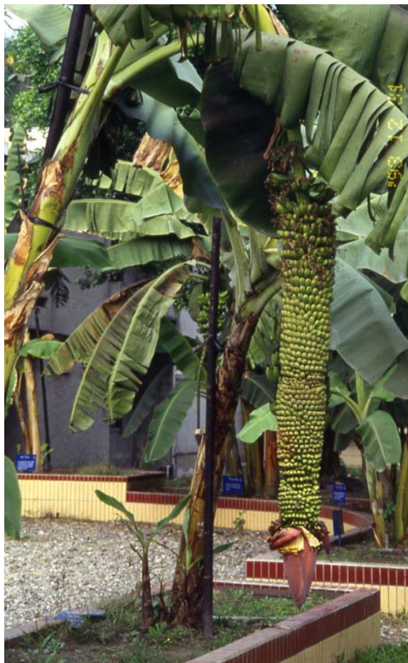
Musa chiliocarpa 千層蕉 ( Pisang seribu , Thousand Finger)