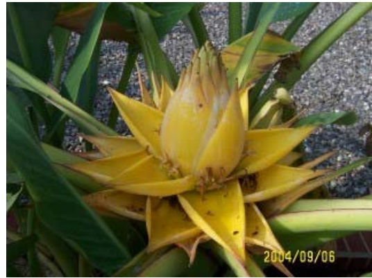
地涌金蓮 (Golden lotus)