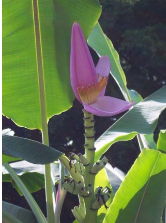
Musa ornata 紫夢幻蕉