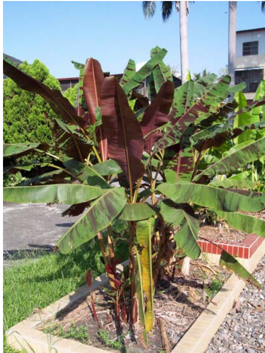
Musa acuminata spp zebrina 斑葉蕉 (Bloodleaf banana)