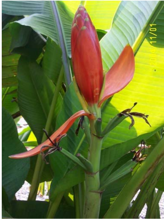
Musa beccarii 腊紅夢幻蕉